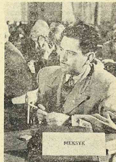
PRZEWODNICZĄCY DELEGACJI INTELEKTUALISTÓW MEKSYKU

Galerię ciemnoskórych delegatów przewyższa przedstawiciel Indii holenderskich, usępującej miejsce czarnemu przedstawicielowi zachodniej Afryki francuskiej.