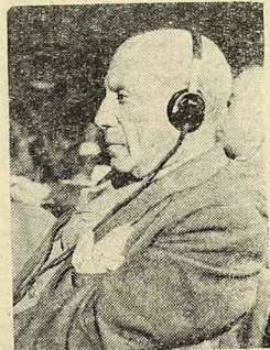
SŁAWNY ARTYSTA - MALARZ PABLO PICASSO

on „największą zbrodnią i największym gwałtem naszego stulecia”. Podkreślił jednak, że w Niemczech owo „głupstwo” przygotowuje się po raz trzeci. Goebbels znalazł w Niemczech tysiące neofitów, tworzących w tym kraju punkt oparcia dla ponownego zepchnięcia świata w przepaść.