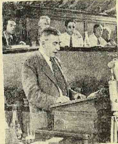
ILIJJA ERENBURG NA TRYBUNIE