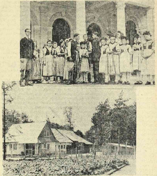
W tych dniach na Wystawie Ziemi Odzyskanych wystąpił jeden z najlepszych zespołów amatorskich wsi dołnośląskiej. Na górnym zdjęciu: grupa artystów wiejskich. U dołu: wzorowa osada wiejska na WZO

TEL - AVIV. — Tymczasowy rząd państwa Izrael odrzucił propozycję hr. Bernadotte w sprawie zawieszenia broni w Jerozolimie.