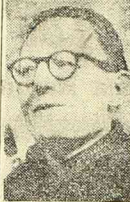
Przed głosowaniem premier Schuman zapowiedział, że w wypadku nieprzyjęcia zaleceń konferencji londyńskiej przez Zgromadzenie Narodowe, będzie zmuszony ustąpić z rządu.

8 głosów większości przy 20-tu wstrzymujących się PARYŻ - Większością 8 głosów Francuskie Zgromadzenie Narodowe zatwierdziło z pewnymi zastrzeżeniami uchwały