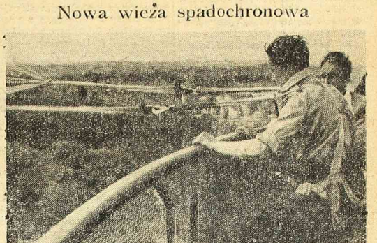
Nowa wieża spadochronowa. W Łodzi dnia 9.5.48 nastąpiło otwarcie wieży spadochronowej w Parku Ludowym. W blizszym miesiącu ta wieża zostanie oddana Lidze Lotniczej by mogła służyć szkoleniu nowych kadr skoźków spadochronowych.