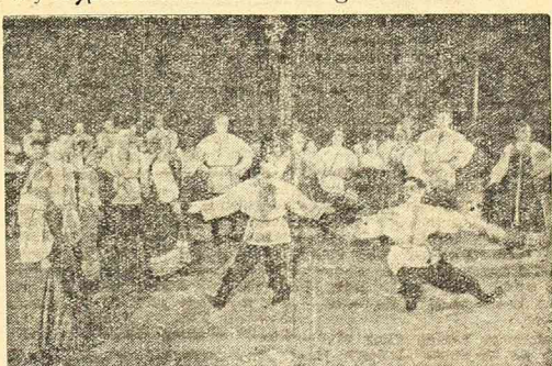
Effektowny taniec ludowy „Gusaczok”