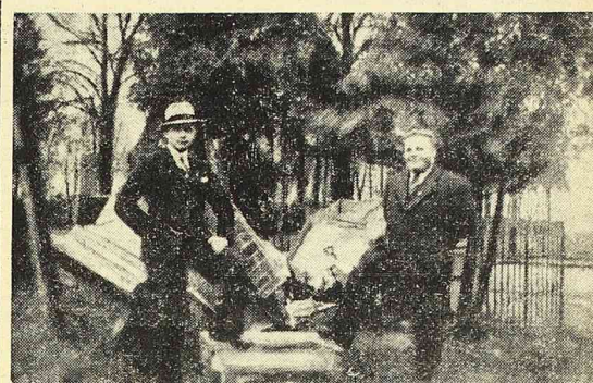
W czasie gdy w Watykanu wysyłane są oredzia do biskupów niemieckich, zagrażające naszemu narodowi „sądem historii” — warto przypomnieć „dzieła” Niemców, bestialsko niszczących w Polsce podczas wojny przedmioty kultury religijnej.

Wiadomość o wypadkach szybko obiegła najbliższe okolice, wywołując w całym stanie piorunujące wrażenie. Władze usiłują uspokoić ludność, jak dotychczas — bezskutecznie.