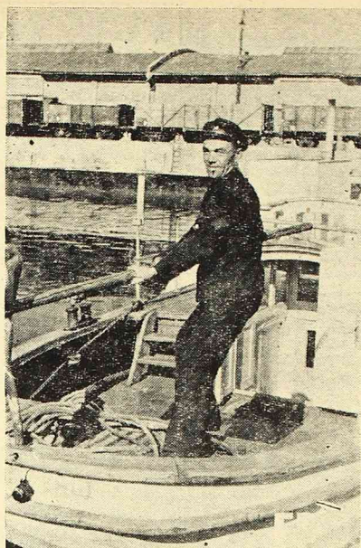
Żegluga na Odrze odbywa się już całą parą. Odra roi się od statków polskich i czechosłowackich. Do Szczecina płynię w świat węgiel polski, ze Szczecina ruda i inne towary. Krają też statki pasażerskie. Nasi marynarze udł słodkich mają sporo zajęcia.