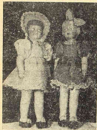
Oto lalki dla naszych miłośników.