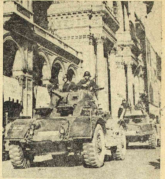
Jeszcze jeden argument, który miał nakłonić Włochów, aby głosowali na zwolenników bloku imperialisty cznego: policyjne samochody patrolowe na ulicach miast.