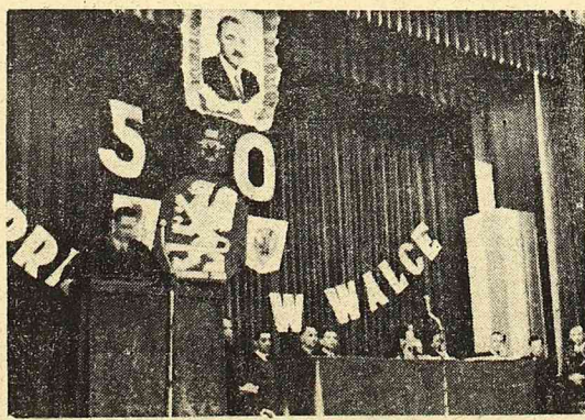
W dniu 4 km. odbył się uroczysty obchód 50-lecia istnienia Zw. Zawodowego Pracowników Poligraficznych.

Szkody wyrządzone w biurach „Ciba” oblicza się na ponad 100.000 dolarów. Była to największa katastrofa w „Empire State Building” od 28 lipca 1945 r., gdy samolot wojskowy uderzył w budynek powodując śmierć 14 osób.