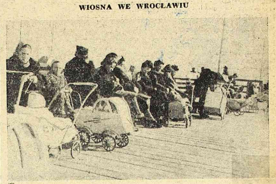
Najmłodzi wrocławianie cieszą się słońcem

W rozmowie Lipskiego z Goeringiem na przyjęciu u ambasadora włoskiego w Berlinie, Goering wyrażał gorącą chęć omówienia perspektyw dalszego zbliżenia polsko-niemieckiego, proponując zaprzestanie wzajemnej działalności szpiegowskiej i wymianę informacji, dotyczących ZSRR i Czechosłowacji. Powiedział on, iż po rozwiązaniu sprawy czeskiej aktualna stanie się sprawa rosyjska, stwierdzając, że w wypadku konfliktu polsko-radzieckiego Niemcy nie zachowają neutralności i udzielił Polsce pomocy. Goering zapewniał, że Niemcy nie chcą Ukrainy, sugerował natomiast, że Polska mogłaby mieć bez-