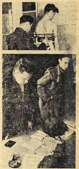
W całym kraju rozpoczęły się badania lekarskie młodzieży, która zostanie powołana w dniu 1 maja w szeregi „Służby Polsce”