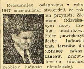
Wiceminister Ziemi Odzyskanych, ob. Dubiel.

WROCLAW. (PAP) — W dniu 5 bm. na konferencji przewodniczących powiatowych i miejskich Rad Narodowych, przewodniczących wydziałów powiatowych i starostów oraz prezydentów miast wydziałych z terenu Dolnego Śląska, wiceminister Ziemi Odzyskanych, ob. Dubiel omówił osiągnięcia i aktualne zadania administracji na Ziemiach Zachodnich.