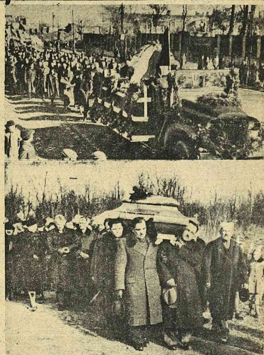
Kondukt pogrzebowy śp. Maksymiliana Malinowskiego, nestora ruchu ludowego w Polsce