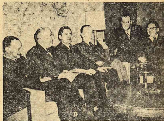
Komisja do spraw podziału Palestyny. Od lewej: Aleksander Parodi (Francja), Warren Austin (USA), Andrzej Gromyko (ZSRR), Aleksander Cadogan (Zjedn. Król. W. Bryt.), Trygve Lie — Sekr. Gen. ONZ oraz dr T. F. Tsiang (Chiny)