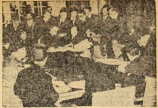
Podpisanie traktatu handlowego radziecko - egipskiego w Kairze.

Również rekordowymi cyframi może się pochwalić rolnictwo radzieckie. W porównaniu z rokiem 1946 produkcja wzrosła w 1947 roku o 58%, bawełny o 21%, ziemniaków o 30%, buraków cukrowych o 19%, soneczników o 79%, lnu o 29%, konopi o 78%. Urodzaj zbóż chlebnych osiągnął poziom przedwojenny. Obfity zbiór zbóż chlebnych i innych produktów rolnych pozwolił Związku Radzieckiemu przyjąć z pomo-