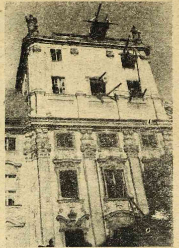
Na Rynku wrocławskim zadomowiły się gołębie, karmione przez przechodniów, jak na placu Marjańskim w Krakowie. Na Placu Solnym sprzedają bazy, zwiazany przedwiośnia i Niedzieli Palmowej. Wre praca przy odbudowie gmachu Uniwersyteckiego. Oto — powszedni dzień Wrocławia