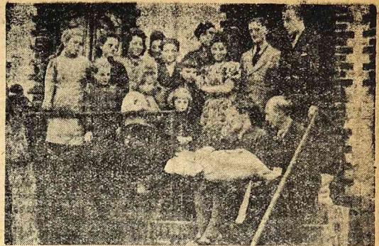
Prezydent R.P. ob. B. Bierut został ojcem chrzestnym 17 dziecka kaszubskiego małżeństwa Psemków. Na zdjęciu małżeństwo Psemka siedzą ze swą najmłodszą 4-miesięczną córeczką Wandzią — za nimi stoją pozostałe dzieci w liczbie 14 (2 nie żyją). Psemkowie objeli gospodarstwo rolne we wsi Górny Kielpin k. Gdańska, odbudowali budynki i całą rodziną pracując na roli. Mała Wandeczka została obdarowana paczkami żywnościowymi oraz książką oszczędnościową P.K.O. z początkowym wkładem zł. 2500

Ciężka, mozolna praca mierniczego zasługuje na należyty ocenę ze strony władz. To uznanie będzie najlepszą zachętą do wysiłku, aby w jak najkrótszym czasie ukończyć pomiary owych 575.000 ha — w interesie uregulowania tytułu własności użytkowników i osadników. (zgt).