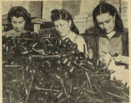
Jednym z najbardziej rozpowszechnionych przemysłów na Malcie jest wyrób fajek przeznaczonych na eksport

„Chcę wyjść za mąż. Jestem czarująca, przyjaciółki twierdzą, że jestem piękna. Włosy moje przypominają sfałowane morze. Mam taki kształt ciała, o jakim marzą mężczyźni. Uśmiech nie schodzi z mej twarzy. Kto pójdzie ze mną przez życie ręką w rękę, ten będzie zawsze szczęśliwy i zadowolony. Gdy znajdzie odpowiednią jęcego mi mężczyznę, wyjdę za niego za mąż. Będzie błogosławił ten dzień, w którym mnie poznał!”