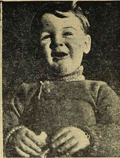
Ne martucie się dzieci, że śnieg stopniał tak szybko. Będziecie się dobrze bawić czytając i oglądając naszą gazetkę „Słowo Polskie — dzieciom”, która już od poniedziałku 15 bm. ukazując się będzie specjalnie dla Was—drodzy nasi najmłodsi Czytelnicy.