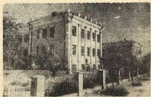
W jednym z najbardziej zniszczonych poza Warszawą miast Europy, w Stalingradzie, odbudowa postępuje szybko naprzód. Na zdjęciu nowe domy dziecka w Stalingradzie.