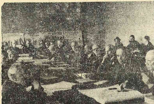
W Warszawie odbył się zjazd dziekanów wydziałów lekarskich uniwersyteów polskich. Na zdjęciu uczestnicy obrad.