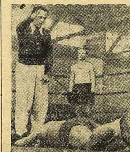
Komuda na deskach.

Wielu walczących w niedzielę się w hali przy ul. Mieszkańskiej ciekawym meczu bokserkim pomiędzy Wisłą Kraków i Patawagiem.