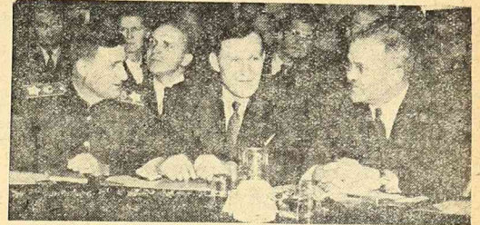
Marsz. Sokolowski, min. Smirnow i min. Molotov.