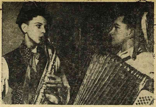
Z okazji ogólnopolskiego zjazdu dyrektorów i profesorów szkół i gimnazjów wrocławskich w sali Zw. Nauk. Polskiego w Warszawie, zespół młodzieżowy Gimnazjum w Jodłowej k. Jasta woj. Rzeszów, wystawia „Wesele Jodłowskie”.

NAUCZYCIELKI krawieczyny poszukiwane od 1 STYCZNIA 1948 r. do Państwowego Gimnazjum Krawieckiego w Leonicy