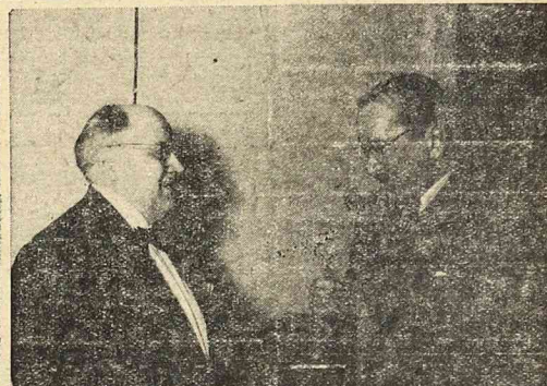
W sali „Roma” w Warszawie w okazji 65 rocznicy urodzin koncertował znany pianista polski Raul Koczalski. Cały dochód z koncertu mistrz przeznaczył na odbudowę Warszawy.

Również na Peloponezie wzmożyły się działania armii demokratycznej przeciwko oddziałom wojsk rządowych.