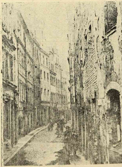
Zabytkowa ulica Psie Budy.