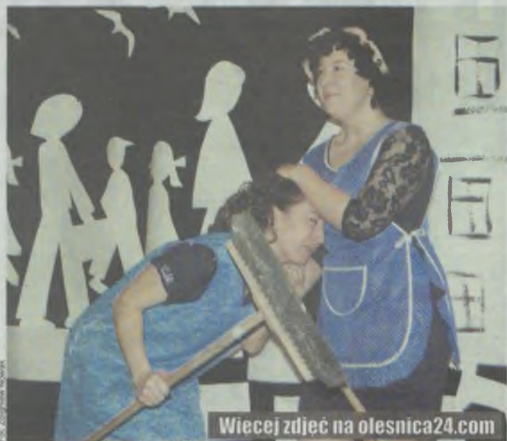
Miejscowi aktorzy w akcji

DZIADOWA KŁODA • Miejscowy kabaret sprawił, że saia pękała w szwach.