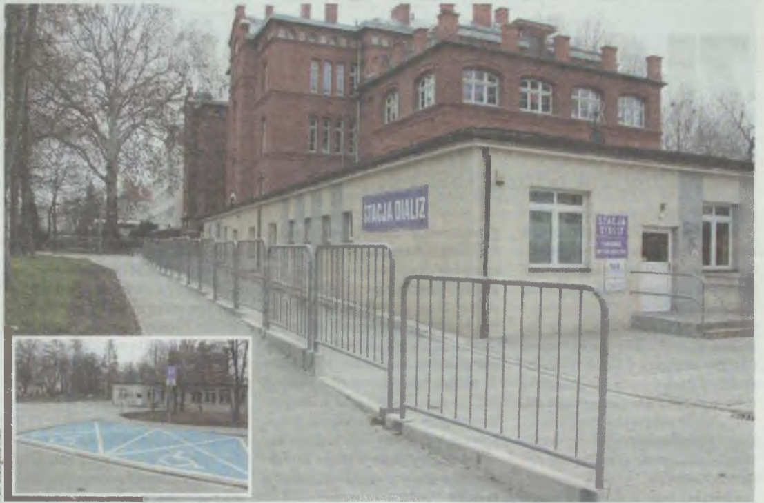
Otoczenie CUS-u zmienione nie do poznania...