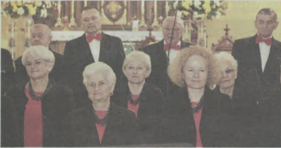
Łączy ich śpiew