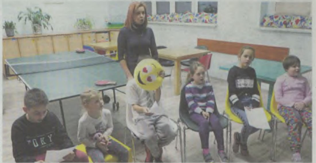
„Bratnia Dłoń” oferuje różnorodne zajęcia dla dzieci. Trwa nauka koleg

Członkowie Komisji Zdrowia i Opieki Społecznej Rady Miasta Oleśnicy przekonali się, jak dalece miasto wspiera rodziny dotknięte różnymi dysfunkcjami. Pomoc gminy dotyczy zarówno dzieci, młodzież, jak i dorosłych.