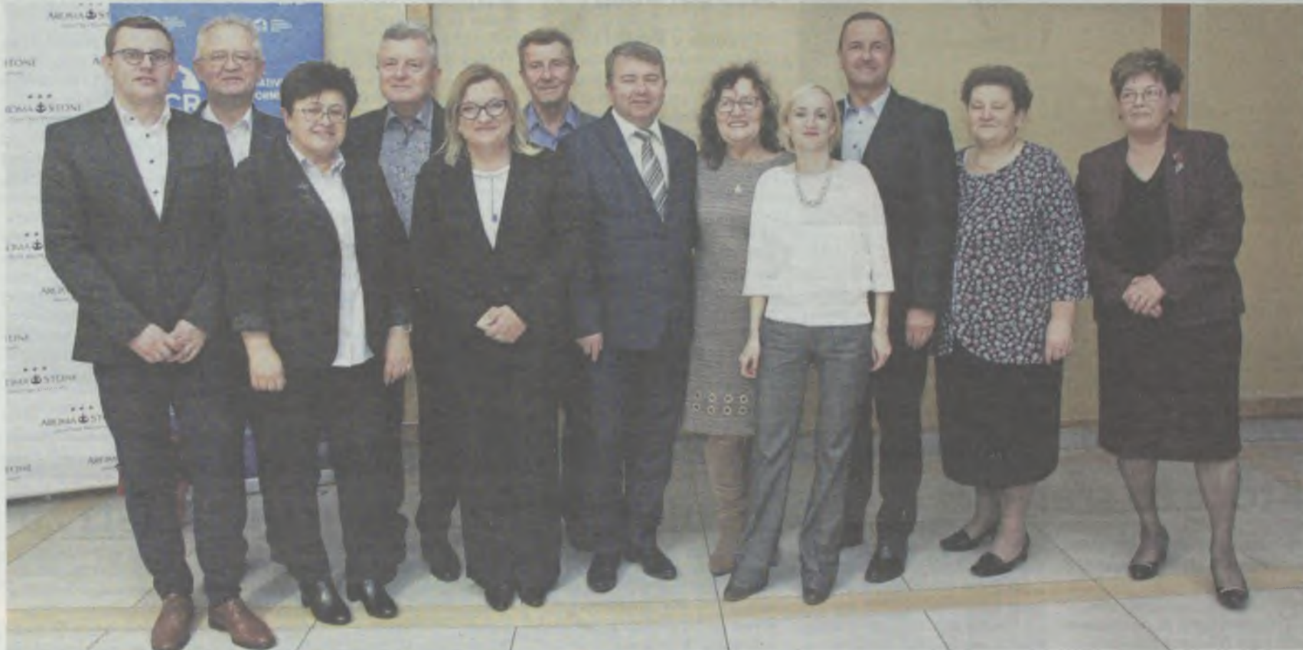
W powiecie oleśnickim eurodeputowana zawsze może liczyć na silne wsparcie

To była długa droga - od radnej gminnej do eurodeputowanej, która ma swoich ludzi i ośrodki poparcia w całej Polsce.