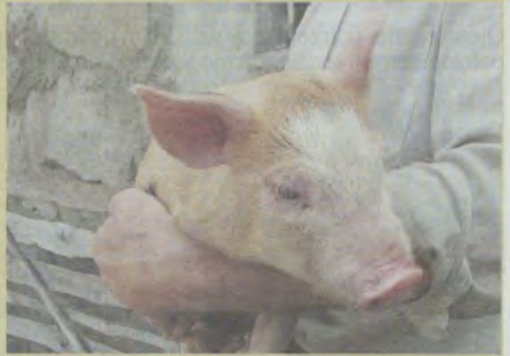
Świnki są w niebezpieczeństwie

Wirus choroby dostaje się do stada świń za przyczyną człowieka i jego działalności. Posiadacz świń ma obowiązek stosowania szeregu czynności i zabiegów,