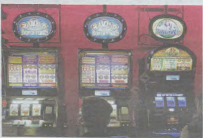
Niekontrolowany biznes automatowy się skończył

Zarzucono mu przestępstwa skarbowe. Wyrokiem z 24 maja 2019 roku Sąd Rejonowy w Oleśnicy uznał go za winnego popeł-