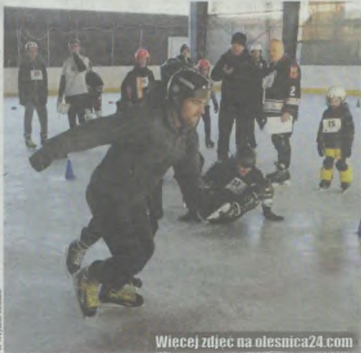
Wiecej zdjęć na olesnica24.com