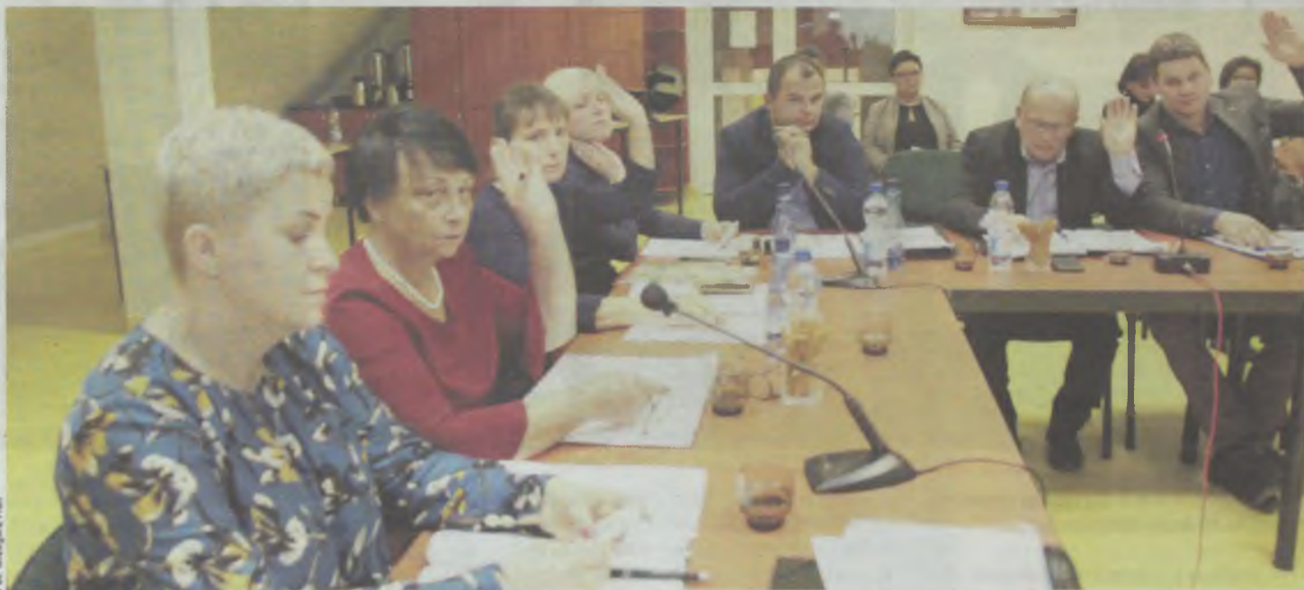
Radni podjęli decyzję obciążoną finansowym wyzwaniem

BIERUTÓW. Ryzykowna koncepcja w kontrze do niemieckiego monopolisty.