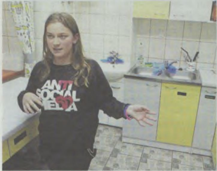
W „Mikserze” czują się jak u siebie i chętnie o nim opowiadają

Oleśniczanie potrzebujący wsparcia, dotknięci dysfunkcją społeczną, uzależnieniem, narażeni na skutki funkcjonowania w patologicznych rodzinach mogą liczyć na pomoc miejskich instytucji.