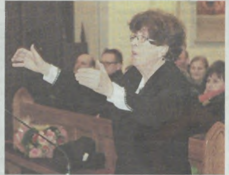
Dyryguje chórowi już 40 lat...