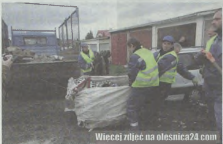
Więcej zdjęć na olesnica24.com