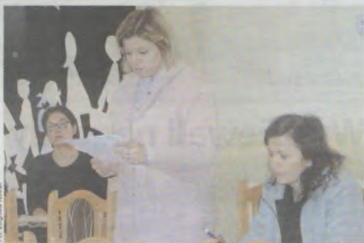
Świetlice interesują wszystkich

- To będzie bardzo dobre dla sołtysów, bo teraz udostępniali oni