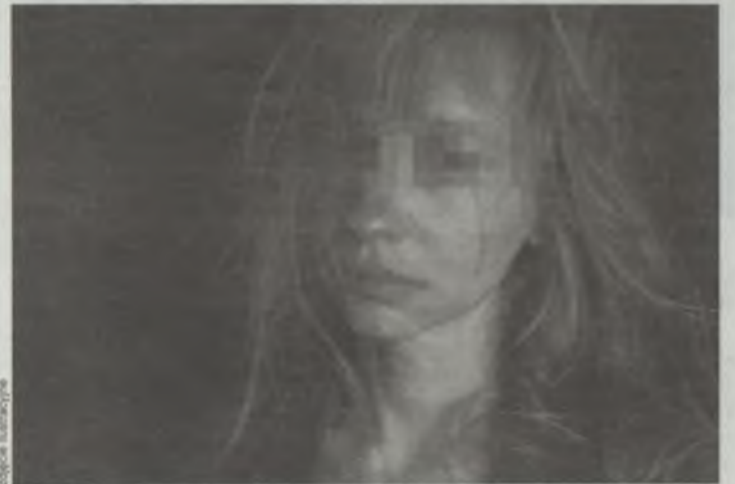
Trzy kobiety przeżyły dramatyczne chwile

Art. 197 § 1 Kodeksu karnego mówi, że kto przemocą doprowadza inną osobę do obcowania płciowego, podlega karze pozbawienia wolności od lat 2 do 12. Za usiłowanie sąd wymierza karę w granicach zagrożenia przewidzianego dla danego przestępstwa. Z kolei sprawcy doprowadzenia innej osoby do poddania się innej