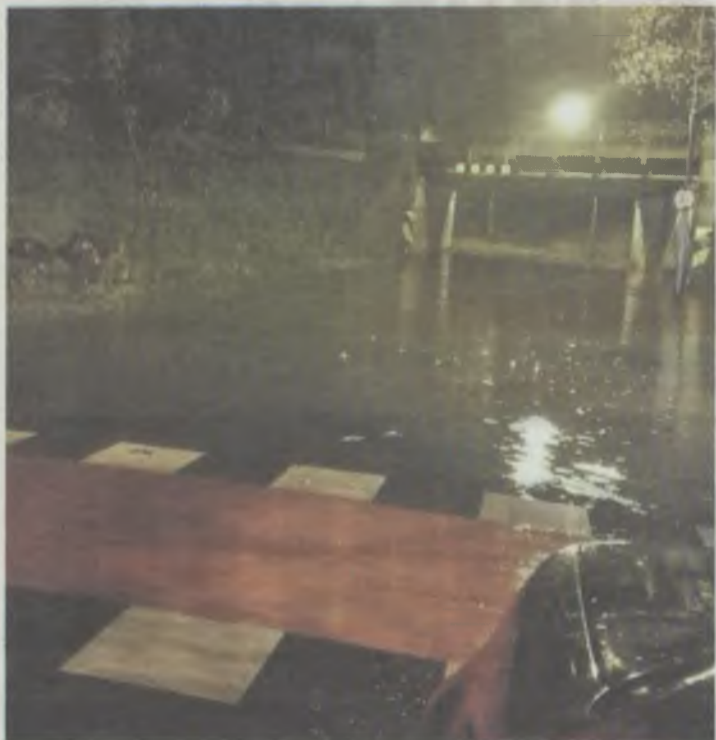
Tu kalosze nie wystarczą... Potrzebna łódka!