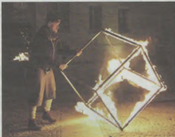
Bagienne Świetliki w akcji