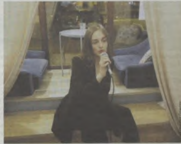
W kawiarni Pasja odbył się koncert

Night Walk Oleśnica - pod takim tytułem zapowiedziano animacje, wystawy i wydarzenia w piątkowy wieczór w Oleśnicy. Chłód i wiatr nie sprzyjał wyjściu z domu. Odczuły to animatorki Centrum Zabaw Aktywna Rozrywka Czar, które walczyły z wiatrem, rozkładając po godzinie 17 swoje maty pod ratuszem. Z układania klocków czy plastikowych patyczków nikt nie chciał korzystać. Znacznie większe zainteresowanie towarzyszyło warsztatom z sitodruku w MAK-u, gdzie wykonywano okolicznościowy nadruk