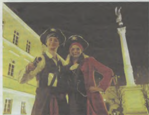
Skąd tu się wzięli piraci?...