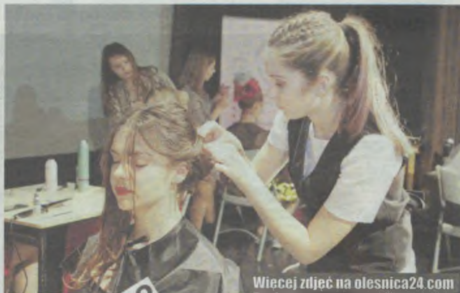
Jak wyczarować oryginalny fryz?