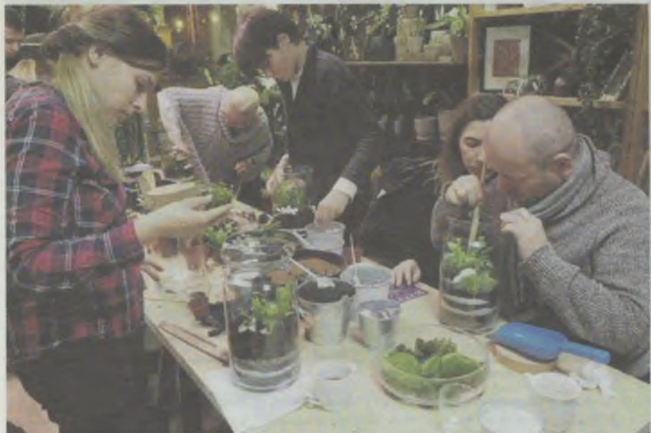
Chcą mieć swój las w domu

Finałem piątkowej akcji animatorów były pokaz ognia i salsa pod ratuszem.