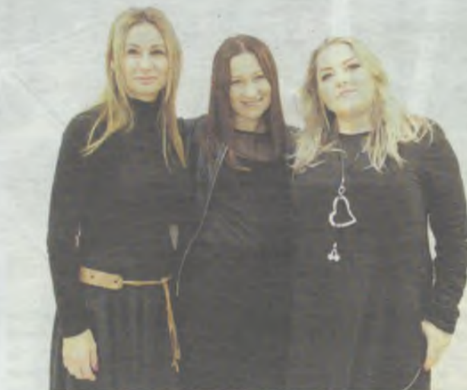
Udana impreza to ich sukces