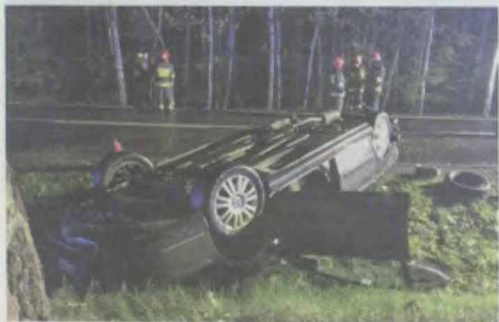
To był rodzinny dramat...