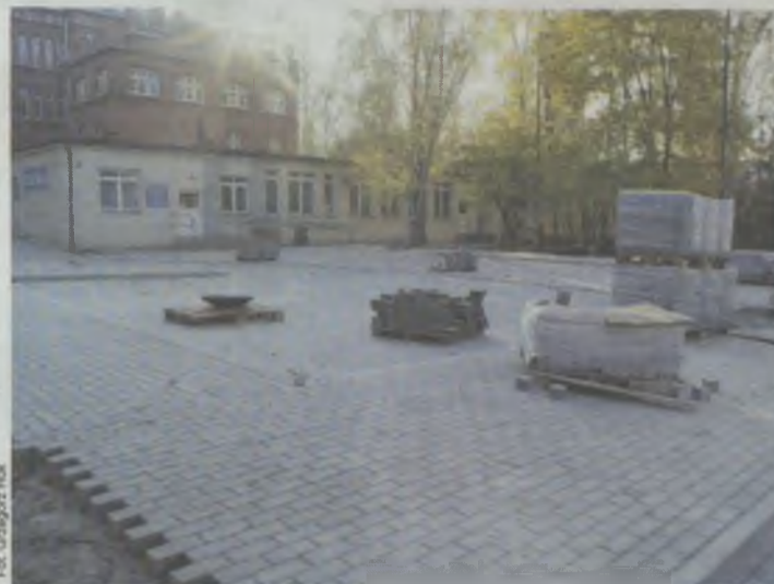
Od razu inaczej...

Brak miejsc parkingowych, zniszczone nawierzchnie miejsc postojowych i duży bałagan w otoczeniu od lat były bolączką oleśnickiego szpitala. Ten stan powoli się zmienia, co widać po zaawansowaniu prac budowlanych od strony południowo-zachodniej należącej do szpitala działki. Już teraz teren między Centrum Usług Społecznych, Stacją Dializ a Zakładem Pogrzebowym Chaber wygląda zupełnie inaczej. Jak dowiedzieliśmy się w Starostwie Powiatowym, prowadzone prace związane są z budową drogi wewnętrznej wraz z miejscami parkingowymi na terenie Powiatowego Zespołu Szpitali w Oleśnicy - etap 1. Jest to zadanie, którego wartość wynosi blisko 774.500 zł. Wykonawcą jest firma TomTrans z Oleśnicy. Termin zakończenia prac zaplanowany jest na koniec listopada. W ramach inwestycji wykonane zostanie blisko 170 m dróg wewnętrznych wraz z systemem