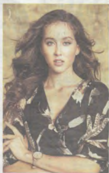
Czy wróci w koronie?...