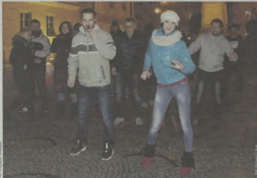
Krok w lewo, krok w prawo...