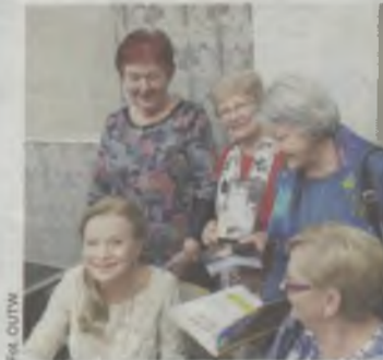
Oblegana przez fanki

W sali audiowizualnej Oleśnickiej Biblioteki Publicznej wystąpiła z montażem wierszy i piosenek głównie z okresu XX-lecia międzywojennego, ale także z piosenkami współczesnymi. Wśród tekstów poetyckich były utwory Tuwima, Staffa, Gałczyńskiego, Leśmiana.