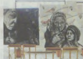
Fragment wystawy plastycznej

Celem Konferencji była wymiana dobrych praktyk i doświadczeń oraz integracja organizacji pozarządowych, instytucji kultury, szkół, środowisk biznesowych.