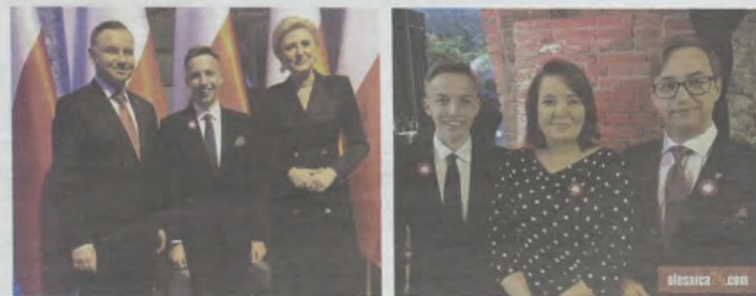
„Mała Garstka” zaprowadziła ich do Pałacu Prezydenckiego