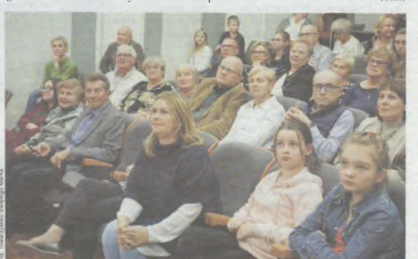
Publiczność miała sporo wrażeń