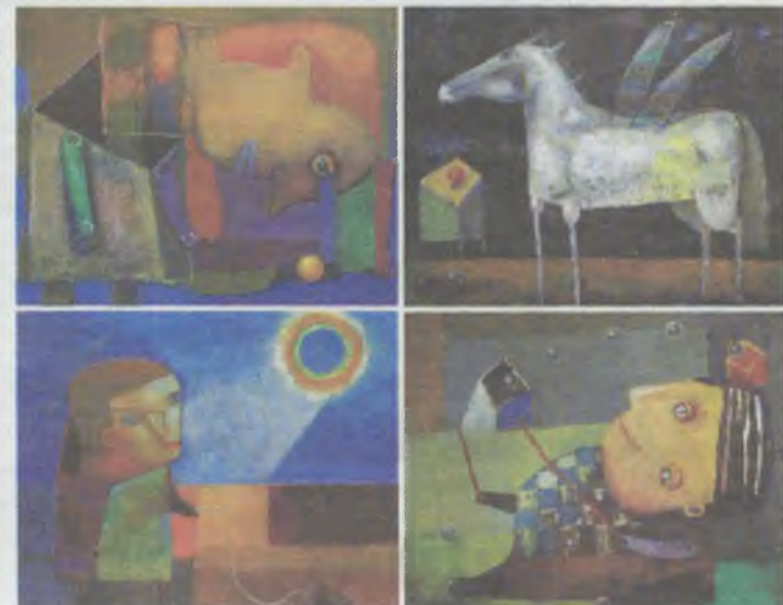
Obrazy Kuby Chomickiego