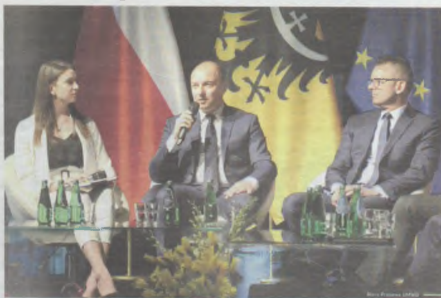
VII Dolnośląski Kongres Samorządowy odbędzie się 20 listopada 2019r. na Stadionie Wrocław przy Al. Śląskiej 1.

- Jedną z najbardziej udanych reform przeprowadzonych po 1989 roku była, moim zdaniem, reforma samorządowa. Jako przykład podam naturalnie Dolny Śląsk, który obecnie znajduje się w czołówce najlepiej rozwijających się regionów w Europie. Ten sukces zawdzięczamy m.in. dobrej współpracy samorządów różnych