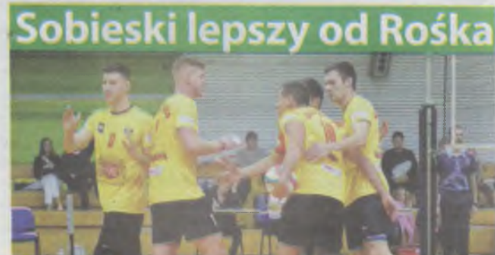
W sobotę w Sycowie w ramach VII kolejki II ligi siatkówki mężczyzn miejscowy Rosiek podejmował WKS Sobieski Arena Żagań. Pomimo zaangażowania gospodarzy, przeciwnik okazał się silniejszy i wygrał 3:0. 23 listopada o 18 Rosiek podejmie MKS Ikar Legnica. (ws)