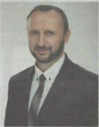
Sekretarz gminy Syców

Ma on 45 lat, urodził się w 1974 r. w Sycowie, a pochodzi z Międzyborza. Jest żonaty, ma dwoje dzieci. Obecnie mieszka w gminie Doruchów (powiat ostrzeszowski). Jest absolwentem Technikum Mechanicznego w Sycowie z 1994 roku. Na Akademii Ekonomicznej w Poznaniu ukończył studia licencjackie na kierunku zarządzanie i marketing, a potem magisterskie na Wydziale Zarządzania (specjalizacja finanse i rachunkowość przedsiębiorstw). Jest absolwentem studiów podyplomowych z zakresu samorządu terytorialnego i gospodarki lokalnej na Wydziale Prawa, Administracji i Ekonomii Uniwersytetu Wrocławskiego. Od 20 lat pracuje w samorządzie gminnym. Ostatnie 17 lat spędził na stanowisku sekretarza gminy Doruchów. Wcześniej