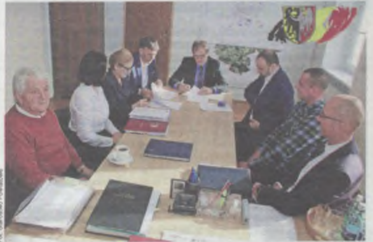
Jest zielone światło dla inwestycji

Wykonawca zrealizuje zadanie za 1.458.031,61 zł. Berger Bau była jedną z czterech firm, które odpo-