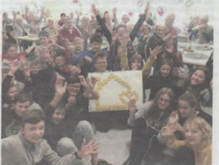
Młodzieńczej werwy nic nie zastąpi...