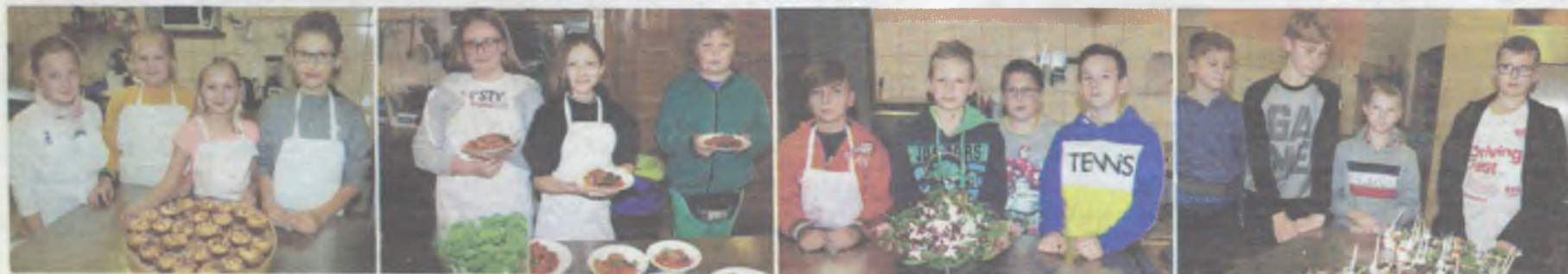
Mistrzowie kuchni z Siódemki zapraszają na mały poczęstunek