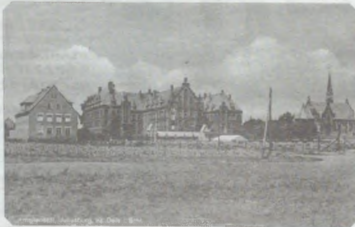
Amalienstift górował nad Dobroszycami

stacja PKP, pięknie obrosnięta bluszczem.