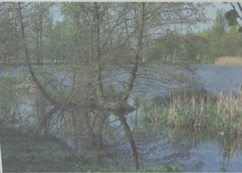
Gdyby roboty ziemne podjęto, ten malowniczy zakątek by zniknął...