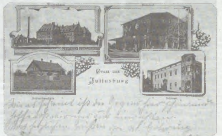
Pozdrowienie z Dobroszyc

W dawnym renesansowym zamku (wzniesionym w latach 1589-1601), przebudowanym w latach 1675 - 1676 przez księcia Juliusza Zygmunta na barokową reprezentacyjną rezydencję, po raz kolejny przebudowanym w 1853 roku, mieściła się bowiem szkoła. Zamek po przebudowie z XIX wieku został pozbawiony barokowej ściany szczytowej oraz oto-