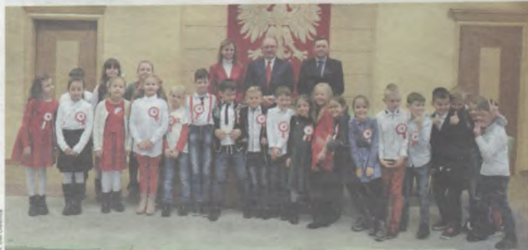
Będzie pamiątka z niecodziennej wizyty