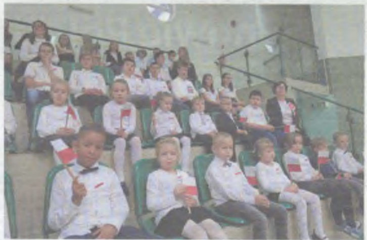
Biało-czerwone - to znaczy, że myślimy o naszej ojczyźnie

To była najlepsza lekcja historii i patriotyzmu. (OAI)