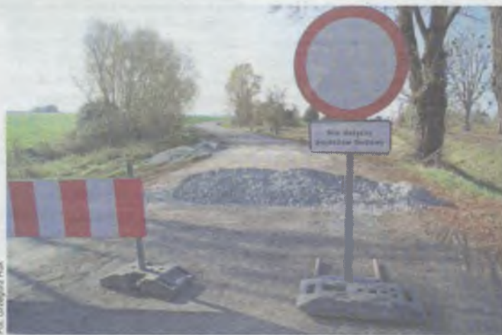
Będą okresowe utrudnienia

Wykonawcą robót jest wrocławska firma Strabag Infrastruktura