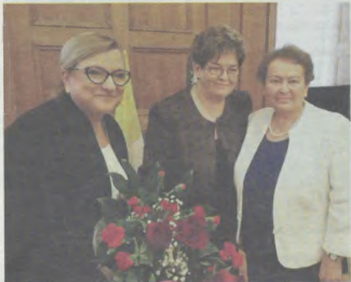
Pamiątkowa fotografia musi być...

Elementem obchodów jubileuszu była konferencja o roli Kościoła w odzyskaniu niepodległości przez Polskę i powstaniu Unii Europejskiej.