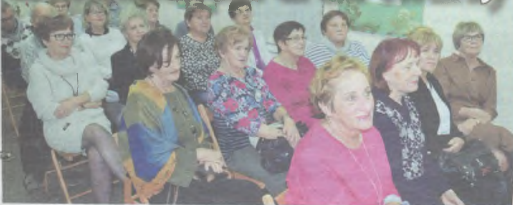
W poszukiwaniu pozytywnego nastawienia...

TWARDOGÓRA • Spotkanie z trenerem psychologii pozytywnej wprawi Cię w dobry humor!