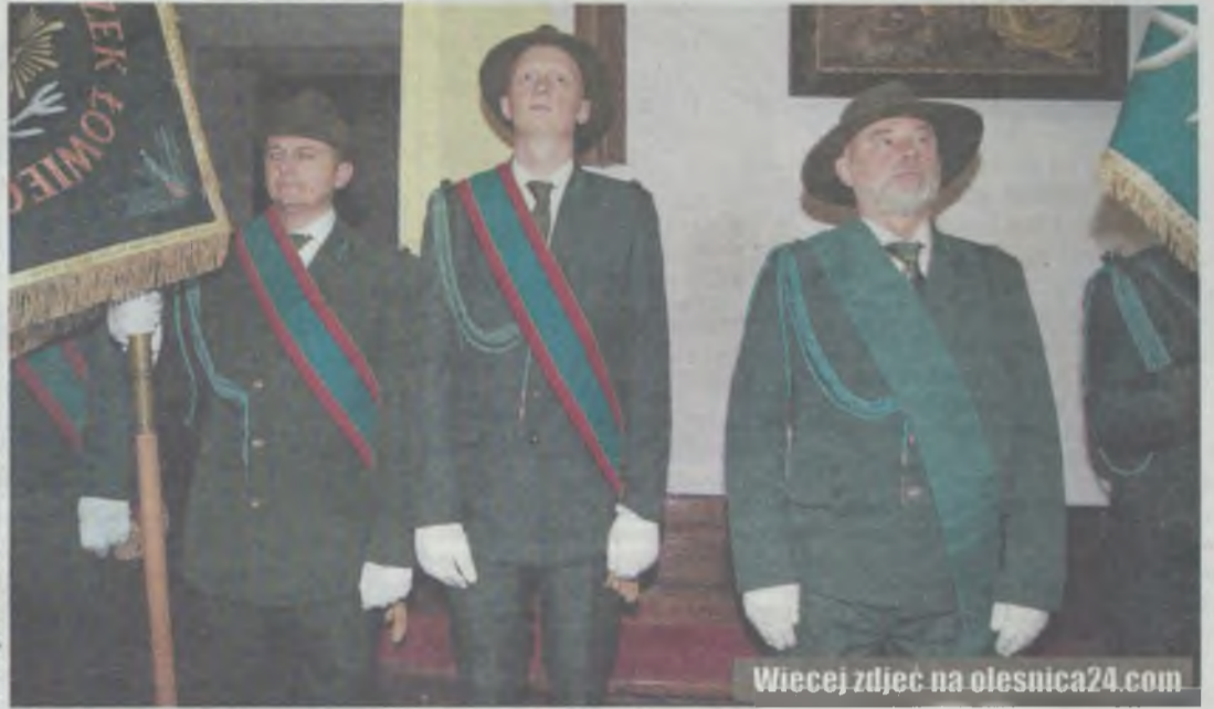
Stawiły się poczty sztandarowe myśliwych

- To już jedenasta msza święta w dzień Świętego Huberta organizowana w naszej świątyni - przypomniał jej gospodarz, witając poczty sztandarowe kół łowieckich z Oleśnicy, Sycowa, Goszcza i Twardogóry. Były reprezentacje oleśnickich kół Knieja, Sokół, Jeleń (koło wojskowe) i Święty Hubert oraz Jeleń z Sycowa, Ryś z Budzyc, Cyraneczka z