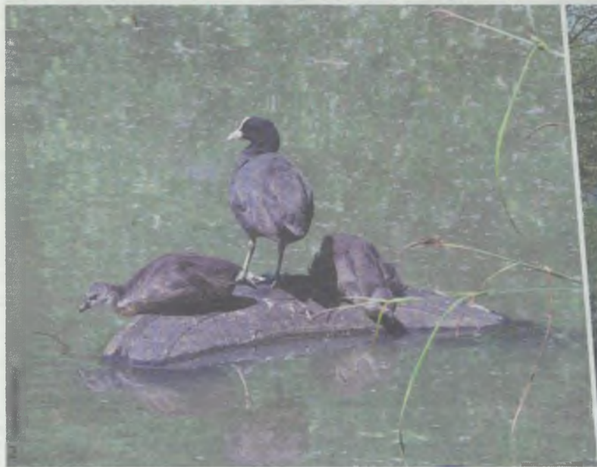
Stara opona jest ich ulubionym miejscem...