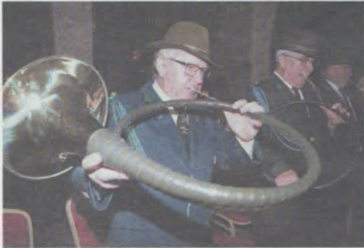
Obecność sygnalistów w kościele to niecodzienna sprawa

W kościele Najświętszej Maryi Panny Matki Miłosierdzia w Oleśnicy odprawiono uroczyste nabożeństwo dla ludzi lasu.