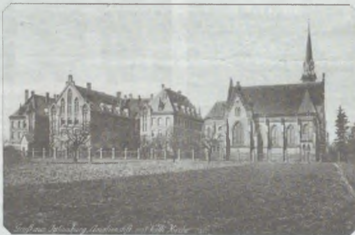
Bracia szkolni uprawiali tu pole