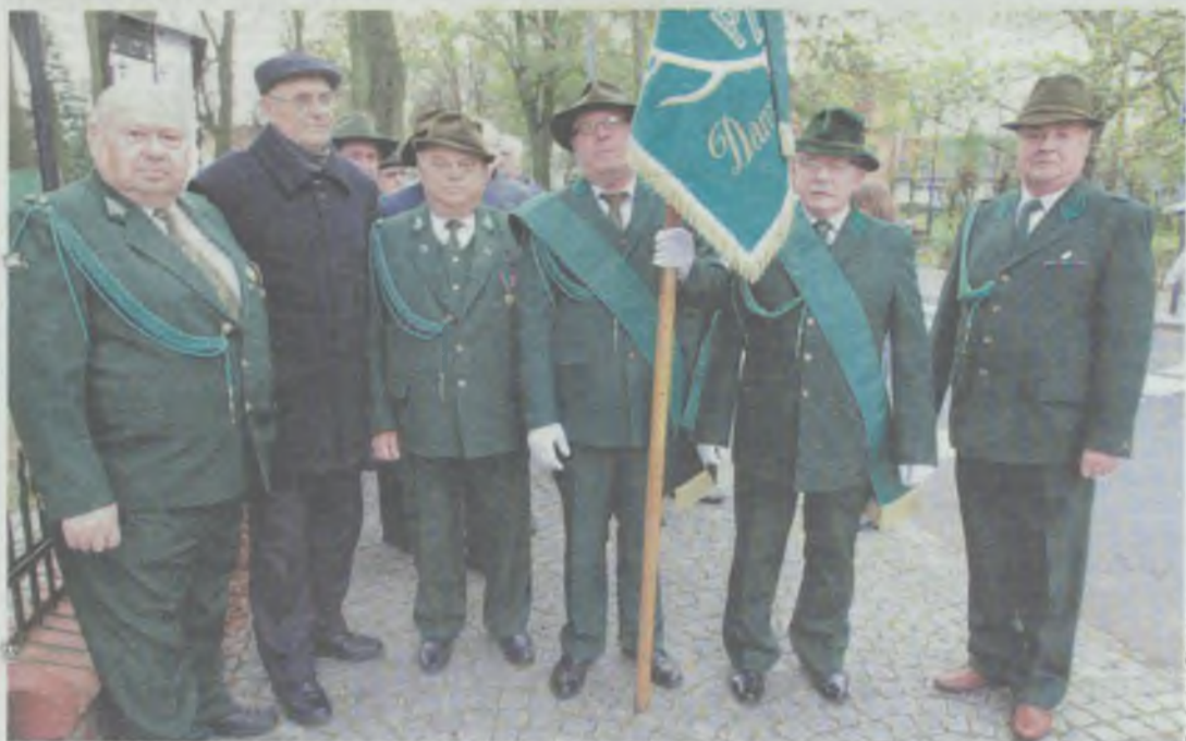
Łączy ich łowiecka pasja

TWARDOGÓRA • Miejsce Koła Łowieckiego obchodziło święto myśliwych.