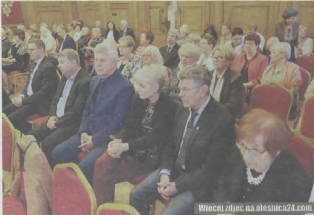
Sala wypełniła się słuchaczami

Chwilą ciszy uczczono zmarłych członków organizacji, wśród nich