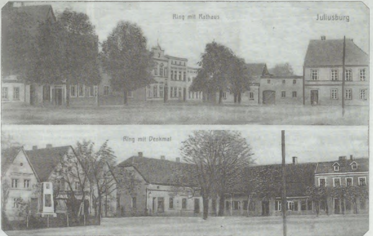
Zabudowa Rynku - sprawdźcie, co się zachowało