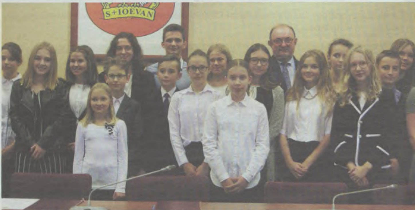
Młodzieżowa Rada Miasta Oleśnicy inauguruje działalność

Grupa wybranych do MRM uczniów oleśnickich szkół zainaugurowała swoją samorządową przygodę.