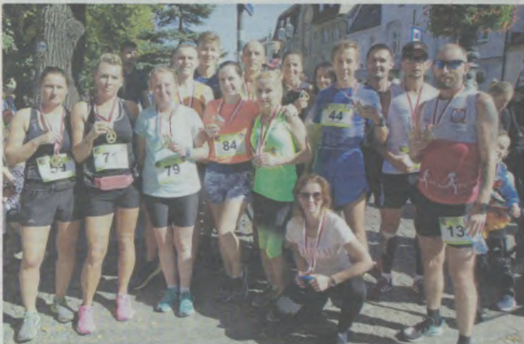
A to najszybsi twardogórzanie...