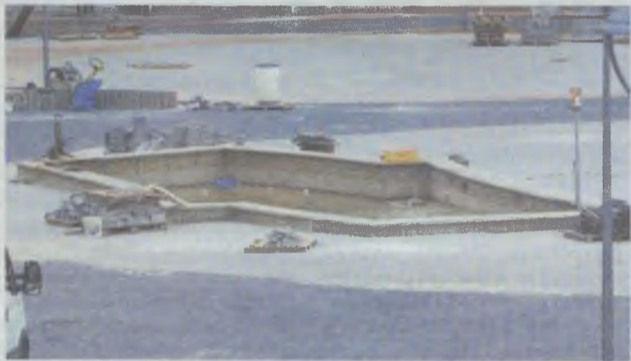
Wydaje się dziś siermiężna... Miał tu stać pomnik