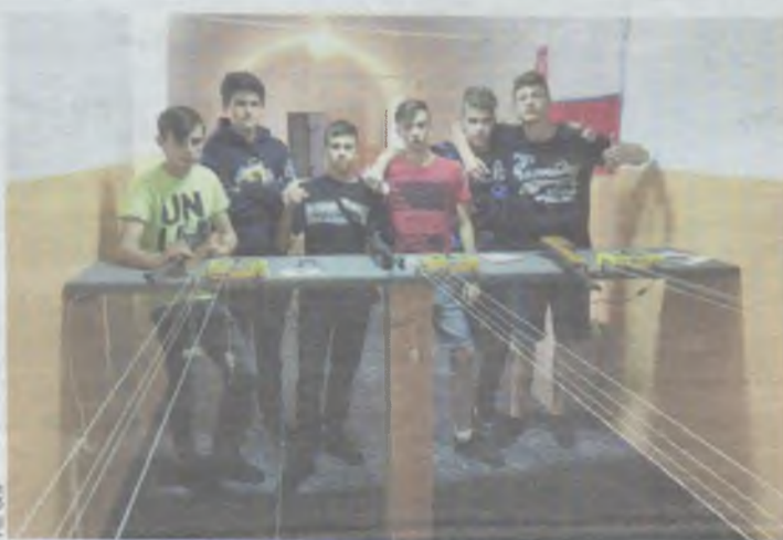
Zajęcia są fajne, nie ma co...

Te niekonwencjonalne zajęcia są magnesem dla wielu chłopców.