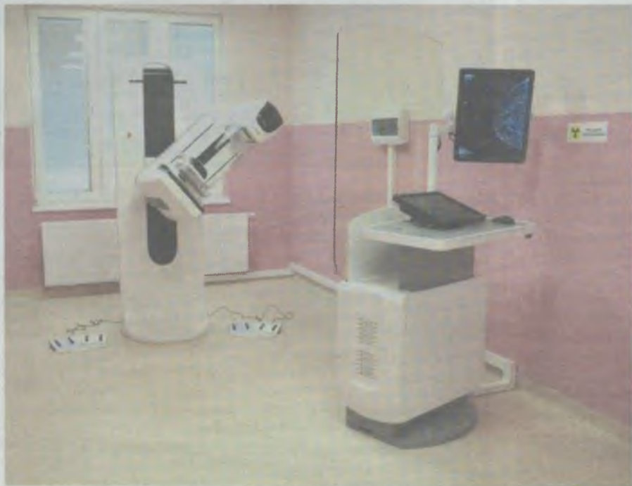
- Dla szpitala, który jest jednostką podległą samorządowi województwa, niezwykle ważne jest doposażenie oddziałów w najlepszy sprzęt - mówi marszałek Cezary Przybylski.

DCO jest jednym z 20 ośrodków w Polsce, które pozyskało dofinansowanie z Ministerstwa Zdrowia. Na liście sprzętu dla szpitali są też mammografy, aparaty HDR do brachyterapii oraz stacje planowania leczenia.