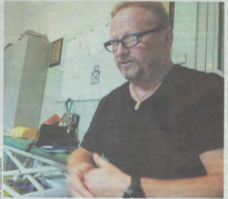
„Fundacja Rehabilitacji”aczy Mieszala...

Podstawowy problem Fundacji to zbyt małe środki przyznawane przez NFZ w ramach kontraktu na usługi rehabilitacyjne. Na Dolnym Śląsku działają 163 podobne placówki. W pewnych zakresach działalności oleśnicka jednostka otrzymuje najwyższe kwoty z NFZ, co pokazuje jej pozycję na