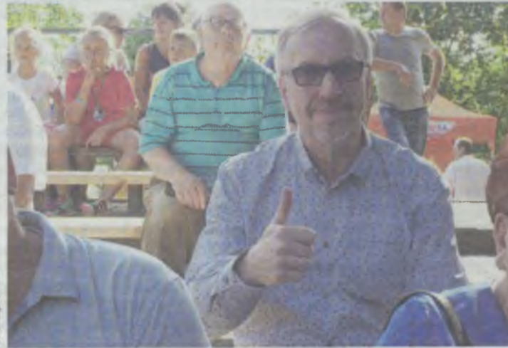
Bogdan Zdrojewski na dożynkach w Dobroszycach

Niewielkie różnice pomiędzy przewidywaniami obu panów są, ale co do rzeczy najważniejszych zgadzają się. Czyli - PiS i KO idą