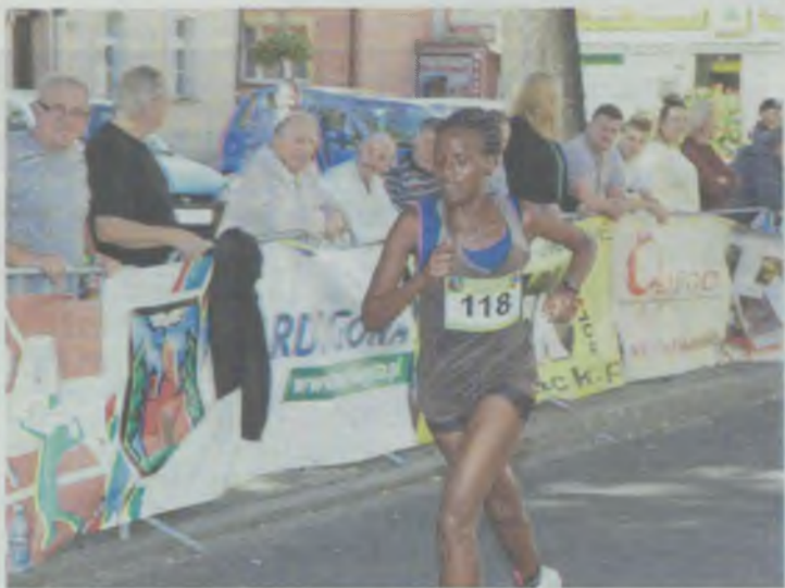
Kenijki i Kenijczycy zgarnęli pełną pulę

Reprezentanci Afryki wygrali biegi i panów, i pań.