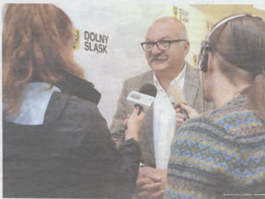
- Cieszę się, że nasza inicjatywa rośnie w siłę i zyskuje na popularności wśród mieszkańców Dolnego Śląska - mówi marszałek Cezary Przybylski.

W subregionie wrocławskim z budżetu Aktywnego Dolnego Śląska zrealizowanych zostanie 14 projektów. Wśród wybranych zadań znalazły się m.in. Dolnośląskie Święto Rodzin w Gniechowicach, warsztaty artystyczne w Małkowicach i cykl zajęć