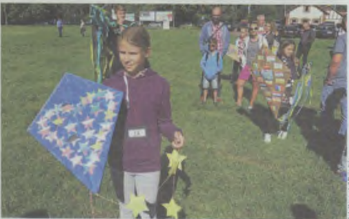
Europejski motyw obowiązkowo