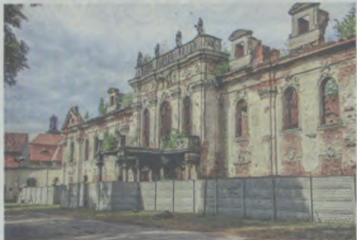
Dzisiaj jest powodem do wstydu

GMINA TWARDOGÓRA • Miłośnicy Goszcza i jego historii postanowili zaapelować do samorządowych decydentów.