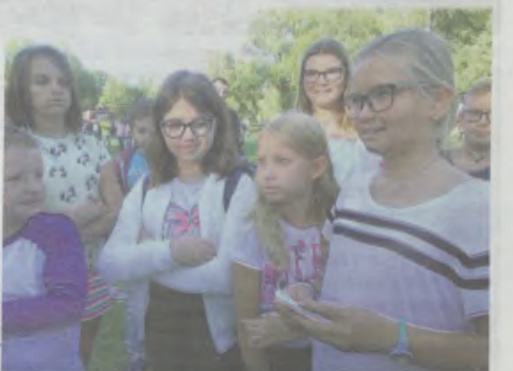
Młodzi mieli wiele atrakcji

„Nieprzytomnego” ohotnika naprawdę wyciągano z wraku, w którym pojawiły się już płomienie, a po chwili dało się słyszeć głośne wybuchy różnych elementów pękających w ogniu. Na szczęście strażacy szybko opanowali ogień, a ratownicy pokazali, jak udzielać pierwszej pomocy. Z kolei gdy pod wieczór już się ściemniło, park rozświetliły światłem rozdawanym uczestnikom zimnych ognii. Przy tak bogatym programie nic dziwnego, że na imprezę przybyły tłumy. Organizatorzy oraz różne instytucje i stowarzyszenia zaangażowane w przygotowanie wydarzenia (m.in. Stowarzyszenie Integracji Społecznej Celina oraz Między-