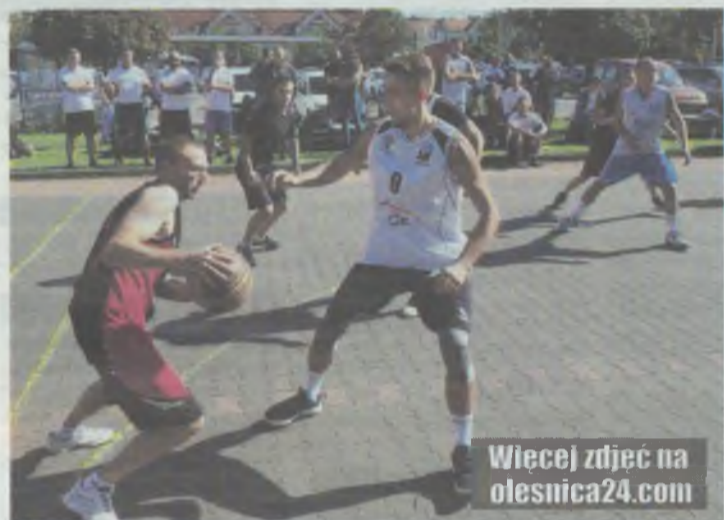
Walczyło 12 drużyn