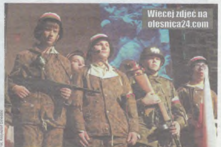
Więcej zdjęć na olesnica24.com

Przedstawienie wyreżyserowali Jadwiga Wołkowska i Jarosław Kem-