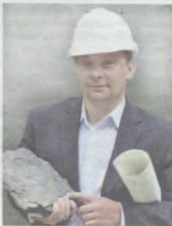
O tym, co kryje Ziemia, wie wszystko