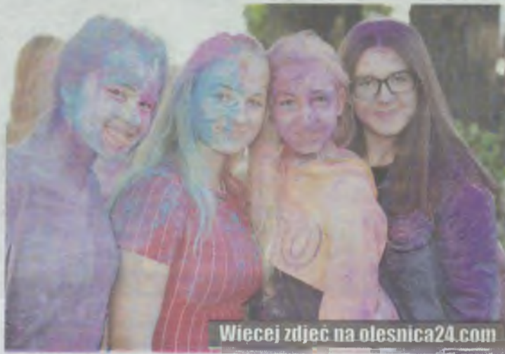
Wiecej zdjęć na olesnica24.com

Na ekopikniku wystąpili uczniowie ze SP w Grabownie Wielkim w programie pt. „Cztery Żywioły”, były różne atrakcje, jak energorower czyli wyciskarka soków, zagniatarka butelek i tor samochodowy zasilany siłą mięśni, tworzenie „lasu w słoiku”, promocja technologii odnawialnych źródeł energii. Były warsztaty pszczelarskie, konsultacje medyczne, stoisko ZGK oraz wystawcy z ekoproduktami. Na scenie zaprezentowały się wszystkie placówki oświatowe z gminy w pokazie mody ekologicznej. Za zbiórkę odpadów szkoły otrzymały finansowe nagrody.