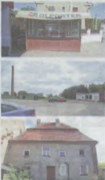
Te nieruchomości są do kupienia

Na chętnego w Dobroszycach czeka też niewielka kamienica, o powierzchni 200 mkw. Są tu trzy mieszkania (obecnie wynajmowane) i lokal usługowy na parterze. Działka ma powierzchnię ok. 1000 mkw. Na działce znajduje się pomieszczenie gospodarcze, a do wykorzystania jest też pomieszczenie strychowe. Cena? 279.000 zł.