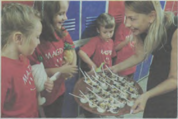
Deserek mniam mniam...