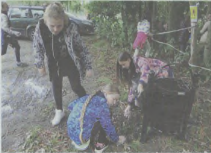
Ale ci ludzie śmieją...