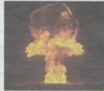
Świat idzie w niebezpiecznym kierunku

Jak to się zacznie według symulacji? Rosja wystrzeli ostrzegawczą