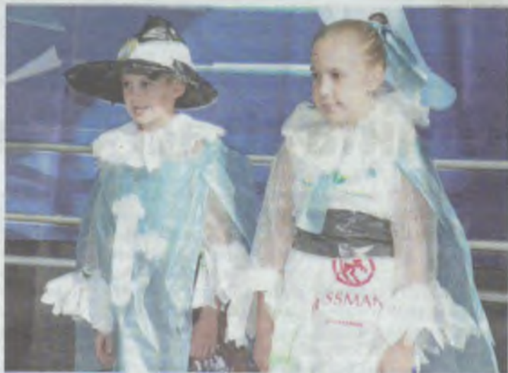
Stroje ekokreatorów mody z Twardogóry