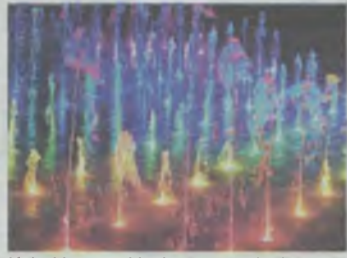
Kolorki wszystkim by przypadły do gustu

No właśnie - może to jest dobre rozwiązanie? (ror)