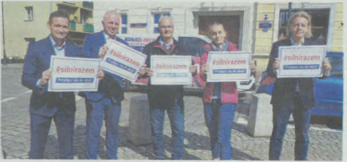
Koalicjanci ruszyli z nową akcją. Czy będzie skuteczna?