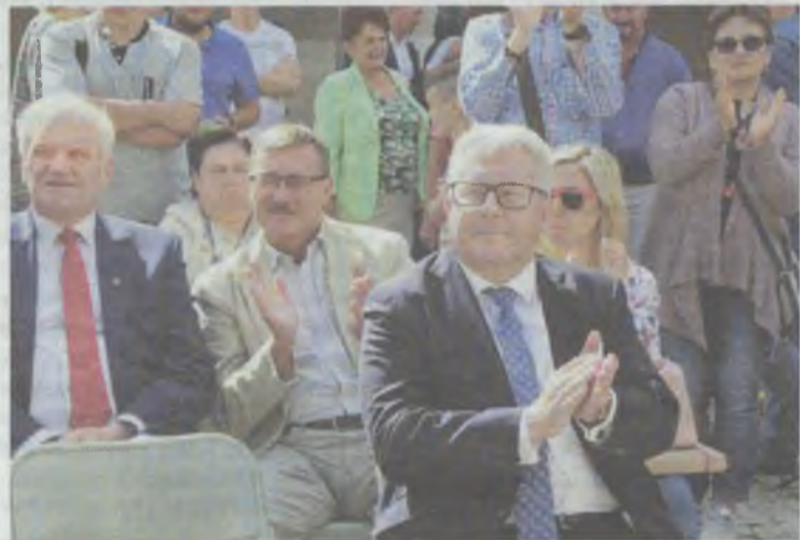
Ryszard Czarnecki na Jarmarku Produktu Lokalnego