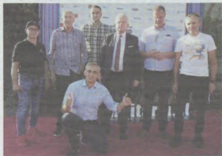
Gwiazdy sportu na Edwin Cup