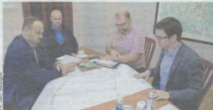
Pieniądze już są zagwarantowane

Przetarg wygrała firma Berger Bau Polska. Prace mają zostać wykonane w ciągu 45 dni od podpisania umowy, tj. do 28 października. Ich koszt to 498.096 zł. (OAI)