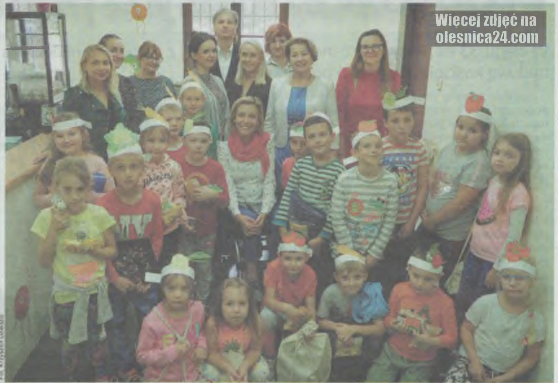
Więcej zdjęć na olesnica24.com