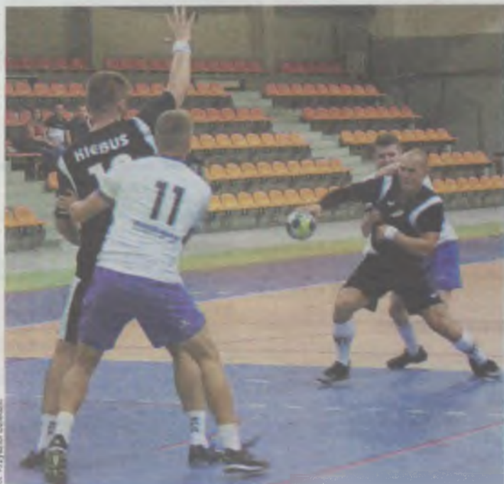
SPR na razie pozostaje bez wygranej

Przekonują się o tym szczypiorniści SPR Oleśnica.