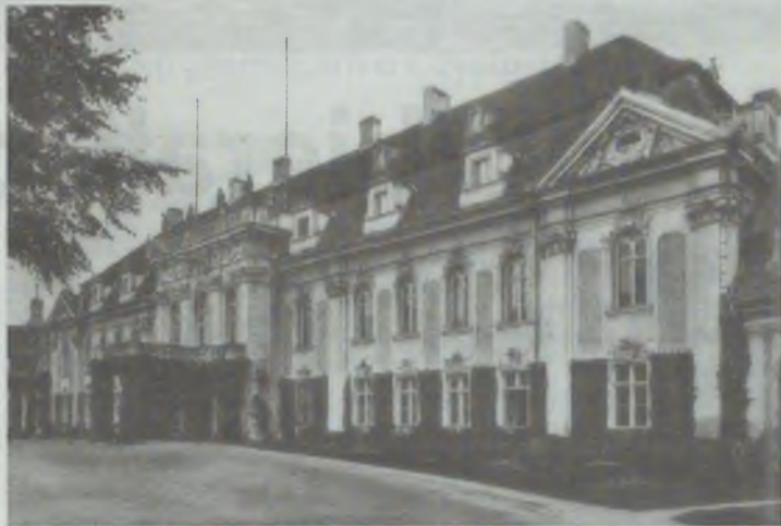
A mógłby wyglądać tak jak dawniej...

turyści będą mogli zdobyć chociaż podstawowe informacje w wspomnianym obiekcie;