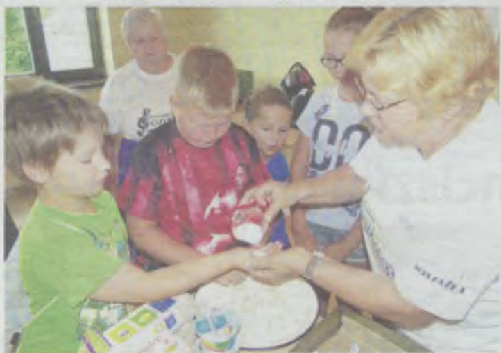
Czym skorupka za młodu nasiąknie...