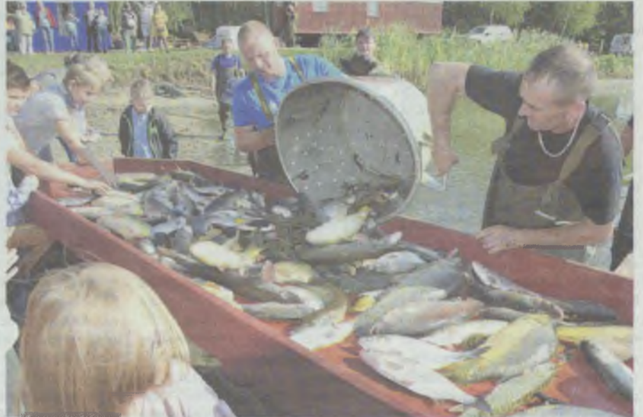
Dolina Baryczy słynie z karpia, który jest tu hodowany od ponad 800 lat.

10 tygodni, ponad 80 wydarzeń, rybne przysmaki oraz piękne rękodzieła, a do tego zawody wędkarskie, liczne atrakcje sportowe i imprezy muzyczne - tak w skrócie można opisać to, co przez najbliższe tygodnie będzie działo się w Dolinie Baryczy. Od początku września trwają tam 14. Dni Karpia!