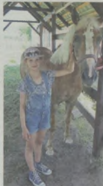
(OAI) W Ligocie Polskiej kochają zwierzęta

Dzięki pomocy uczniów z całej Polski udało się Klubowi Gaja uratować przeszło sześćdziesiąt koni, które kiedyś służyły ludziom, były wybitne sportowo, a gdy stały się niechciane, w potwornych warunkach jechały po swoją śmierć. Uratowane konie zostały wyleczone i trafiły do wielu szkół, fundacji i stowarzyszeń, w których pomagają chorym ludziom, pracując jako terapeuci.