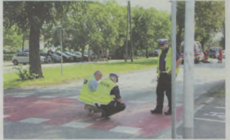
Jak doszło do tragedii?

Z kolei na Krzywoustego, w trakcie oględzin miejsca wypadku, policjanci komentowali, że poprowadzenie fragmentu ścieżki w poprzek niezwykle ruchliwej ulicy to rozwiązanie niefortunne i obarczo-