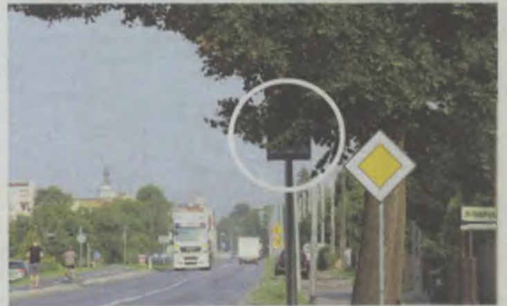
Znaku nie widać...

ne dużym ryzykiem, tym bardziej że mało kto z kierowców przestrzega tu przepisowej prędkości.