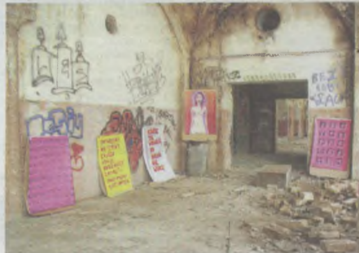
Wystawa w imię wolności

Wystawa zwraca uwagę na jeden z podstawowych problemów współczesnej cywilizacji - braku wolności, ograniczania tej wartości, czy istnienie pozorowanej wolności. Mówią o tym napisy umieszczone na obrazach, m.in.: Gdzie ta wolność, bo k... nie widzę, Na terenie całego kraju obowiązuje całkowity zakaz myślenia, Lepsza śmierć niż taka wolność, Nadmiar wolności nie powoduje sraczki, Nie bądź jak pies Pawłowa, Tylko cham jest szczerzy, Tylko gówno jest prawdziwe, W Auschwitz też obowiązywało prawo. Dzieła umieszczone na wystawie można uznać za przekonującą