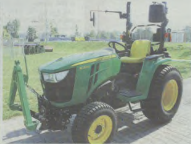
Takim sprzętem przyjemnie jest robić porządki

32 miliony z GKN powodują, że miasto mogło wspomóc Atol w wielu sprzętowych zakupach.