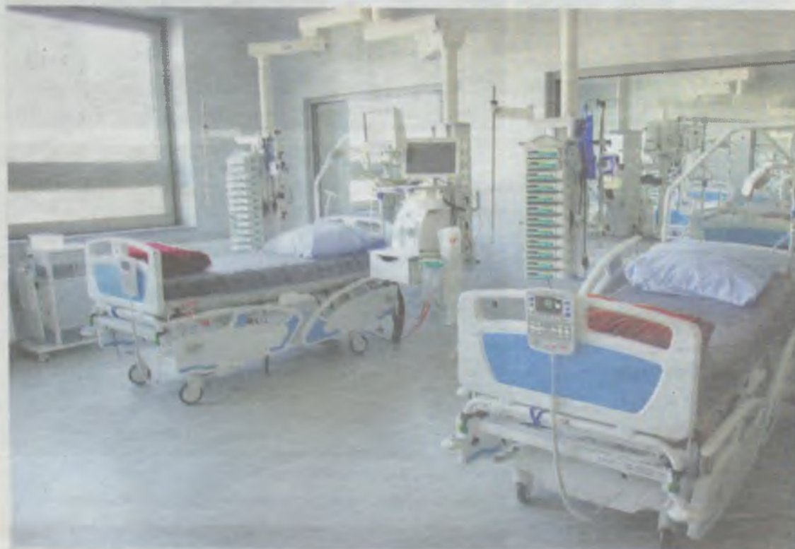
Wojewódzki Szpital Specjalistyczny jest piątą na Dolnym Śląsku placówką, która zagwarantuje chorym na wrodzone pęcherzowe oddzielenie się naskórka pełne leczenie i opiekę medyczną.

Wrodzone pęcherzowe oddzielenie się naskórka to rzadko występujące, ale niezwykle uciążliwe schorzenie. Do placówek świadczących pomoc cierpiącym na nie mieszkańcom regionu dołączył właśnie Wojewódzki Szpital Specjalistyczny przy ul. Kamieńskiego we Wrocławiu. Podległa samorządowi województwa placówka jest piątą na Dolnym Śląsku, która zagwarantuje chorym pełne leczenie i opiekę medyczną.