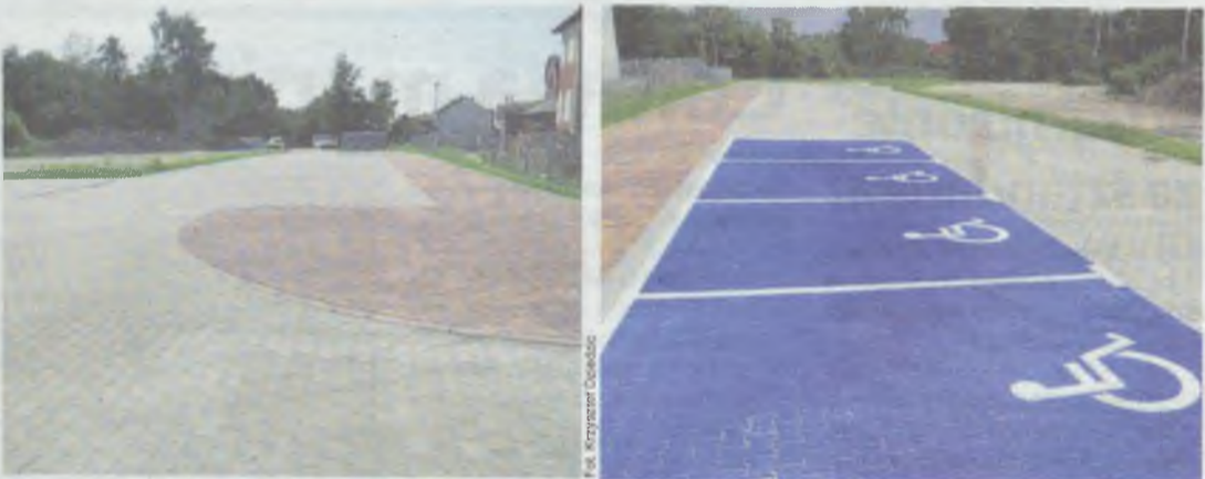
Parkowanie w pobliżu ośrodka zdrowia i kościoła nie stanowi już problemu

Pierwszy etap inwestycji został zakończony. Parking na pi. Fatimskim jest gotowy.