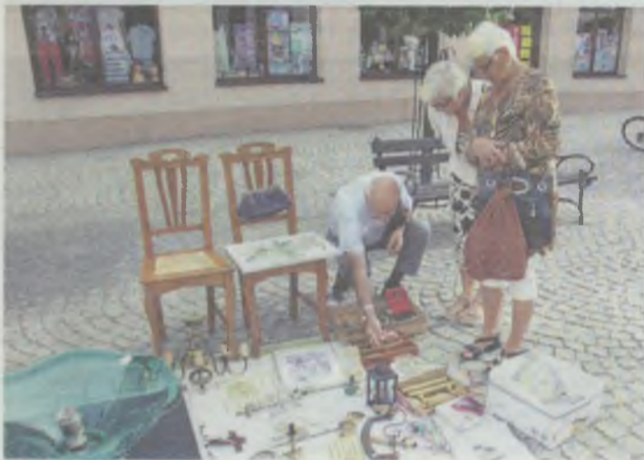
Ruch coraz mniejszy...