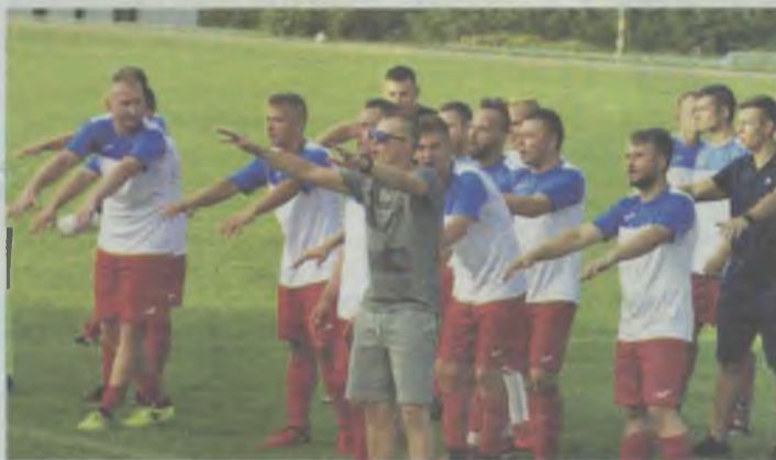
Radość kibiców, radość piłkarzy Lotnika