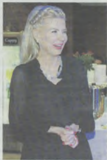
Satysfakcja po 6 latach procesu

Wskazuje, że sędziowie w ustnym uzasadnieniu wyroku „podkreślili naganne postępowanie zarządu spółki, które spowodowało znaczne odstąpienie od projektu, bardzo złe wykonanie budowy oraz wiele błędów popełnionych podczas budowy obiektu”, a także „nie ukrywali oburzenia co do zaistniałej sytuacji i zachowania zarządu spółki, który doprowadził