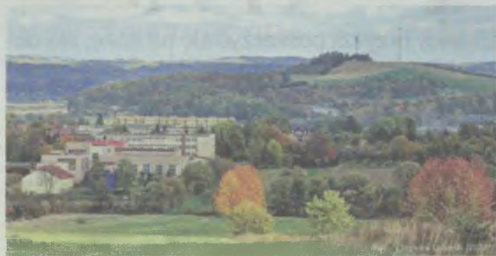
Widok na Dynów