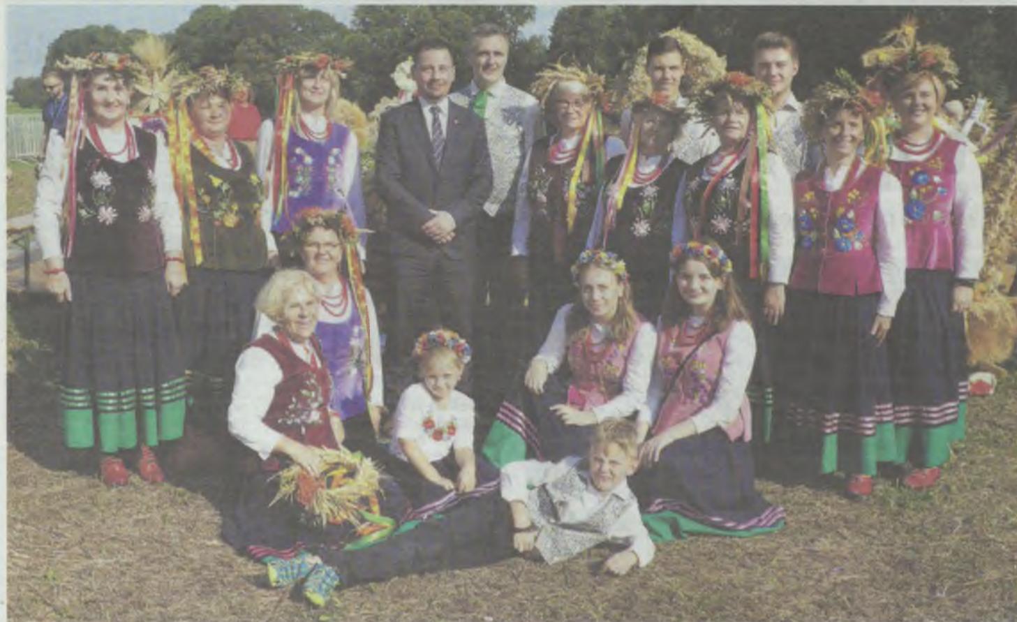
Na ludowo, dożynkowo...

KIJOWICE • Upalne bierutowskie święto plonów.