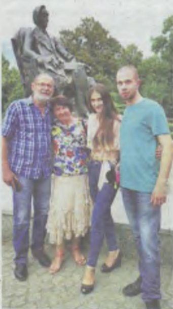
Oleśniczanka zagrała główną rolę

Oleśniczanka w odcinku polsatowskiego serialu paradokumentalnego zagrała rolę główną. „Jeżeli dzięki niej ludzie dowiedzą się, co to jest za choroba, jak postępować z bliskimi, którzy zachorują, to będę bardzo szczęśliwa i nie będę żałować, że zdecydowałam się po wtórnie wrócić do pracy na planie