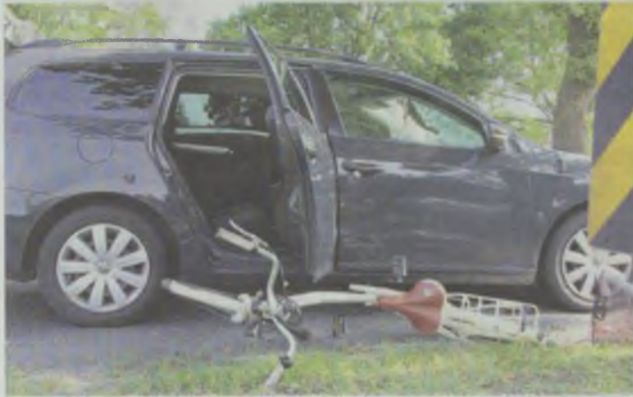
Kto był winny, zbadaj biegli

Ta tragedia wstrząsnęła Oleśnicą. Co zrobić, aby nie doszło do kolejnych?