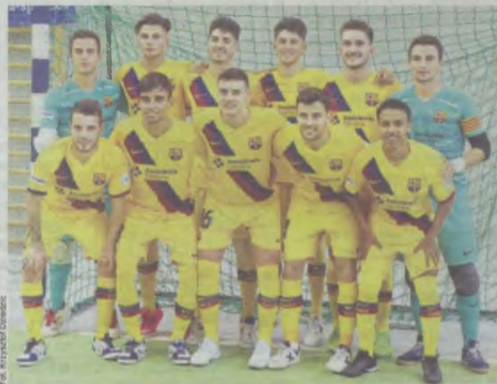
Barca B jednak nie wywalczyła pucharu

Turniej wygrała ekipa z Chrudmnia, która w finale pokonała Barcelonę 3:0. (kad)