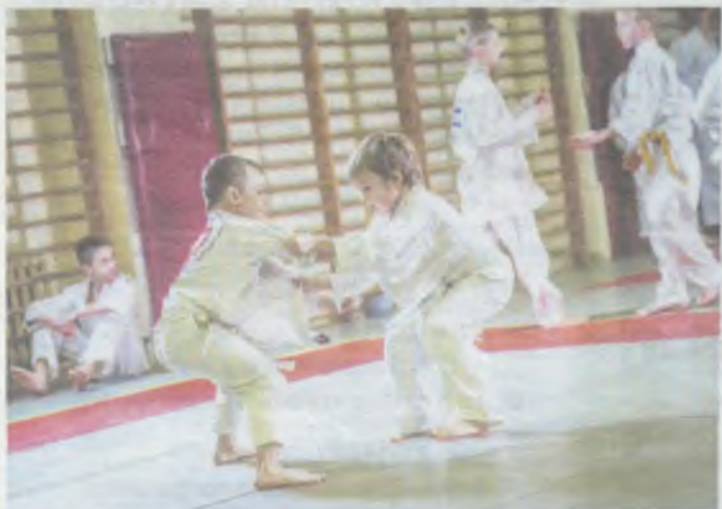
Judo to bardzo efektowny sport

Klub Judo Tigers rekrutuje następców Rafała Kubackiego.