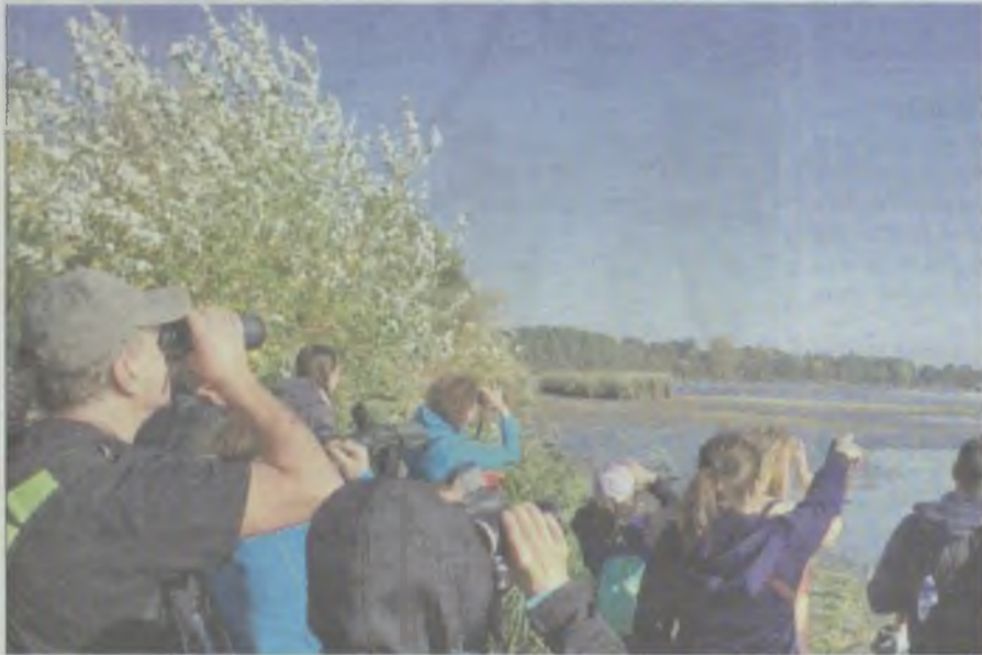
Jedną z atrakcji Dni Karpia jest obserwacja ptaków podczas spacerów ornitologicznych.

PARTNER STRONY: URZĄD MARSZAŁKOWSKI WOJEWÓDZTWA DOLNOŚLĄSKIEGO