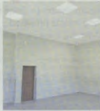
Wyremontowana sala w liceum

Ze środków od partnerów szkoły dokonano też adaptacji pomieszczenia szkolnego na nową pracownię fizyczną z zapleczem oraz adaptację pomieszczenia harcówki na salę dydaktyczną do języków obcych. Systemem gospodarczym wyremontowano pomieszczenie