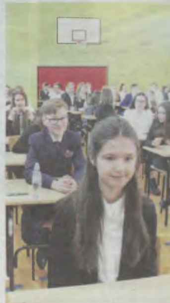
Ich wyniki są skrupnie analizowane

ZBK ogłosił przetarg na wykonanie izolacji i osuszenia budynku biurowego przy ulicy Wojska Polskiego 13. To siedziba PUP, ZBK i MOPS.