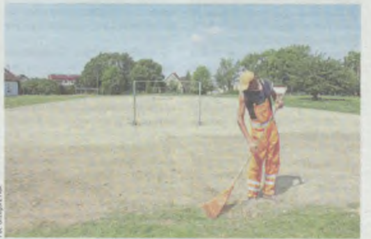
Teren pod boisko jest niwelowany

Bielański, nawiązując do realizacji wniosku o niwelację terenu przy Katolickiej SP, pytał, czy w ramach zaplanowanego 60-tysięcznego budżetu będzie jedynie niwelowany teren i zasiana trawa. Jego zdaniem tak duży koszt tak ograniczonej inwestycji budzi spore wątpliwości i pozostawia niedosyt, bo w pierwotnych planach była m.in. budowa bieżni lekkoatletycznej.