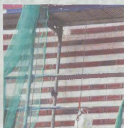
To był ciekawy przykład modernistycznego stylu

Gdzie? Na siedzibie Komendy Powiatowej Policji. Piękna cegła jest oklejana styropianem.