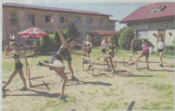
Treningi mają zapoczątkować w sezonie