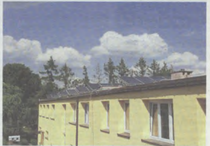
Fotowoltaika przyniesie oszczędności