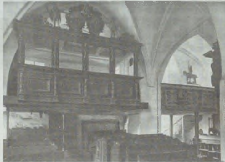
Fragment zdjęcia loży książęcej z kościoła NMP i św. Jerzego. Na loży znajduje się analogiczna kompozycja heraldyczna jak na stallach książęcych ufundowanych w 1678 r. dla kościoła zamkowego przez księcia Sylwiusza Fryderyka