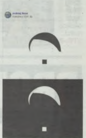
Ot, taki hejt „stratega”

O efektach pracy stratega jak na razie nic nie słychać. Oby nie były