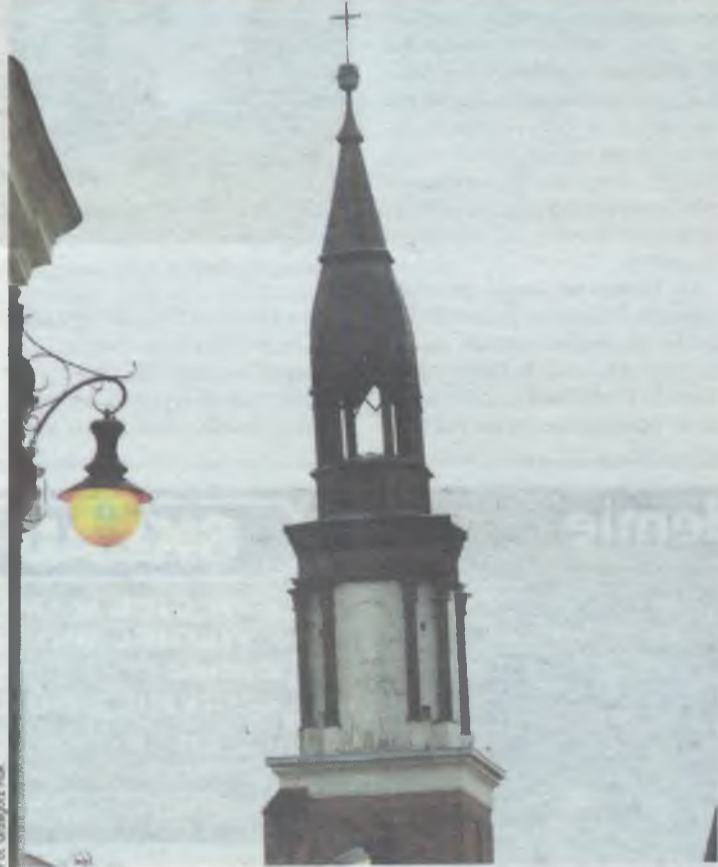
To Piza? Nie, to Oleśnica

A co mówi gospodarz świątyni? - Jest opracowywany projekt remontu wieży. Myślę, że w tym roku będzie już gotowy i od przyszłego