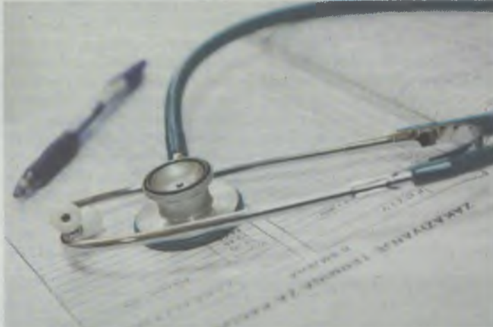
„Martwe dusze” w dokumentacji dla NFZ