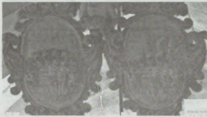
Po powiększeniu okazało się, że są to analogiczne herby jak te na kolorowym zdjęciu, należące do Sylwiusza Fryderyka i jego żony.

I co? No i właśnie odkrył, że tak jest. Na portalu bildindex.de pojawiły się zdjęcia loży o większej rozdzielczości. A z powiększenia wynika, że na loży w kościele NMP i św. Jerzego znajduje się właśnie herb księcia Sylwiusza Fryderyka i Eleonory Karoliny. A to oznacza, że loża nie powstała w 1703 r. a prawdopodobnie wcześniej - w latach 1680 - 1690.