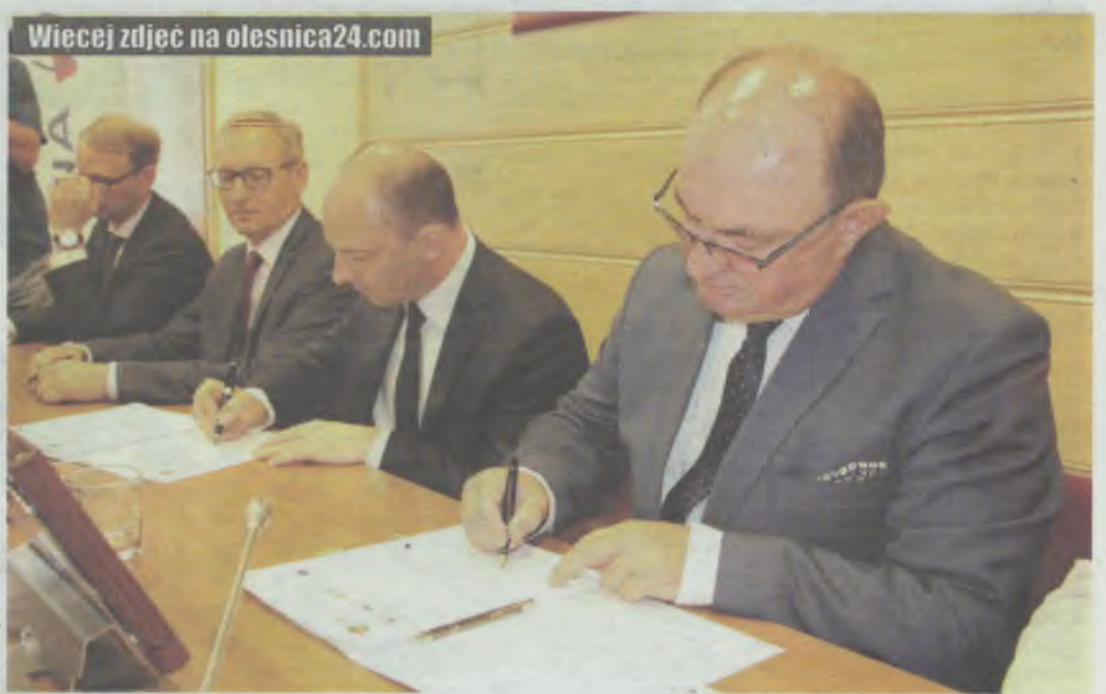
Wiecej zdjęć na olesnica24.com