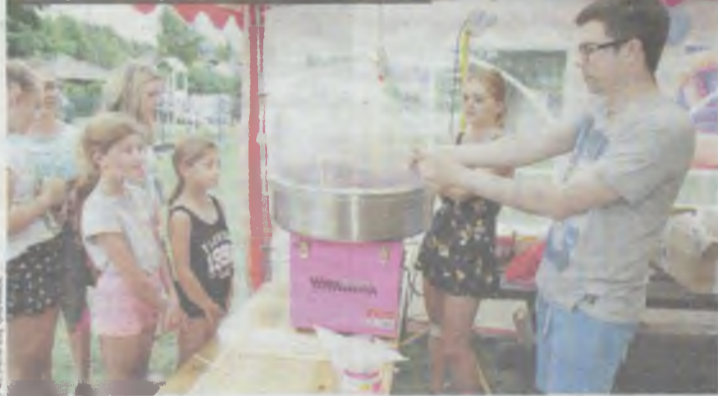
Burmistrz sam kręcił cukrową watę