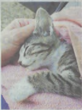
Ten kotek też nie przeżył...

- Jedne zamieszkały ze mną, inne znalazły kochające rodziny, jeszcze inne pozostały jako koty wolno żyjące i są dokarmiane. Gmina dwa miesiące temu oficjalnie uznała mnie za wolontariusza. Mam dzięki temu darmowy dostęp do weterynarza oraz karmę dla bezdomniaków – wyjaśnia Panorami. – Niedawno pewna dziewczyna poprosiła mnie o pomoc na ulicy Mickiewicza. Problemy z kotami były tam już dwa lata temu. Część z nich została odłowiona przez Oleśnickie Bidy, zostały 3 albo 4, które miała wysterylizować lub wykastrować gmina. Niestety, do tego nie doszło i rozmnożyły się, ale też na pewno przywędrowały tam jakieś nowe. A w tamtejszym bloku mieszka starszy pan, który od jakiegoś czasu odgrażał się, że on te koty wyeliminuje. Wraz z grupą wolontariuszek zaczęłyśmy je najpierw leczyć, aby potem móc zdrowe już wyłapać i poszukać im