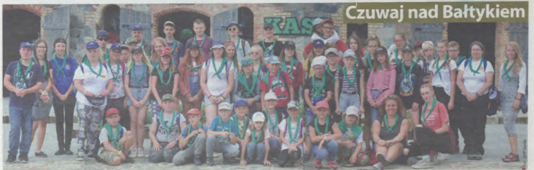
Harcerze z Hufca Związku Harcerstwa Polskiego w Sycowie wypoczywali od 20 lipca do 2 sierpnia nad morzem w Rozewiu. Pogoda sprzyjała plażowaniu. Pozostali im z tej wyprawy wspomnienia i pamiątkowe fotografie. (kad)