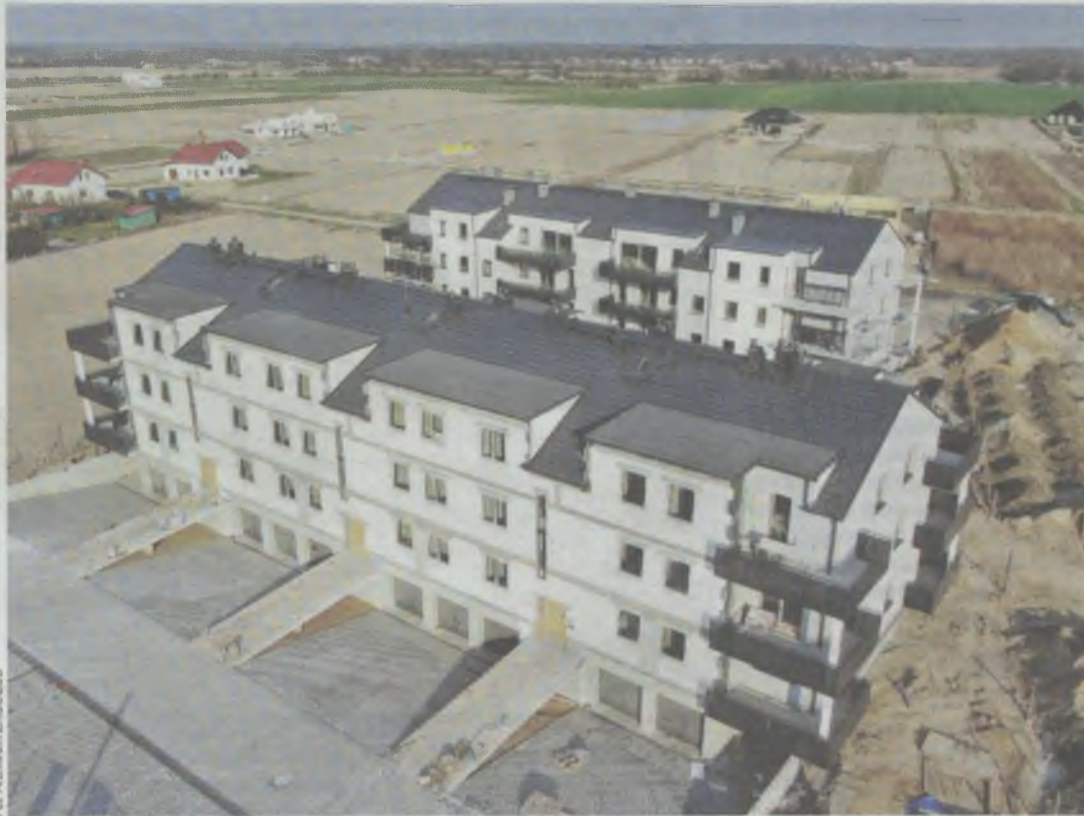
Dwa budynki, które postawiono na Wielkopólnej