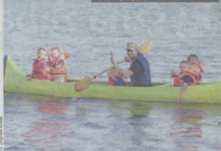
Kolejne „kajakowe” pokolenie bierutowian