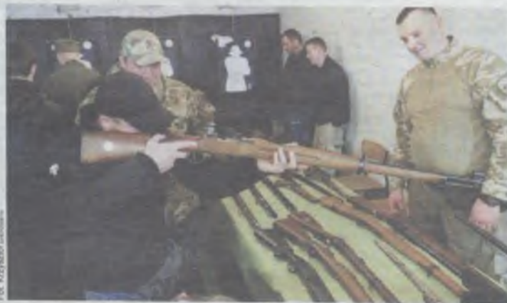
Będzie można przymierzyć oko...

„Wystawa jest wspaniałą okazją na podróż w historię polskiej (i nie tylko) obronności, od odzyskania niepodległości w 1918, po czasy współczesne. Dzięki uprzejmości Muzeum Foteli Katapultowych w Oleśnicy będziemy mogli zobaczyć również legendę polskiego lotnictwa - TS 11 Iskra. Na gości wystawy czekają również inne atrakcje, takie jak pokaz jazdy nie-