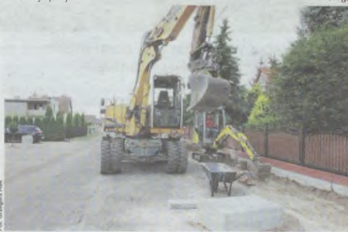
Mieszkańcy Nowicy wreszcie się doczekali