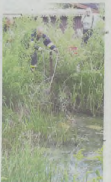
Sarna utknęła w stawie