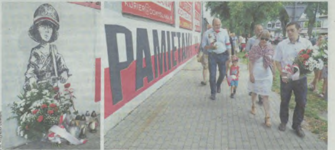
W Oleśnicy tradycyjnie złożono kwiaty pod wizerunkiem Małego Powstańca

Rocznicę wybuchu Powstania Warszawskiego obchodzono w Oleśnicy pod patriotycznym murem, a w Sycowie przy pamiątkowej tablicy.