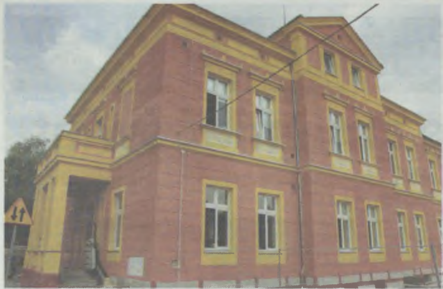
Różowy Dom, czyli siedziba władz gminy Oleśnica po nowemu