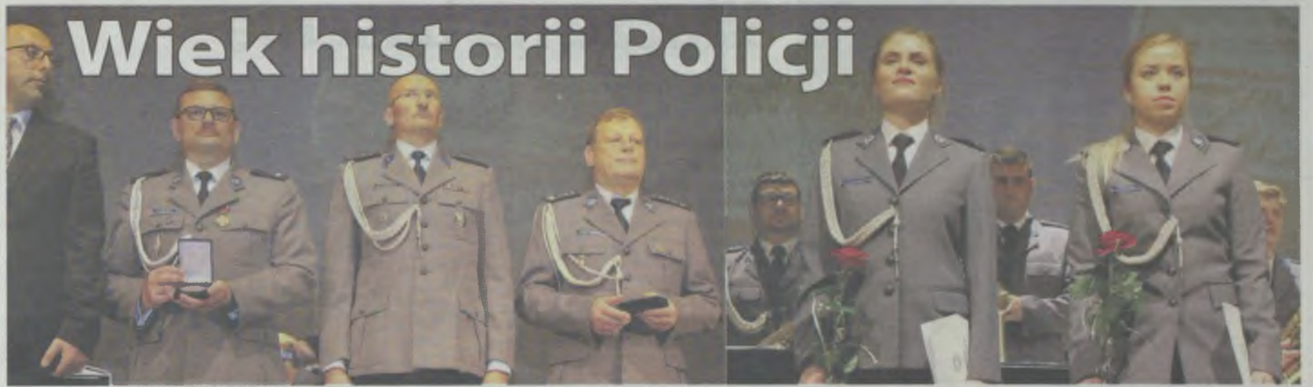
To był dla nich wszystkich podwójnie wyjątkowy dzień - doroczne święto i setny jubileusz