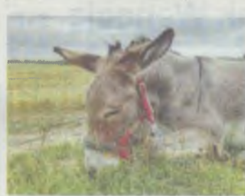
Tak śpi osiołek

na osiołkach wcale nie wieziemy złota ani diamentów. Ciekawe, że ludzie, mając całe szafy rzeczy w domach, dziwią się, widząc nasze kilka worków i pytają, co tam jest... (...) Jest kolejna wioszcza - Dobra, więc na pewno źle nam tu nie będzie. Nieużywane boisko do piłki nożnej zarosło już trawami, więc będzie w sam raz dla osiołków. Mała wiata w sam raz się nada na rozłożenie do schnięcia wszystkich przemoczonych rzeczy. Jeszcze 17 nie ma, a my już rozłożeni, dawno tak nie było. Ale przyjemnie jest mieć trochę więcej czasu wolnego. Mimo wyprawy mamy też trochę spraw na głowie, którymi musimy się zdalnie zająć, więc będzie idealny na to czas. Z pobliskiego