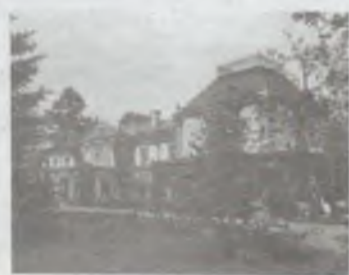
Dwór był kiedyś perelką

Wieś ma swoją bogatą historię. Jej świadectwem jest dwór należący kiedyś do książęcej rodziny Bironów von Kurland. Jest on zamieszkały, ale znajduje się w złym stanie. (kad)