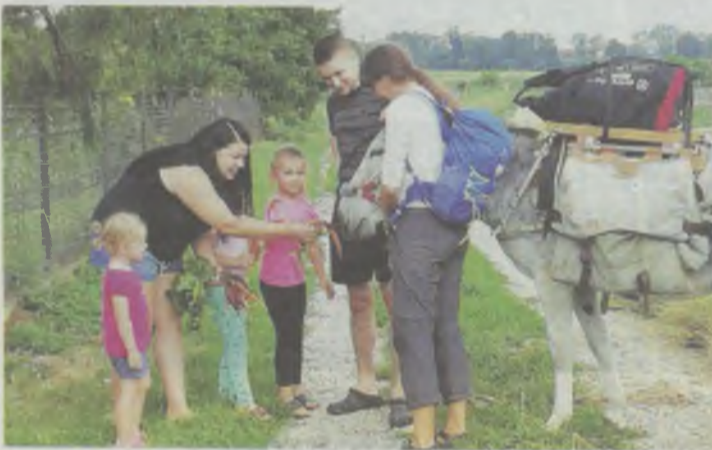
W Dobrzenu - mały komitet powitalny z marchewkami...

Idą we dwójkę z trzema osiołkami aż z Francji. Mieli przystanek w Dobrzenu, na nocleg zatrzymali się w Dobrej.