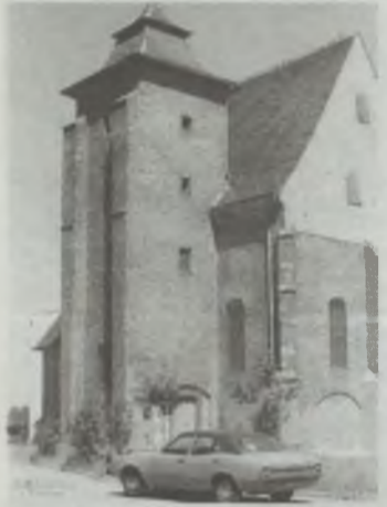
Auto na muralu nie wzięło się z kapelusza...