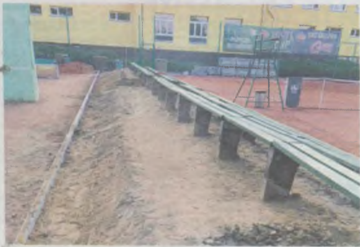
Z kibicami na trybunach będzie się chciało grać