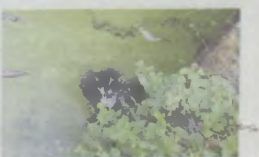
Psa uratowano z silosu