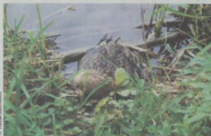
Widok martwych kaczek zaniepokoił oleśniczan