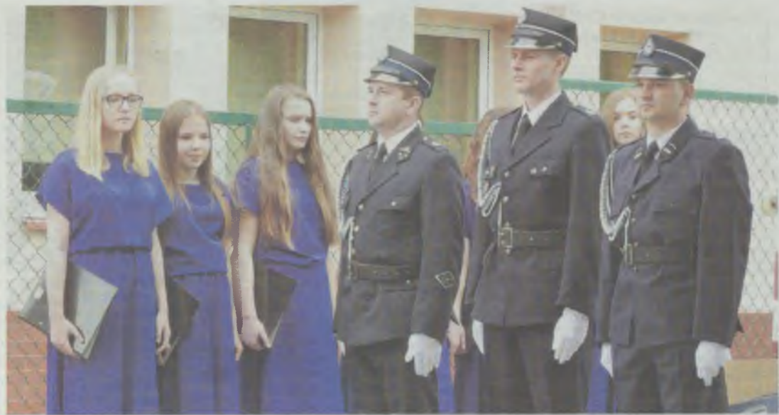
Oddano hołd zabitym w Dylągowie

RADZOWICE. Współczesne pokolenie nadal pamięta koszmar, jaki przeżyły ich rodziny kilkadziesiąt lat wcześniej nad Sanem.