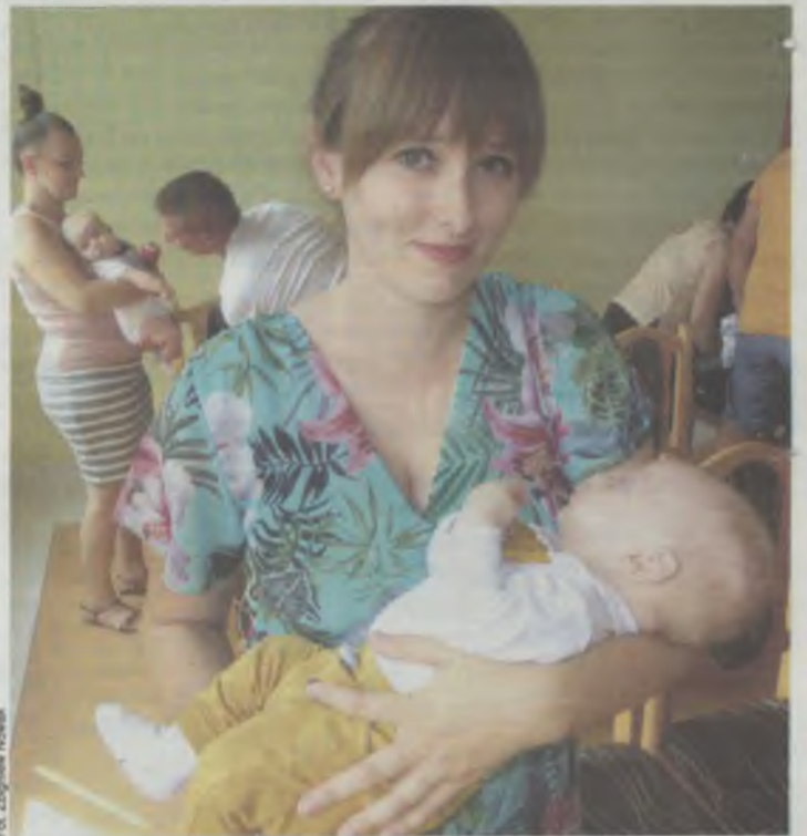
Jest szczęście! Władze gminy też się cieszą