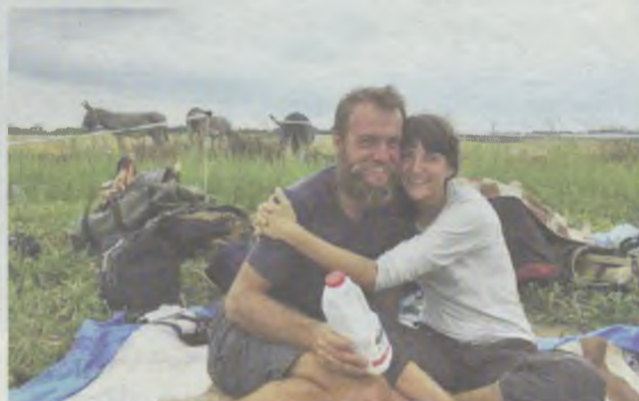
Zakochani w sobie i osłach...

„Idziemy polną drogą na tyłach wsi. Kilka osób nas zagaduje, a dalej przed nami widzimy mały komitet powitalny z marchewkami w rękę. Widzieli nas wczoraj w telewizji. Znowu chwilę gadamy, wyjaśniamy, że w workach