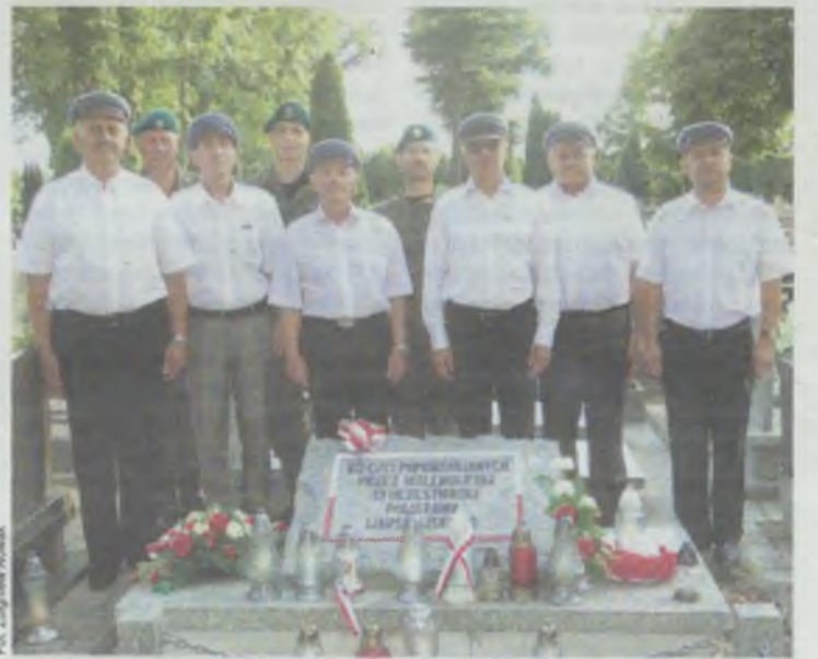
W Sycowie czci się pamięć o powstańcach przy pamiątkowej tablicy

1 sierpnia również Syców pamiętał o rocznicy wybuchu Powstania Warszawskiego. O godz. 17.00 uczestnicy uroczystości zgromadzili się pod tablicą pamiątkową umieszczoną na budynku gazowni. To właśnie tam w 1945 r. znaleziono ciała zamordowanych powstańców, którzy wcześniej