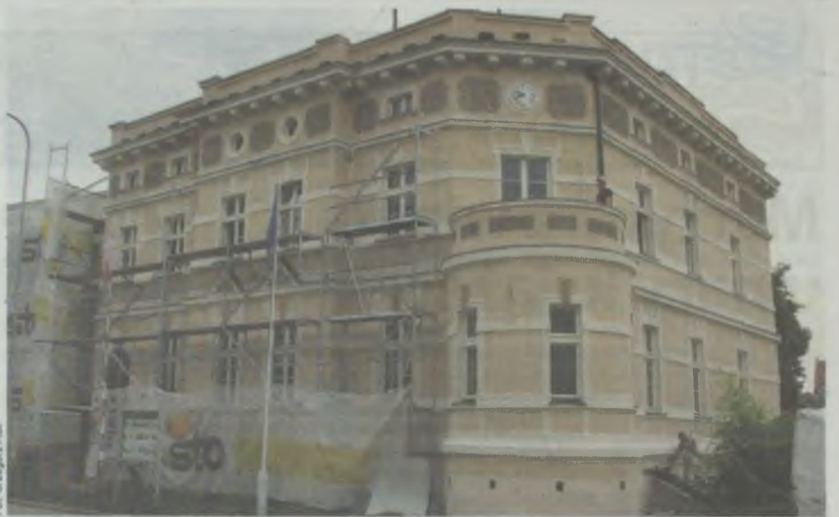
Nareszcie nie będzie się trzeba wstydzić przed gośćmi...