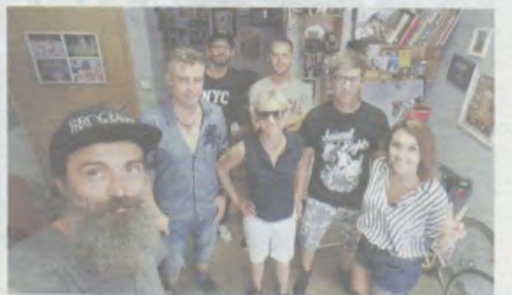
Oleśnicką grupę rowerową poznają telewizywnie na Dolnym Śląsku

„Długo nie trzeba było nas namawiać. Tym bardziej jesteśmy dumni, że wystąpiliśmy dzisiaj w roli przewodników po Oleśnicy, by wspólnie z autorami audycji pokazać walory przyrodnicze, historyczne, społeczne i kulturalne miasta i gminy Oleśnica. Wszystko oczywiście z perspektywy sio-