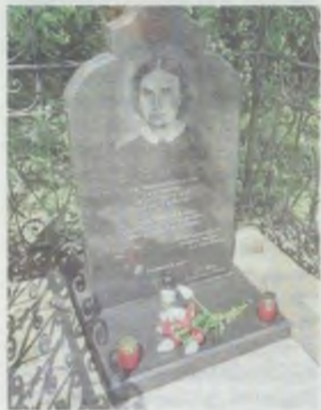
Takie wakacyjne wyprawy kształtują patriotyzm młodych ludzi