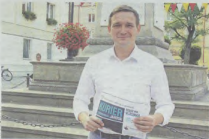
Posel deklaruje starania o karetkę i rewitalizację dworca w Sycowie

Pracownicy SZPZOZ w Oleśnicy lekarzowi Sabinie Sworeń wyrazi głębokiego współczucia i słowa otuchy z powodu śmierci