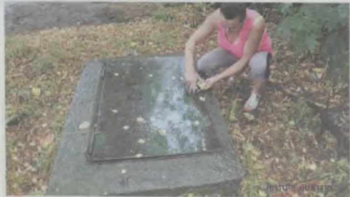
Schron został zabezpieczony

Jak już informowaliśmy, pasjonatka historii zamierza zająć się rewitalizacją licznych schronów istniejących na terenie Oleśnicy. (kad)