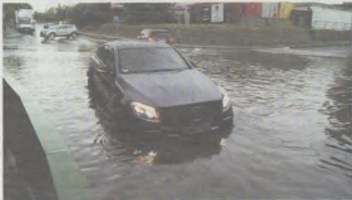
Kierowca myślał, że jest Panem Samochodzikiem?...

Najpierw mocno popadało, potem bardzo pozalewało. Tak jak zawsze.