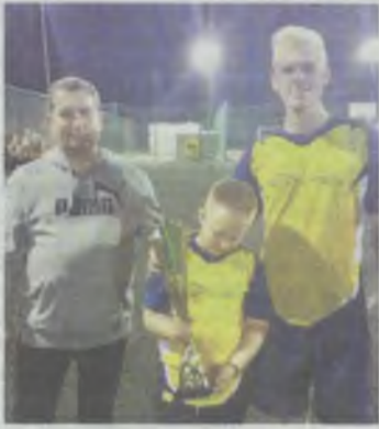
Najmilsza chwila - wręczanie nagród

Z dobrej strony pokazali się najmłodszy uczestnicy zawodów z Akademii Piłkarskiej Międzybórz, którzy pomimo bardzo dużej różnicy wiekowej większości składu potrafili nawiązać walkę z najlepszymi dru-