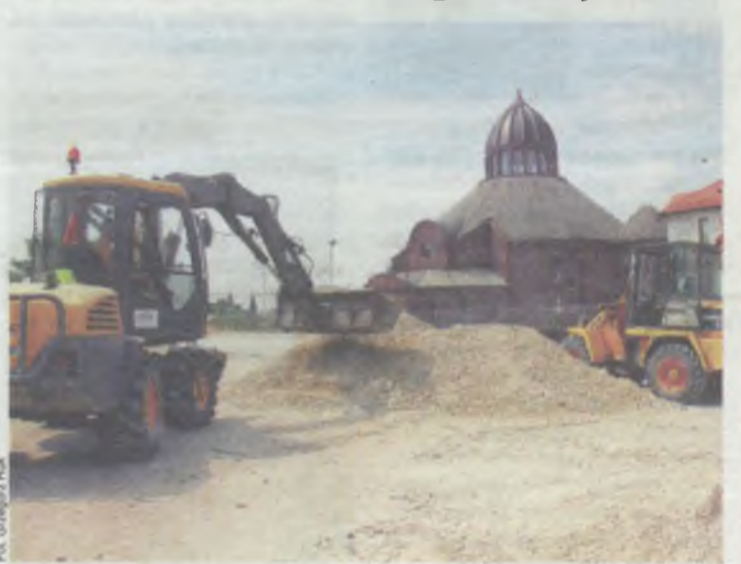
Tu roboty są najbardziej zaawansowane

...inwestycji trwa lub rozpocznie się niedługo.