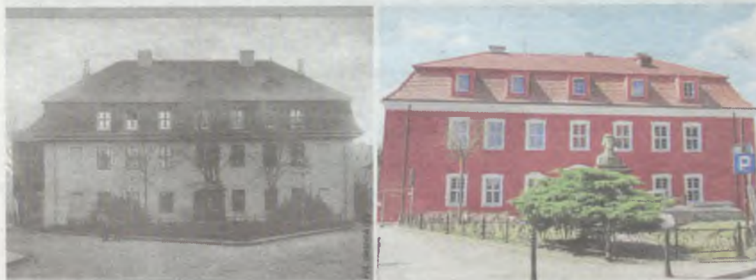
A jednak ten pierwotny miał lepsze proporcje