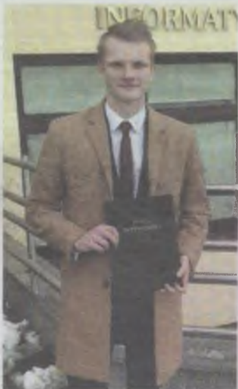
Wystartuje z listy PIS

Mówi, że porównań z mamą nie uniknie, ale chce pracować na własny rachunek.