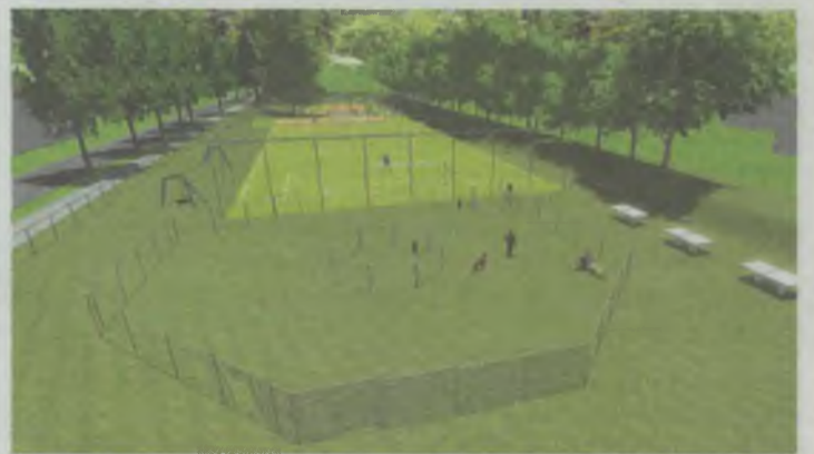
Dużo sportu i strefa dla psów

Ten teren ma ogromny potencjał. Z lewej ogród zapachowy, z prawej place zabaw, z tyłu boiska