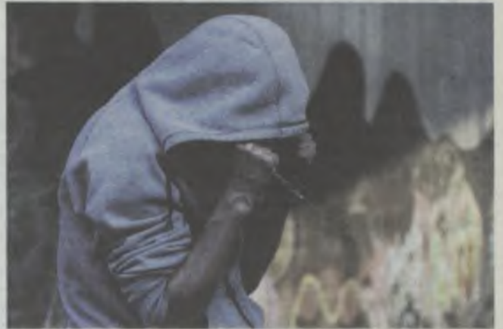
Ta produkcja mogła zniszczyć wiele osób