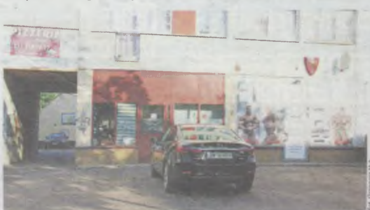
Samochody w tym miejscu przeszkadzają mieszkańcom

Nie ma jeszcze odpowiedzi burmistrza na ten wniosek. (ror)