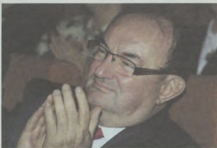
„Głównym celem deklaracji jest chęć większej władzy dla jej sygnatariuszy”

Fundacja zwróciła uwagę, że „swoboda realizowania zadań gminy w formule in-house to również widmo upadku wielu prywatnych firm kosztem samorządowych spółek obsadzanych z klucza politycznego”. Jak wskazuje fundacja, „takie sytuacje mają już dziś miejsce w obszarach, w których procedura in-house jest dopuszczalna np. w gospodarce odpadami” (wyjaśnijmy, że określenie „in-house” odnosi się do przedsięwzięcia realizowanego we własnym zakresie, własnymi siłami,