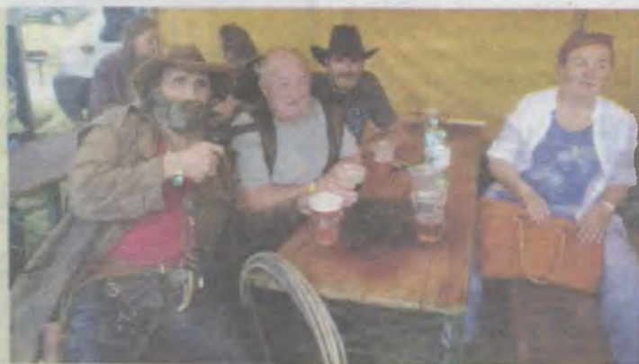
Szeryfowi Pan Rysio nie może odmówić...

Wspaniała pogoda sprzyja tegorocznemu wypoczynkowi. Mieszkańcy Oleśnicy i okolic mogą jeszcze skorzystać w sierpniu i we wrześniu z domków campingowych oferowanych