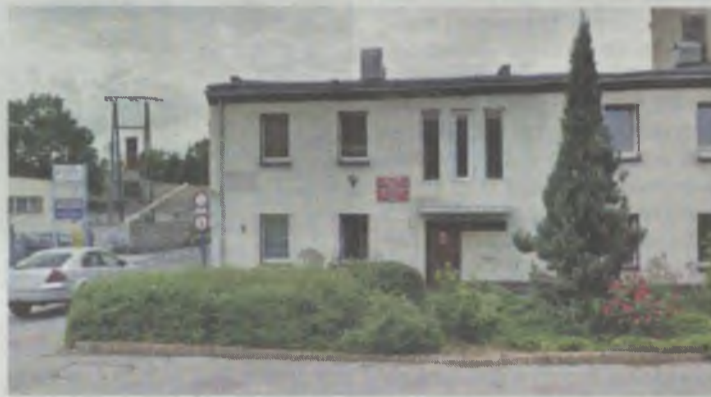
Sycowski MGOPS ma problem...

Pieniądze zostały przelane na prywatne konto pracownicy z ponad 10-letnim stażem pracy w ośrodku. Zawiadomienie dotyczy trzech przelewów z tego roku,