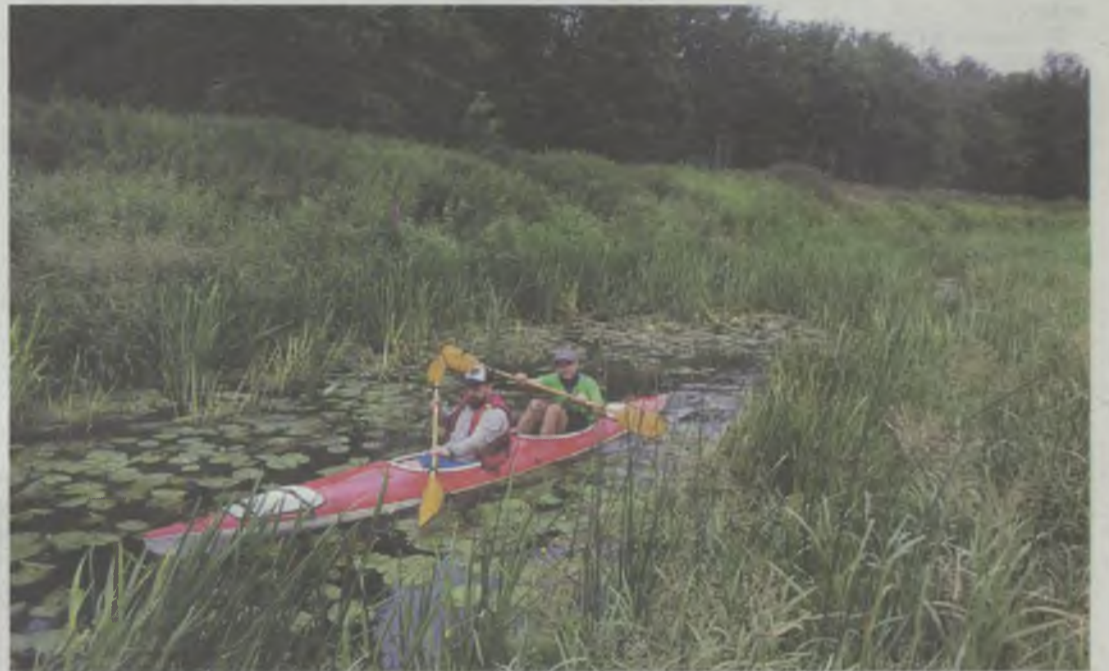
Na survival jest super!

BIERUTÓW. Widawa ma fenomenalny potencjał!