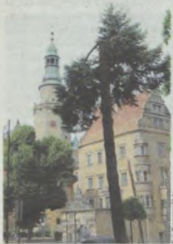
Kikut nr 1