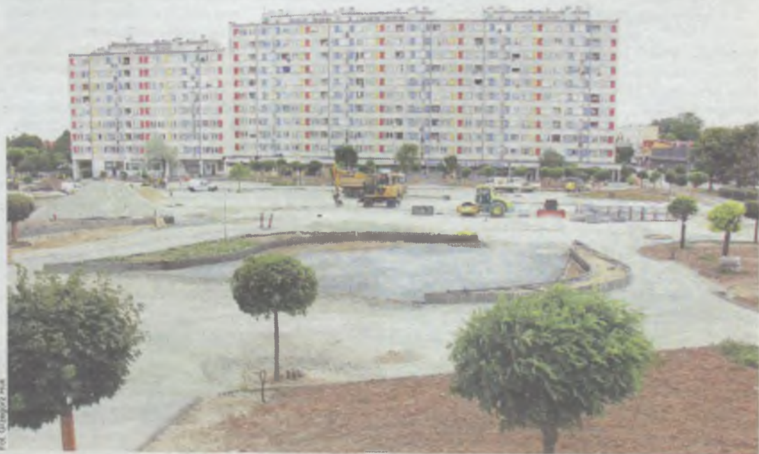
W listopadzie przejdziemy się tu spacerkiem. I pojedziemy na rolkach!