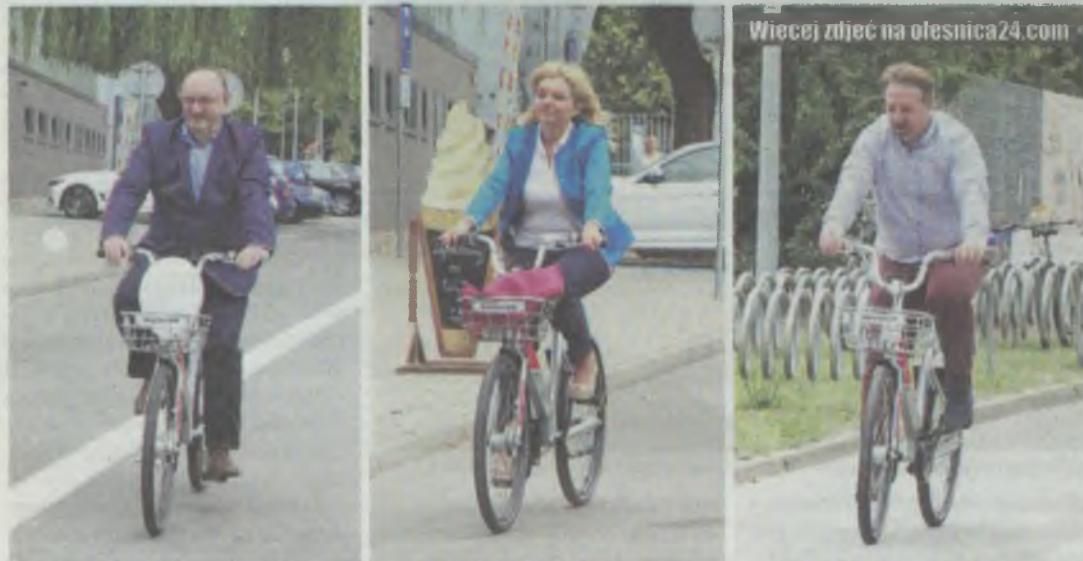
Pierwszymi użytkownikami byli decydenci

Olbike, system za 160 tysięcy, będzie testowany przez 3 miesiące. Jeśli się sprawdzi, umowa będzie kontynuowana.