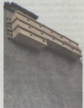
Są bardzo potrzebne

Koszt budki wynosi od 25 do 45 zł za sztukę. „Budki są konieczne ze