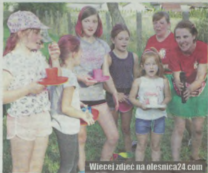
Wiecej zdjęć na olesnica24.com

W Moszycach zabawy z dziećmi prowadzone były przez animatorów, kłowna z „Animacje – rewelacje”. Animatorzy ze stowarzyszenia „Mam Pomysł” malowały twarze. OSP w Twardogórze zaprezentowała nowy wóz strażacki, zorganizowała