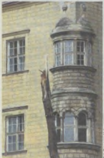
Kikut nr 2