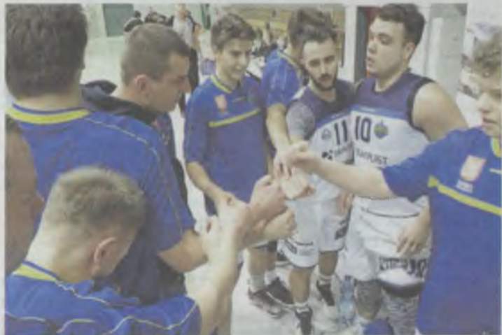
Dziękują sobie za sezon

„Był to ostatni mecz tego sezonu i chcielibyśmy podziękować wszystkim kibicom za niesamowity doping podczas każdego meczu” - czytamy na stronie klubu.