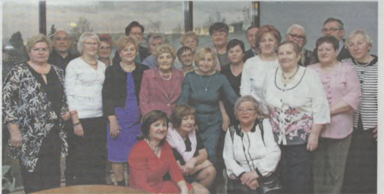
Szkolna wiara trzyma się dobrze...