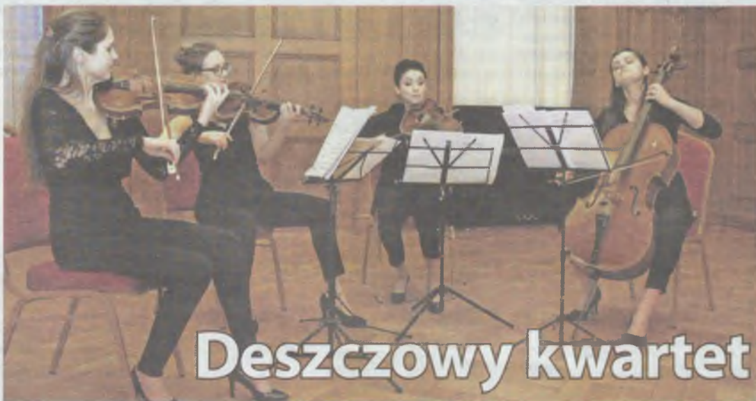
Smyczki wiodły prym