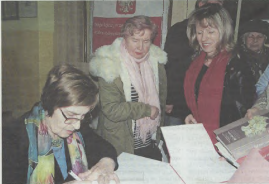
Autorski wieczór zakończył się kolejką po autografy

Kronikarka ziemi sycowskiej przybliżyła słuchaczom ciekawe i burzliwie dzieje dawnego pogranicza polsko-niemieckiego.