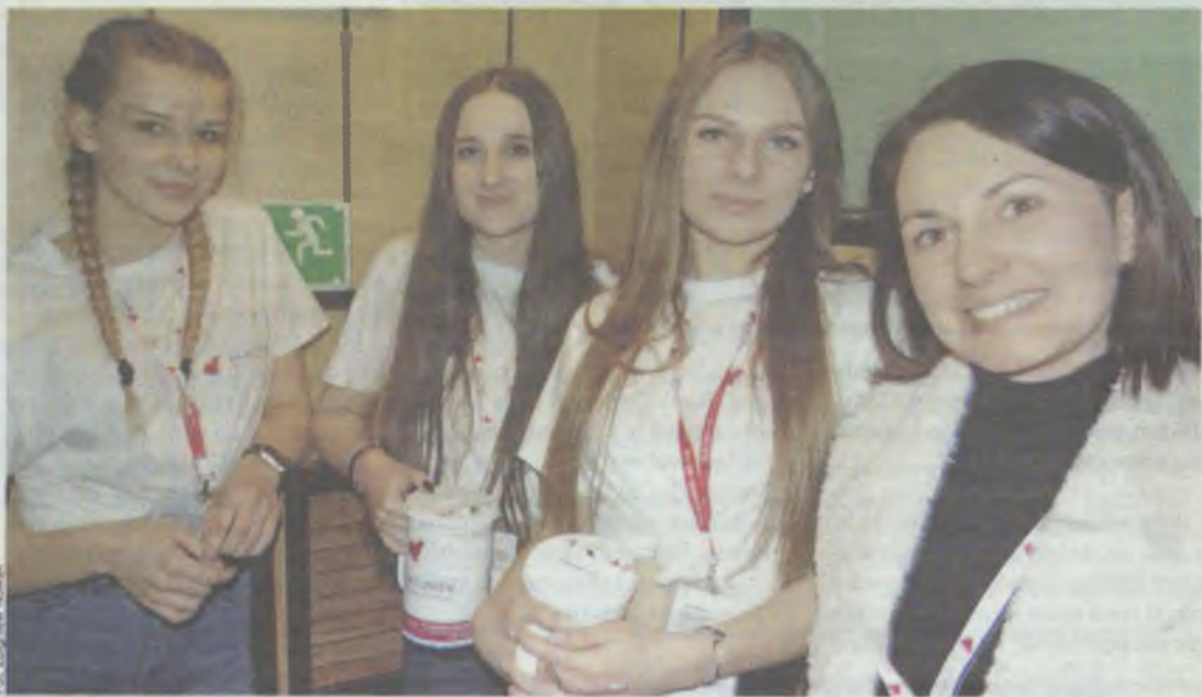
Anioły w akcji...

Muzyków i mieszkańców miasta połączyła chęć ratowania młodego życia.