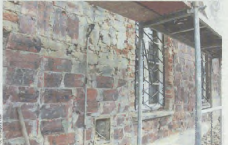
Okazało się, że ścianę uzupełniono dachówkami

Okazuje się, że konserwator zabytków zalecił przemodelowanie charakterystycznych łukowatych okien dachowych, tzw. lukarn. Teraz będą płasko zakończone miedzianym okapem, nawiązując do historycznego pierwowzoru.