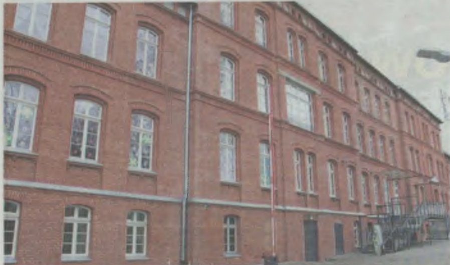
Zabytkowy obiekt odzyskał dawny blask. Po remoncie można się nim pochwalić

W opinii burmistrza Bronsia remont starego szpitala to była bardzo zła inwestycja. A remont starego dworca PKP ma być... bardzo dobrą. Spróbujmy to zrozumieć.