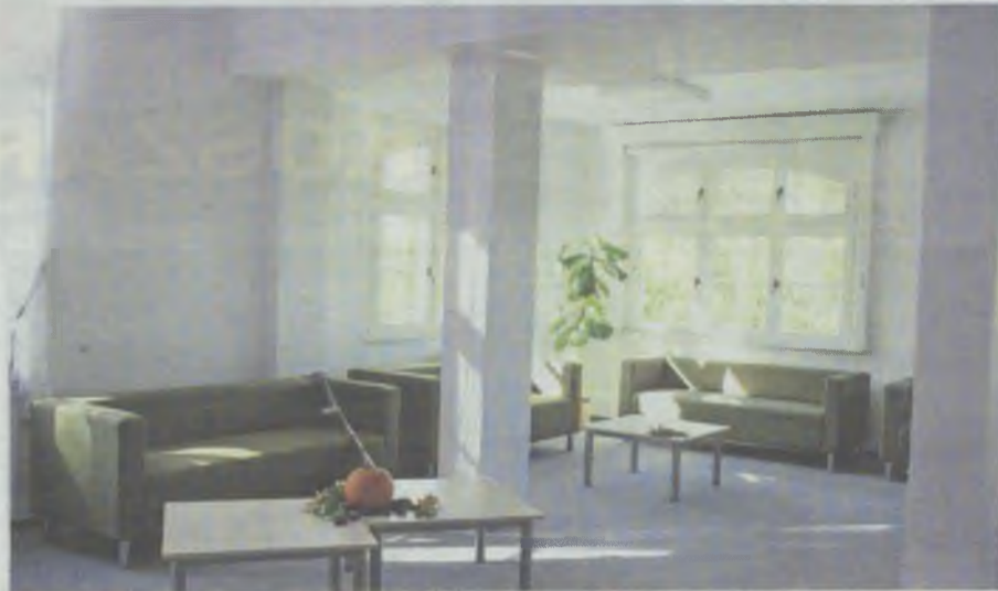
Klub seniora na miarę marzeń...