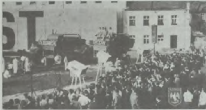
Konkurencja straży ogniowych