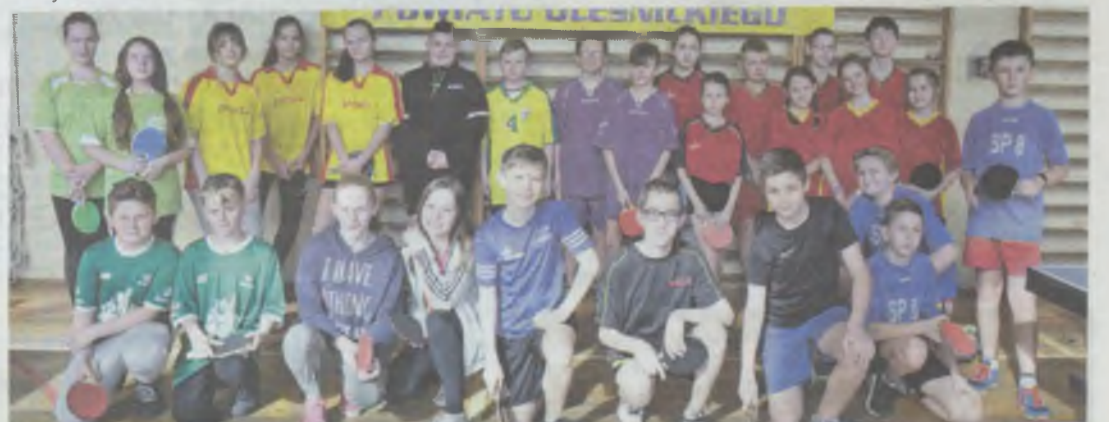
Powiatowi mistrzowie celuloidowej piłeczki

Najlepsze zespoły w każdej kategorii awansowały do zawodów strefy wrocławskiej. (ws)