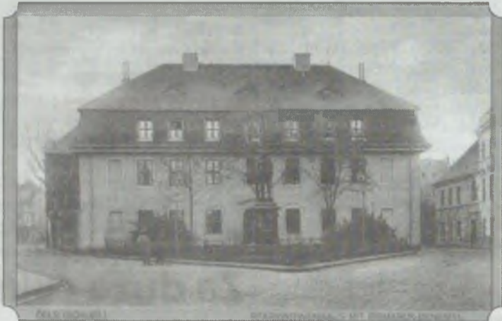
Dom Wdów po 1910 r. Po modernizacji na mansardzie urządzono pokoje mieszkalne z dużymi oknami. Z prawej ulica Kościelna i widoczny dom o numerach 9 i 10. Widoczny pomnik Bismarcka został w 1944 r. zdjęty na przetopienie. Na postumencie stoi dzisiaj popiersie Chopina