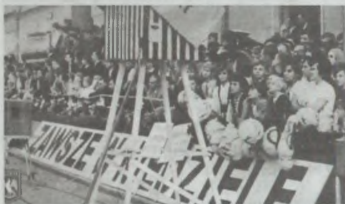
Na prowizorycznych trybunach w Oleśnicy