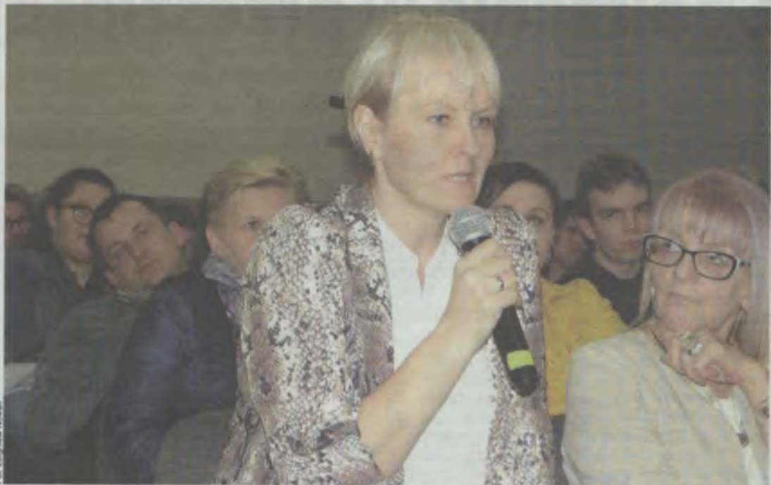
Duże zainteresowanie spotkaniem, spore emocje...

MIĘDZYBÓRZ. Uczniowie mogą się dowiedzieć w ostatniej chwili, że jednak egzaminu nie będzie i że znowu w jakimś, nie wiadomo jakim, terminie muszą się przygotowywać - niepokoje się dolnośląski wicekurator oświaty.