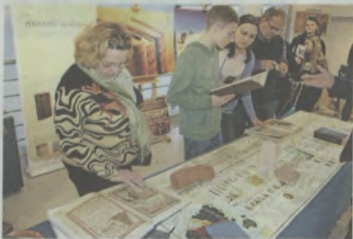
Zainteresowanych nie brakowało

Do soboty potrwa wystawa dziejów świętej księgi dwóch wielkich religii: judaizmu i chrześcijaństwa. Ekspozycje można wziąć w ręce.