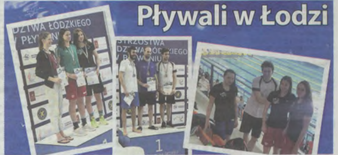
Zawodnicy Torpedy, pięciokrotnie stawali na podium

Pięć medali zdobyli pływacy oleśnickiej Torpedy na Mistrzostwach Województwa Łódzkiego.