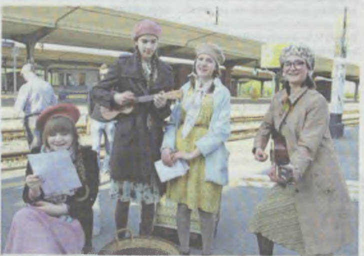
Bez śpiewania się nie obejdzie...

Wejście do pociągu będzie możliwe tylko na podstawie „kart repatrianta”. Będą one wydawane od godziny 6.15 na peronie I.