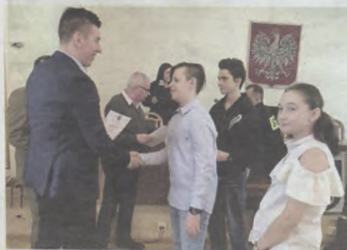
Dyplom i uścisk dłoni od burmistrza