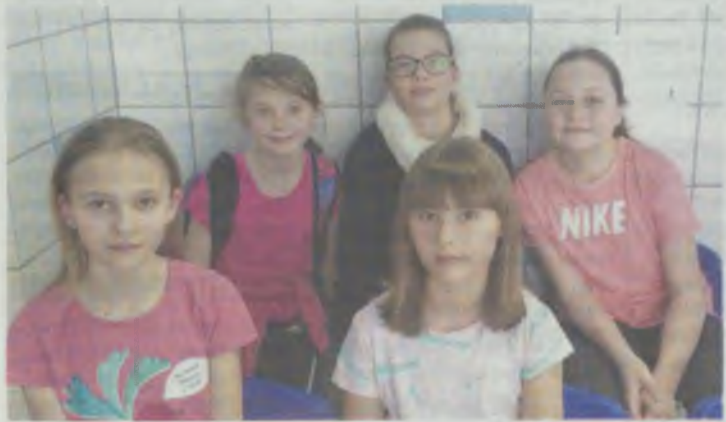
Nie ustępowały najlepszym

Dwa 4. miejsca drużynowo i 3 srebrne medale indywidualnie - to dorobek oleśnickich pływaków na wojewódzkich mistrzostwach.