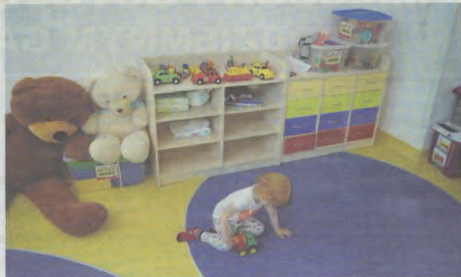
Miejskie przedszkole funkcjonuje już od początku roku szkolnego