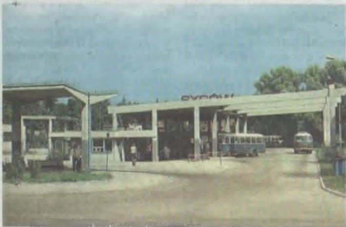
Tak wyglądał dworzec w czasach swojej świetności