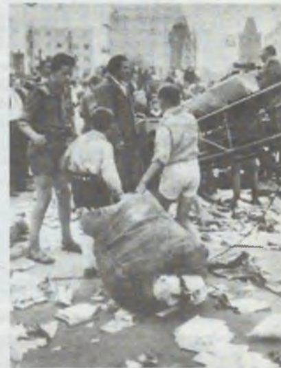
Zbiórka makulatury w Oleśnicy. W tej konkurencji najlepszy wynik uzyskali mieszkańcy Sycowa

A tymczasem „różnicę punktową na rzecz Oleśnicy pogłębiają