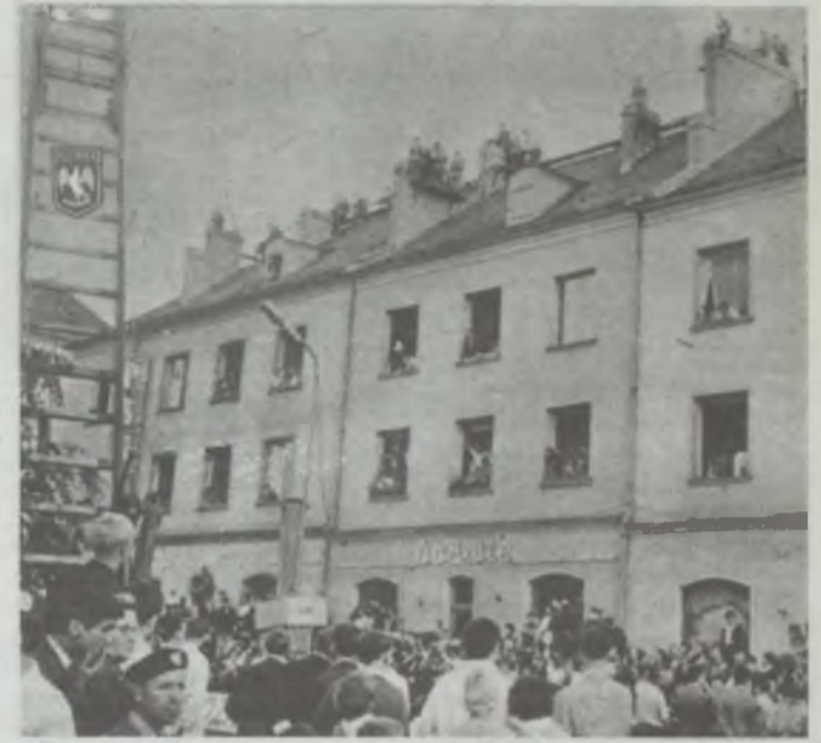
Ludzie obserwowali walkę z dachów!

Trzy zdjęcia pochodzą z archiwum Oleśnickiego Domu Spotkań z Kulturą i są autorstwa Edwarda Niczypora. Pozostałe zdjęcia i tekst z tygodnika „Ekran” udostępnił profil „Historia Oleśnicy”, prowadzony przez Pawła Szczegodzińskiego (zdjęcia z logo). Roman Rybak