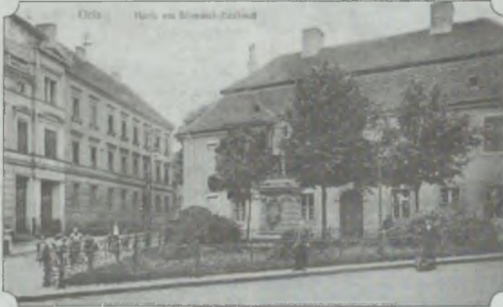
Zdjęcie sprzed modernizacji budynku. Widoczne jeszcze małe okienka na mansardzie. Z lewej widoczny nieistniejący już budynek nr 11, pełniący do 1923 r. rolę starostwa

Obecnie z zewnątrz rzucają się w oczy okalające budynek rusztowania i zabezpieczająca siatka. Jednak kiedy przyjrzymy się bliżej, widać, że na większej części elewacji obtłuczono stary tynk, spod którego wyziera zabytkowa, miejscami przyciemniała,