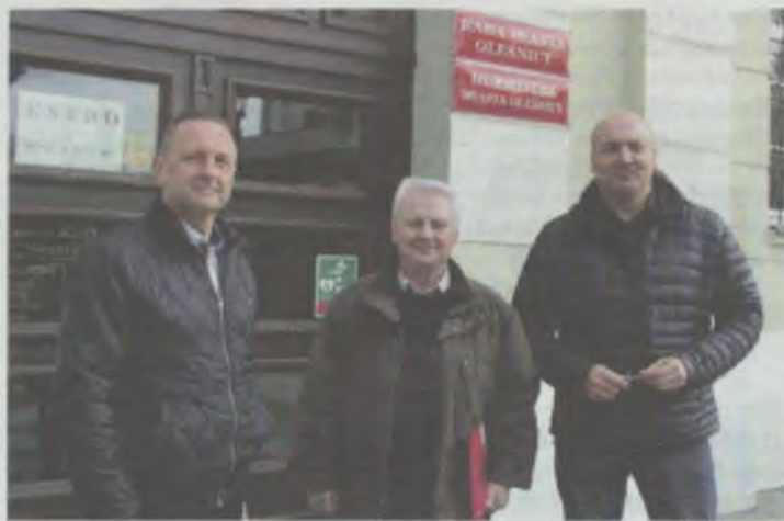
Skoro samorządowa większość storpedowała kontrolę Komisji Rewizyjnej, to zrobią ją trzej radni...