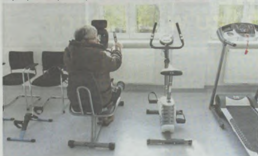
Starsi mieszkańcy zadają tu o kondycję fizyczną