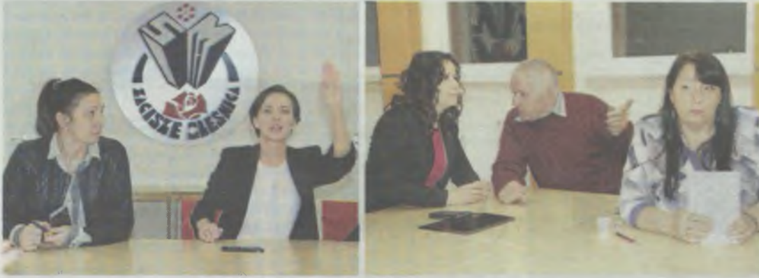
Posłanki skupiły się na sprawach kobiet

Jak Platforma Obywatelska, gdy była u władzy, dbała o sprawy kobiet?