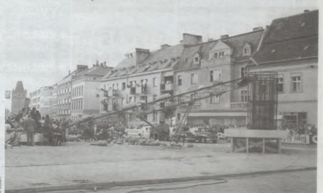
Plac przed kościołem św. Jana był jeszcze wówczas dziewiczym terenem