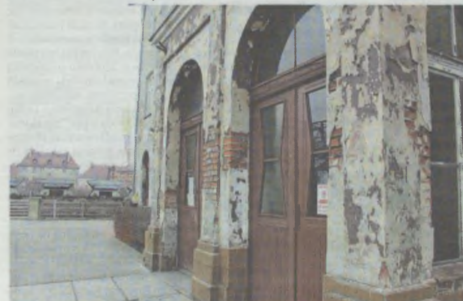
Główne wejście ma prowadzić i do kas biletowych, i do MOKIS-u 2