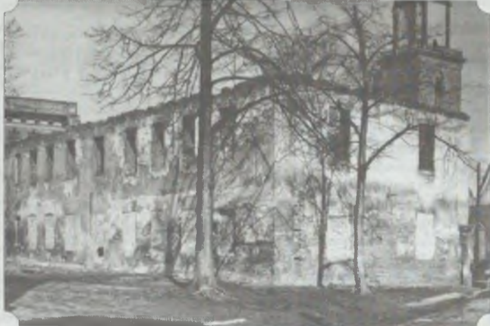
Dom Wdów od zewnątrz w 1955 roku, po rozebraniu murów mansardy

cegła. Jej ciemny nalot to pozostałość kilku pożarów, które na przestrzeni dziejów kilkakrotnie trawiły obiekt.