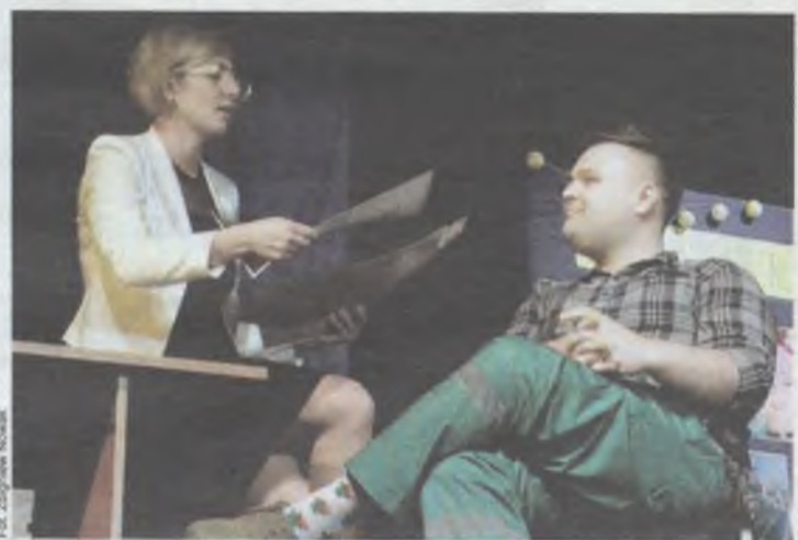
Jak tu trafić w oczekiwania szukających swojej drugiej połówki...