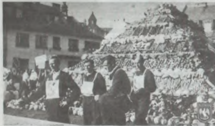
Drwale z Sycowa po zwycięstwie przegrali na rynku rodzinnego miasta