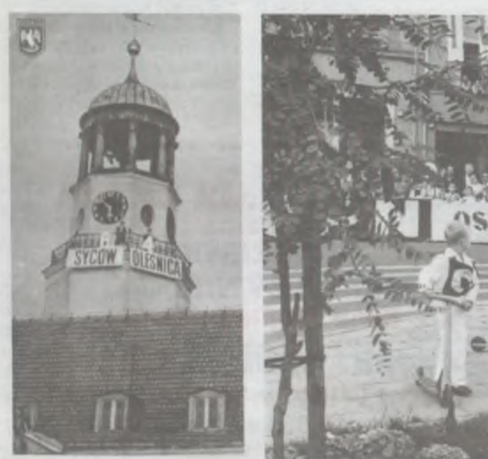
Już wtedy ścigali się na hulajnogach

Zdecydowana faworytka nie wytrzymała nerwowo... No i o ile punktów Oleśnica wygrała?