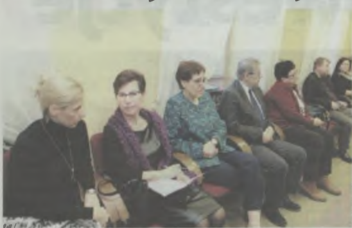
Zarządzenie przewodniczącego pilnie wykonano