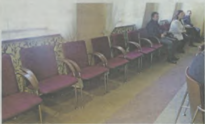
Wszystko wróciło na swoje tory

Pomysł nie wypalił. Naczelniczy i kierownicy „nie posłuchali się”. Co dalej?