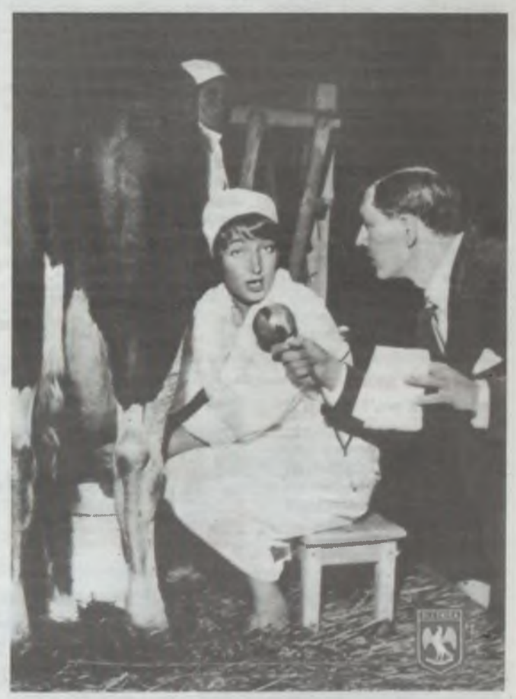
W tej konkurencji niespodziewanie zwyciężyła Oleśnica