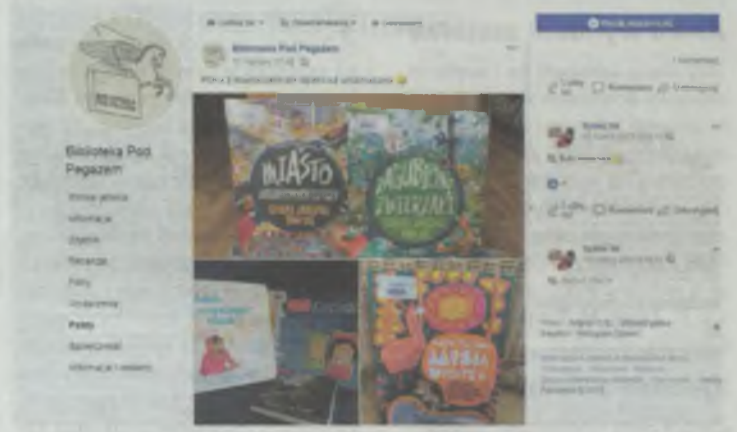
Pani bibliotekarka z Pod Pegazem powinna dostać za to średnią rynkową...