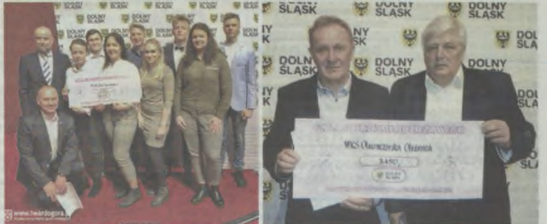
Nagrody trafiły do Echa (z lewej) i Oleśniczanki

Oleśniczanka i Echo otrzymają dotację po 3.450 zł.