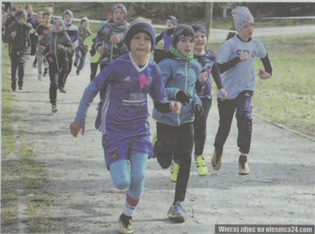
Przelajem przez podzamcze

17 zawodników z naszego powiatu - z Oleśnicy, Międzyborza i Twardogóry - stanęło na podium Dolnośląskich Biegów Przelajowych.