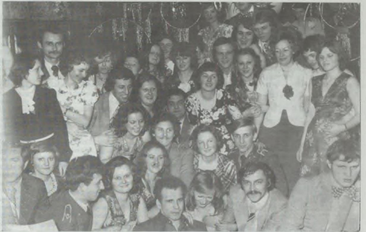
Tacy byliśmy jeszcze wczoraj...