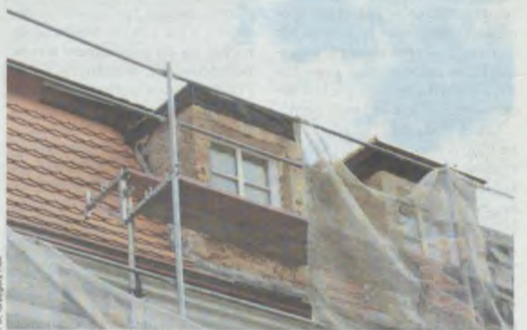
Od południowej strony lukarny prawie gotowe