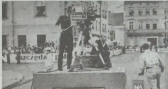
Kamera nr 4 na rynku w Oleśnicy