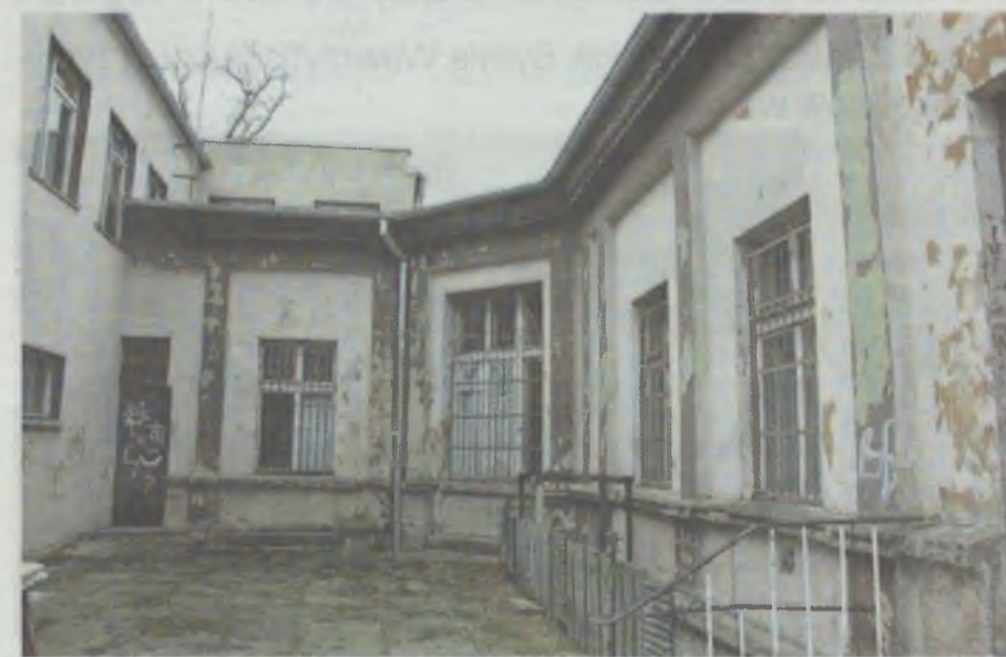
Takich zakamarków na dworcu jest wiele