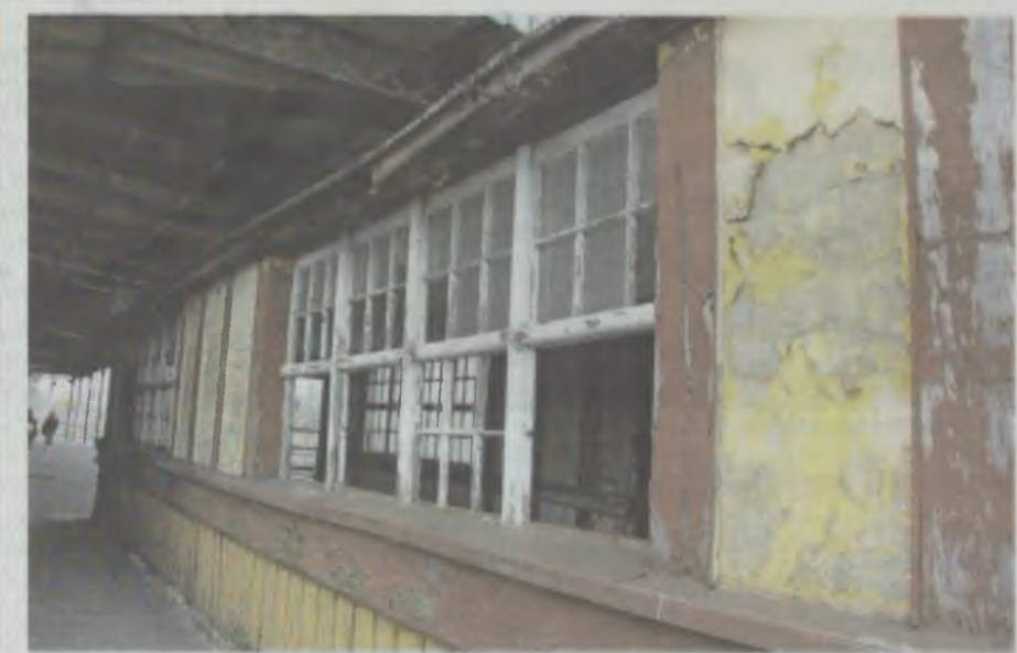
Skoro przejmujemy też peron nr 1, to zapłacimy także za remont wejścia do podziemnego przejścia