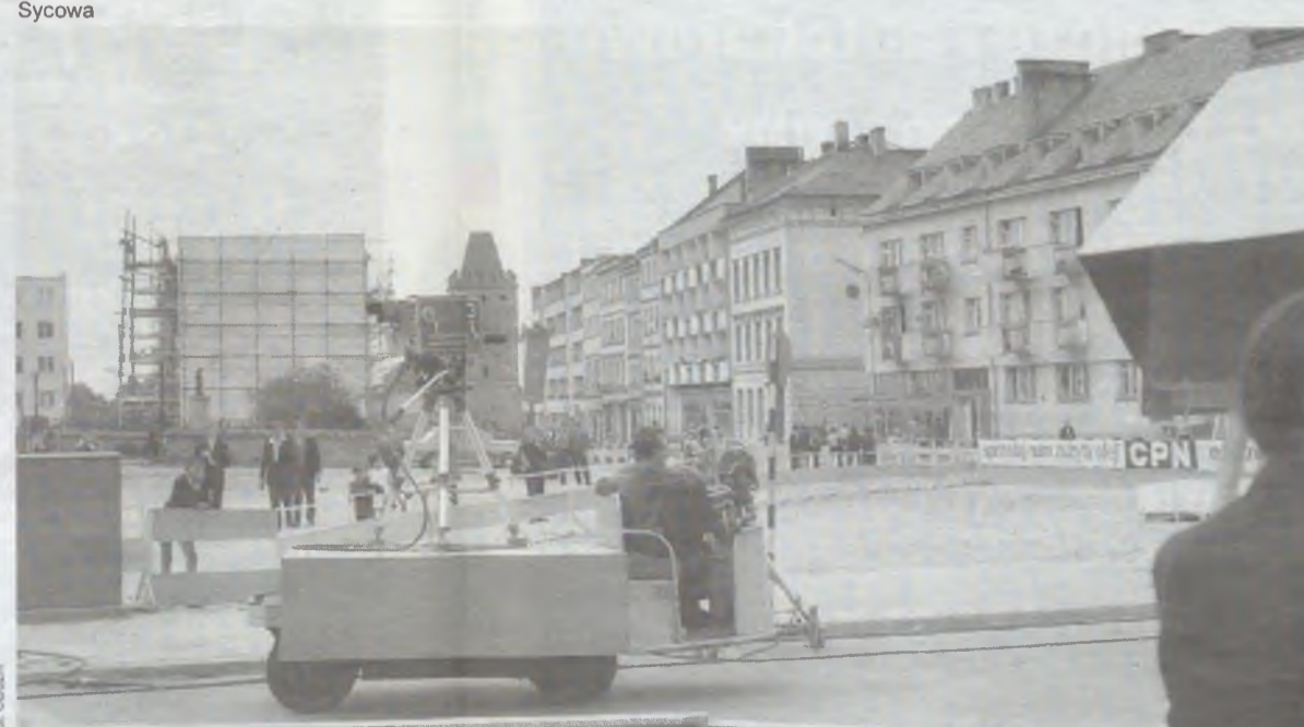
Trwają przygotowania do transmisji