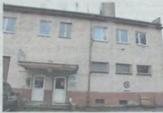
Siedziba na Ludwikowskiej przestała spełniać swoje zadanie

Planowane w szpitalu dostosowanie bloku operacyjnego do aktualnych standardów może wiązać się z rozbudową szpitala i stąd pomysł przeniesienia siedziby Pogotowia Ratunkowego na teren