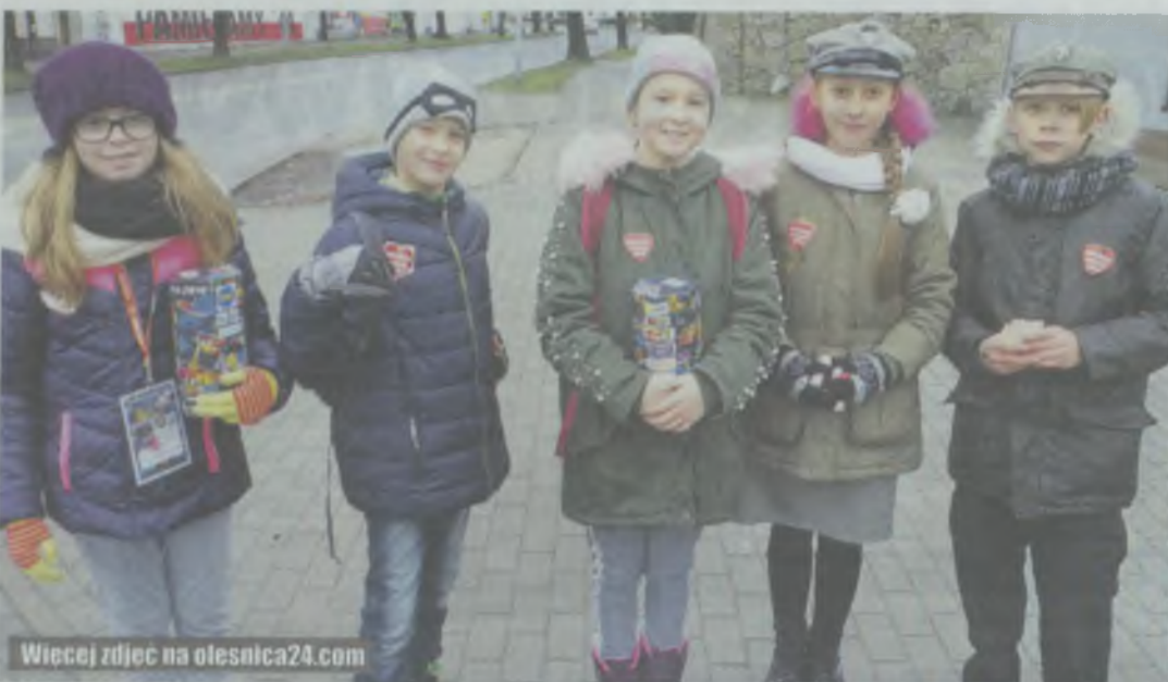
Wiecej zdjęć na olesnica24.com