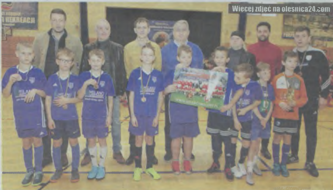
Plakat, medal i zdjęcie z gwiazdami będą cennymi pamiątkami dla młodych piłkarzy

W niedzielę od rana zagrały drużyny rocznika 2010/2011 reprezentujące kluby: Zagłębie Lubin I,II,III, Miedź Legnica, AP Szczot Twardogóra, SP