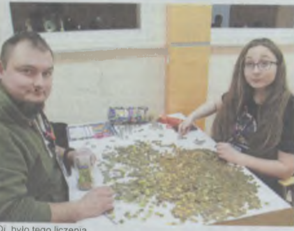
Oj, było tego liczenia