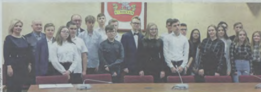
Samorządowa młodzieżowa rodzina

Młodzi radni powołali komisje do spraw kultury i rozrywki, wolontariatu oraz promocji Młodzieżowej Rady Miasta Oleśnicy.