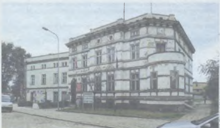
Wszyscy widzą, że wymaga remontu

„Dziękuję bardzo wszystkim, którzy przyczynili się do tego sukcesu. Jeśli nie będzie problemów z wyłonieniem wykonawcy - czego życzył wszystkim beneficjentom marszałek Przybylski - to na wiosnę ruszamy z remontem” - napisał burmistrz Sawicki. (ror)