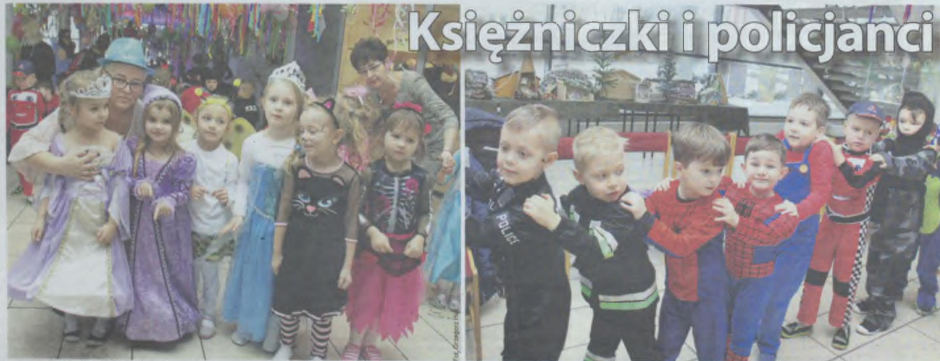
Księżniczki, królowny, damy dworu...