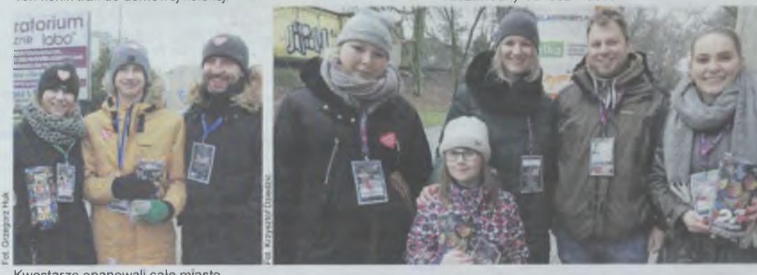
Kwestarze opanowali całe miasto