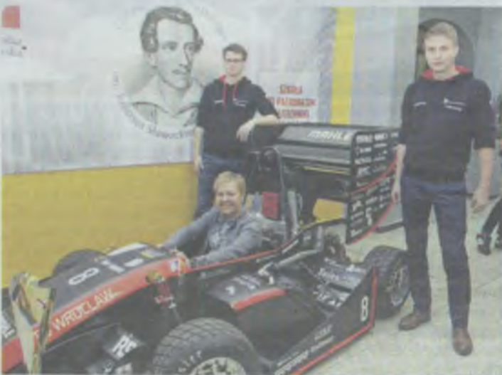
Formuła I w I LO

Oleśnickie liceum zainaugurowało współpracę z Politechniką Wrocławską.