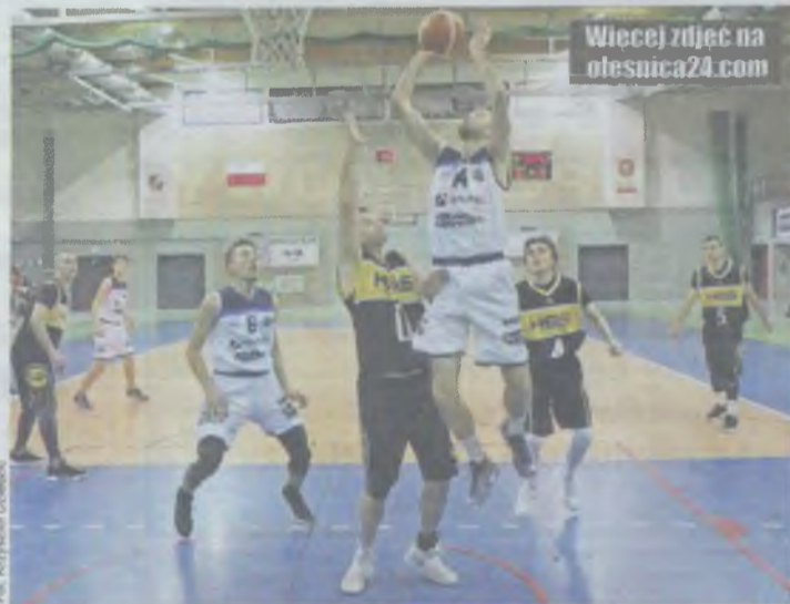
Nasi trafiali zbyt rzadko...