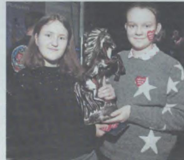
Ten konik trafi do domowej kolekcji