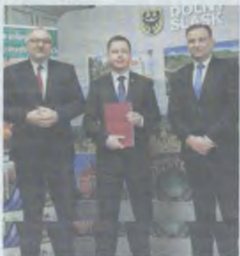
Będzie wsparcie finansowe!

Zakładany całkowity koszt rewitalizacji budynku to 820.000 zł, a więc dotacja pokryje ok. 60 proc. kosztów.