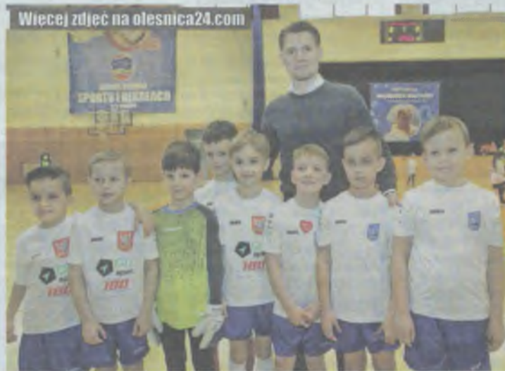
Może pójść w ślady Artura Wichniarki