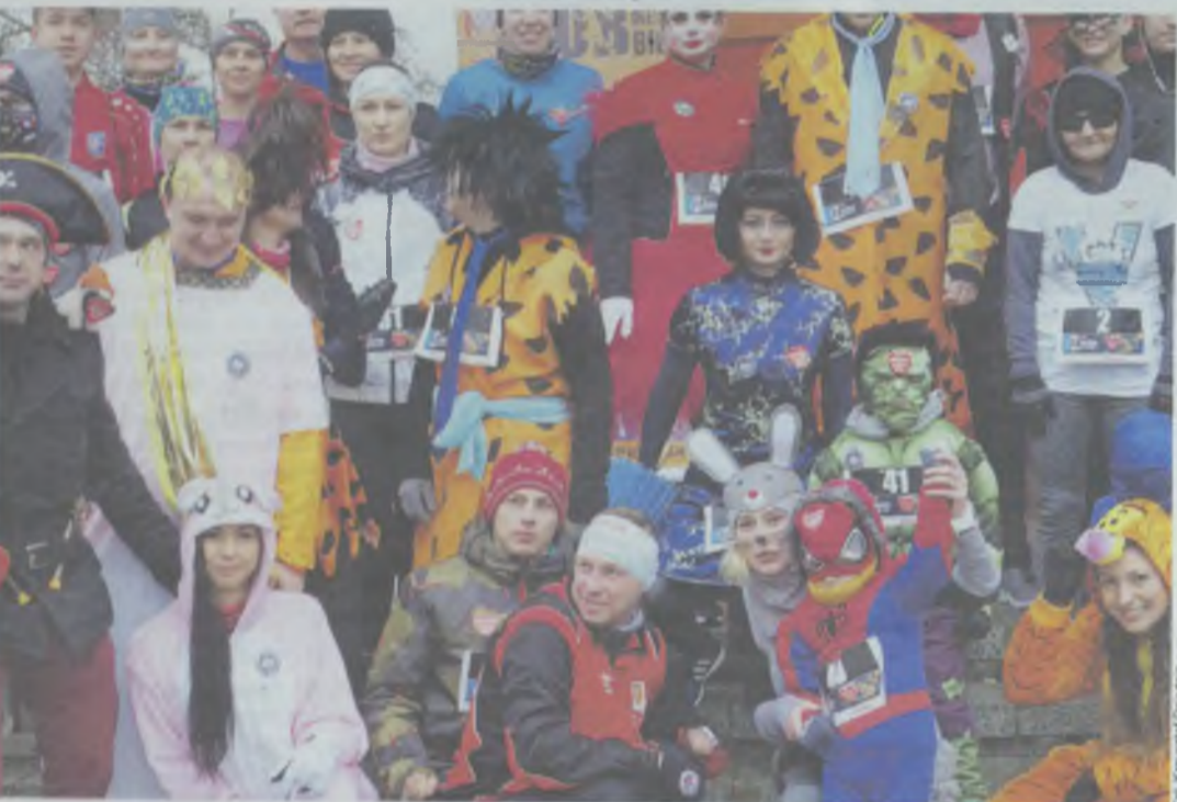
Bieg w karnawalowym wydaniu