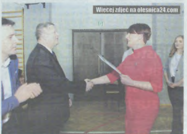
Umowa o współpracy przy pieczętowana