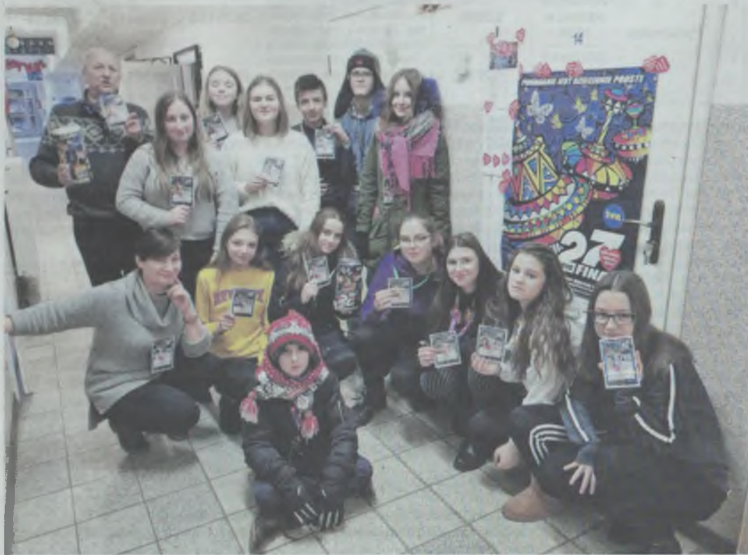
W szkole w Ligocie Polskiej wielka mobilizacja

MIĘDZYBÓRZ/BIERUTÓW/GMINA OLEŚNICA/DZIADOWA KŁODA/DOBROSZYCE. W tych gminach też zagrała WOŚP.