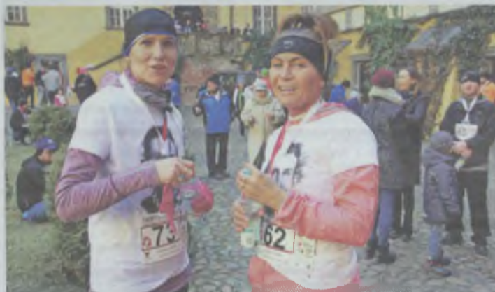
Tak było przed rokiem

Współorganizatorami są: Fundacja Wolność i Demokracja, Miasto Oleśnica, CKiW OHP w Oleśnicy. (ws)