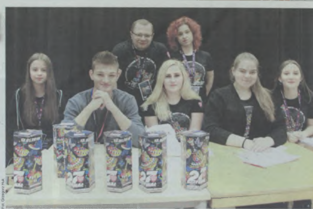
W niedzielny poranek oleśnicki sztab WOŚP-u rozpoczął wielogodzinny dyżur