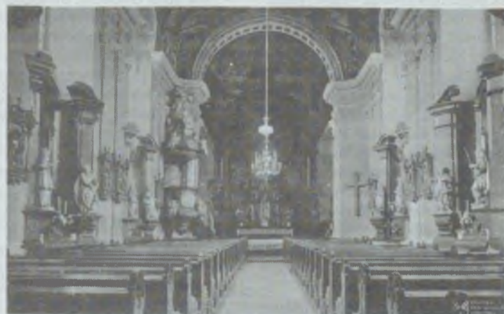
Stara pocztówka wywołuje wspomnienia