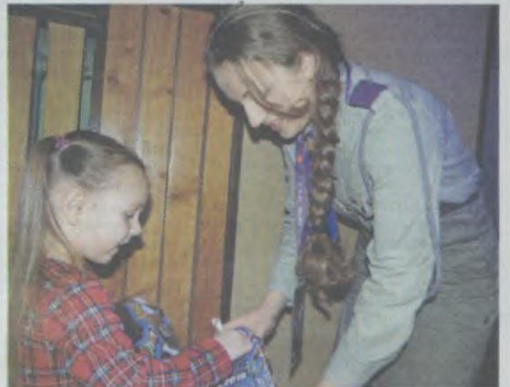
Grosik do grosika