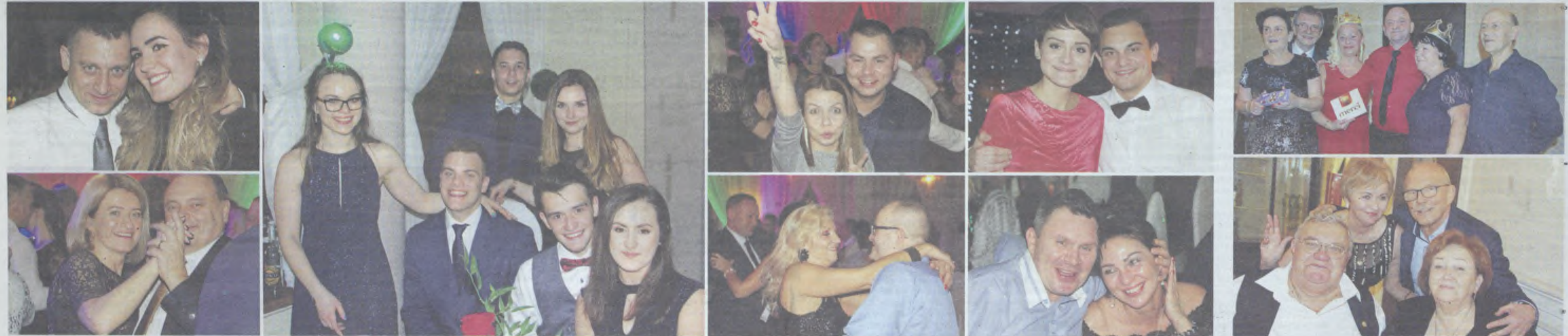
Wesoła zabawa w Perle