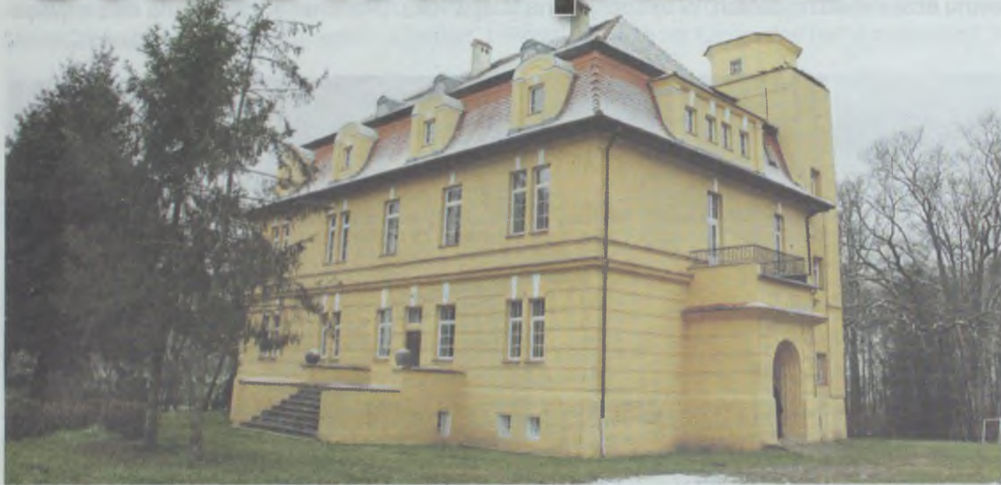
Tak się dzisiaj prezentuje pałac w Ligocinie Polskiej