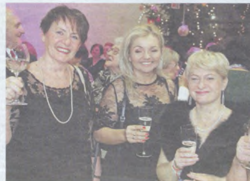
Wzniesmy toast za pomyślność oleśniczan