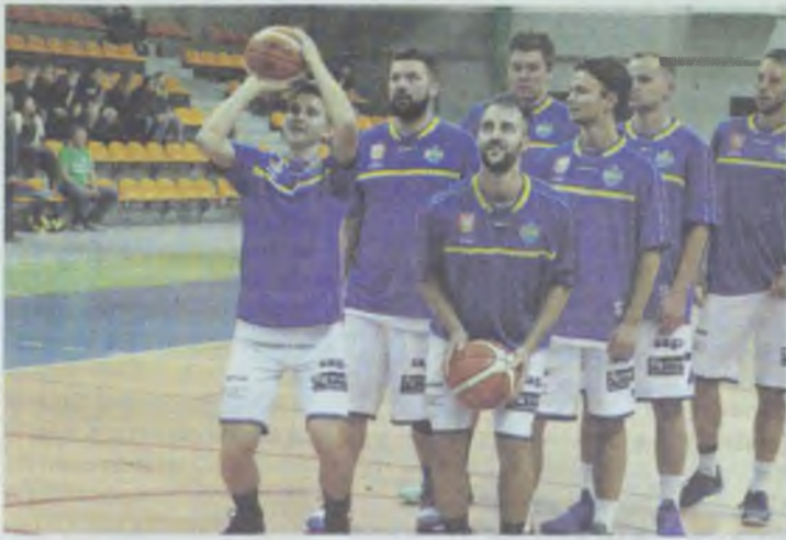
KKO wrócił na zwycięski szlak

Wygrali ją gospodarze i triumfowali w całym meczu z rezerwą I-ligowca.