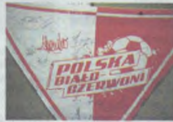
Ciekawych fantów nie zabraknie