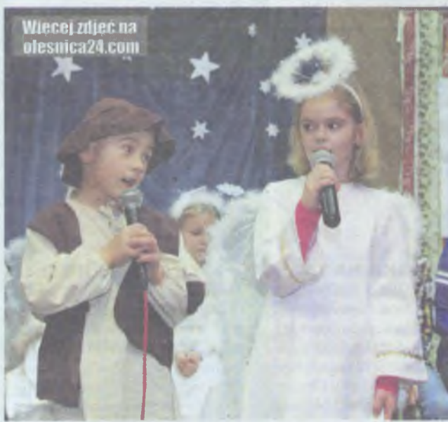
Mali aktorzy na scenie

ZBYTOWA. Wieczorki w Trzech Króli to w Zbytowej już tradycja.