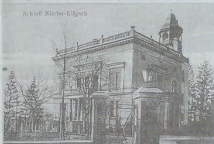
Tak pałac wyglądał przed przebudową w 1914 roku