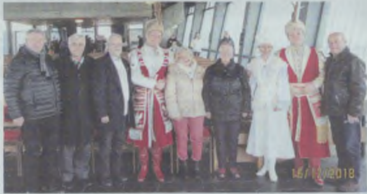
Kolędowanie z polskimi akcentami

Na zaproszenie stowarzyszenia Polaków w Niemczech przyjechała Orkiestra Koncertowa Zespołu Artystycznego Wojska Polskiego z Warszawy.