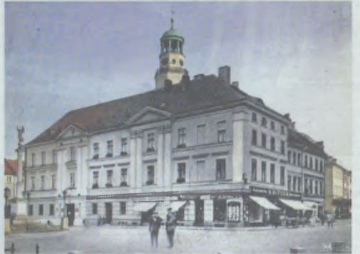
Dawniej i dziś - w jednym miejscu