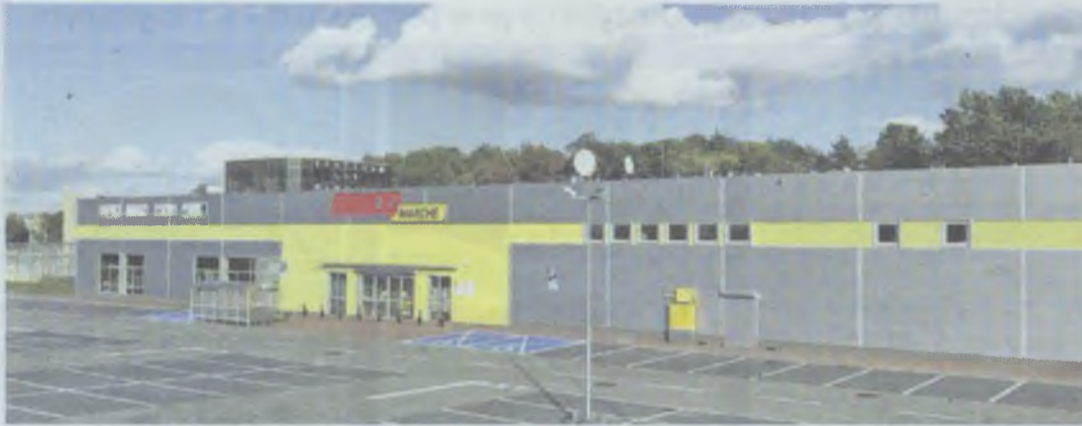
Jeśli powstanie, będzie groźnym konkurentem dla małych sklepów

Obiekt ma powstać w rejonie ulicy Dobroszyckiej (obok Stacji Uzdatniania Wody), niedaleko restauracji McDonald's. Z naszych informacji wynika, że działka została już sprzedana jednej z sieci handlowych. Powstanie na niej - budowa rozpocznie się prawdopodobnie w tym roku - market budowlany Grupy Muszkieterów.