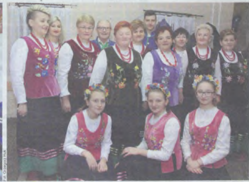
Gospodynie wieczoru - Zbytowianki