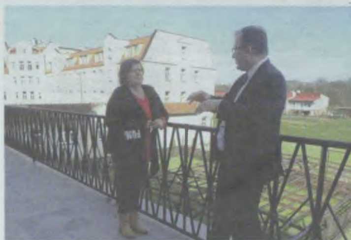
Rzecznik praw obywatelskich Adam Bodnar z wizytą w Ostrowinie

Dyrektor DPS-u mówiła też o problemie z pielęgniarzkami, który pojawił się w okresie świąt wielkanocnych 2018 roku. Pielęgniarki złożyły wówczas wypowiedzenia - z 26 zostało obecnie 6. Domagały się podwyżek na poziomie tych pracujących w szpitalu. Szpital oferował im wyższe wynagrodzenie, więc rezygnowały z pracy w DPS.