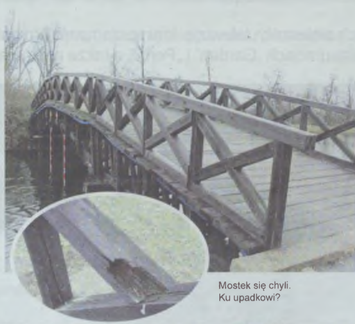
Mostek się chyli. Ku upadkowi?

To popularny szlak spacerowy oleśniczan i trzeba dmuchać na zimne.