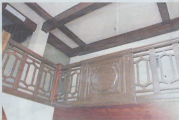
Zachował się oryginalny fragment klatki schodowej

Zbieg okoliczności sprawił, że historyczny obiekt ocalał i ma się całkiem dobrze.