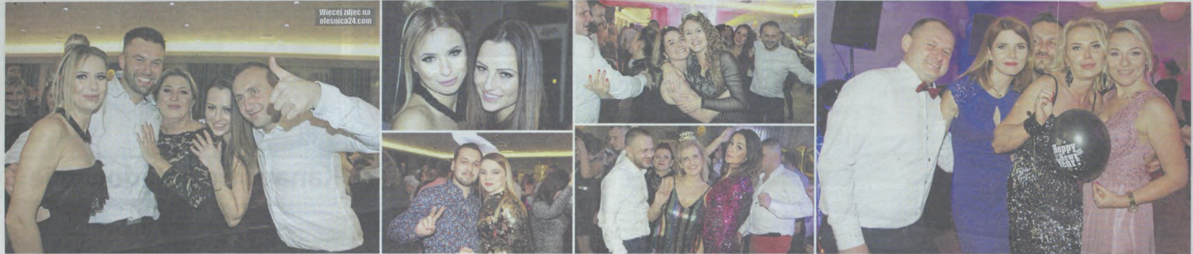
Sylwestrowe szaleństwa w Garden