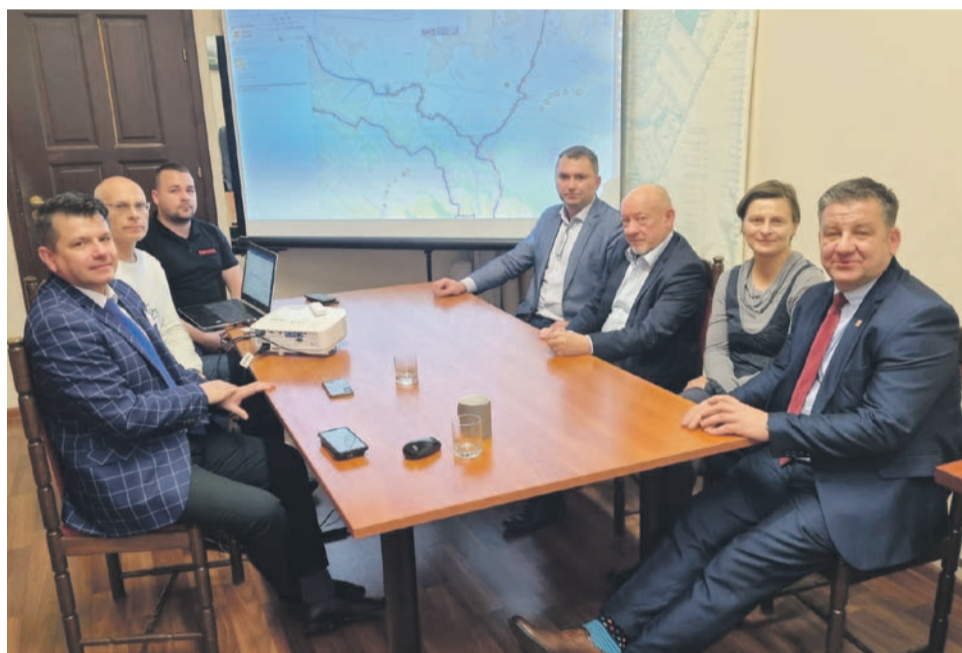
Jednym z tematów był remont drogi wojewódzkiej 455 z Jelcza-Laskowic do Oławy

W dniu 2.12.2022 r. odbyło się w Urzędzie Miasta i Gminy Jelcz-Laskowice spotkanie poświęcone omówieniu prac nad drogą rowerową, zwaną Dolnośląską Cyklostradą przebiegającą przez gminę Czernica, gminę Jelcz-Laskowice, gminę wiejską Oława i miasto Oława. Omawiano sposób rozpoczęcia projektowania i finansowania tej inwestycji. Ustalono, że w pierwszej kolejności zostanie zlecone wykonanie programu funkcjonalno-użytkowego. Dokumentacja ta pozwoli na aplikowanie o fundusze europejskie z Regionalnego Programu Operacyjnego na lata 2021 - 2027. Ze względu na to, że większa część tras prowadzona jest wzdłuż dróg wojewódzkich, niezbędnym jest włączenie się w proces projektowania i realizacji Dolnośląskiej Służby Dróg i Kolei. Omawiano również