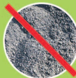
miałem i flotokonzentratem