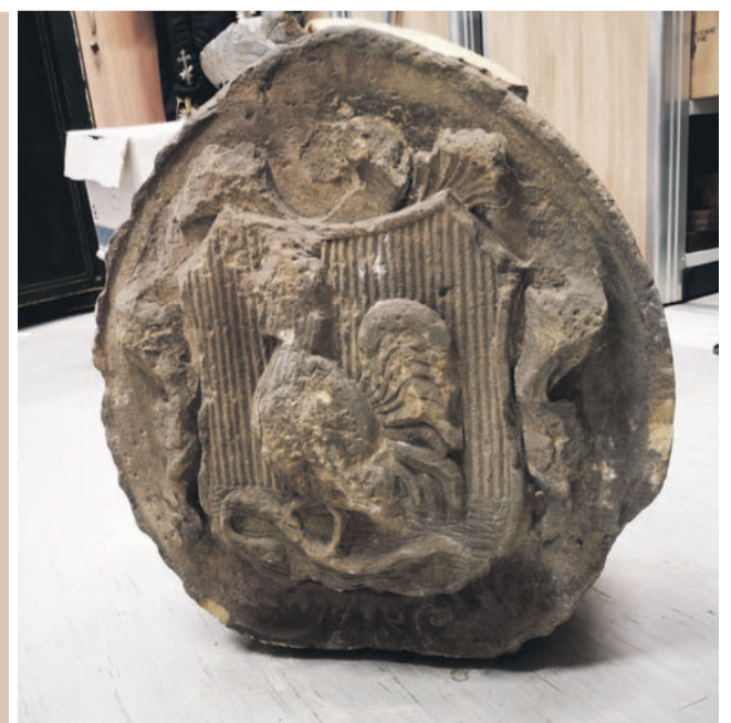
Są jeszcze gdzieś w Oławie podobne koguciki?