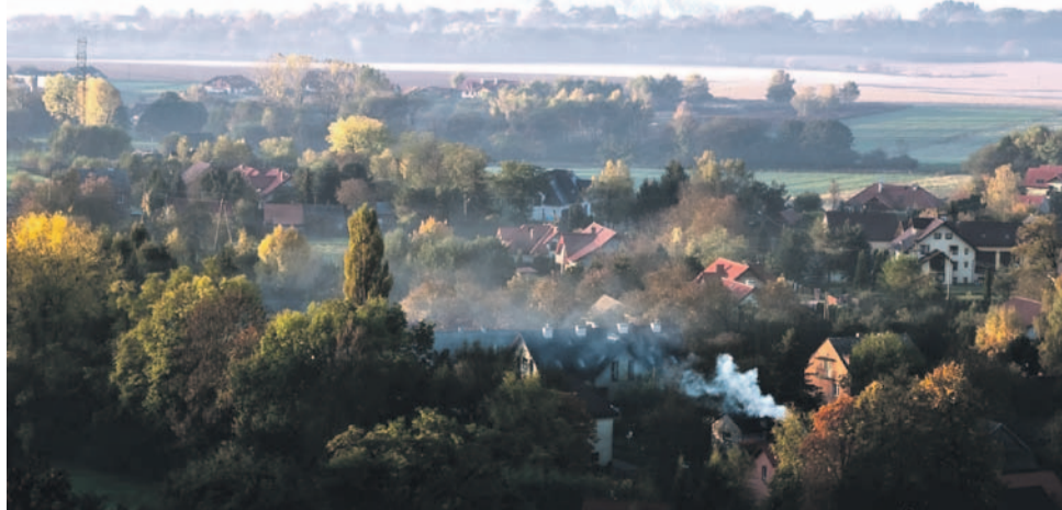
W okresie grzewczym wielu Dolnoślązaków zmagają się na co dzień z problemem smogu.