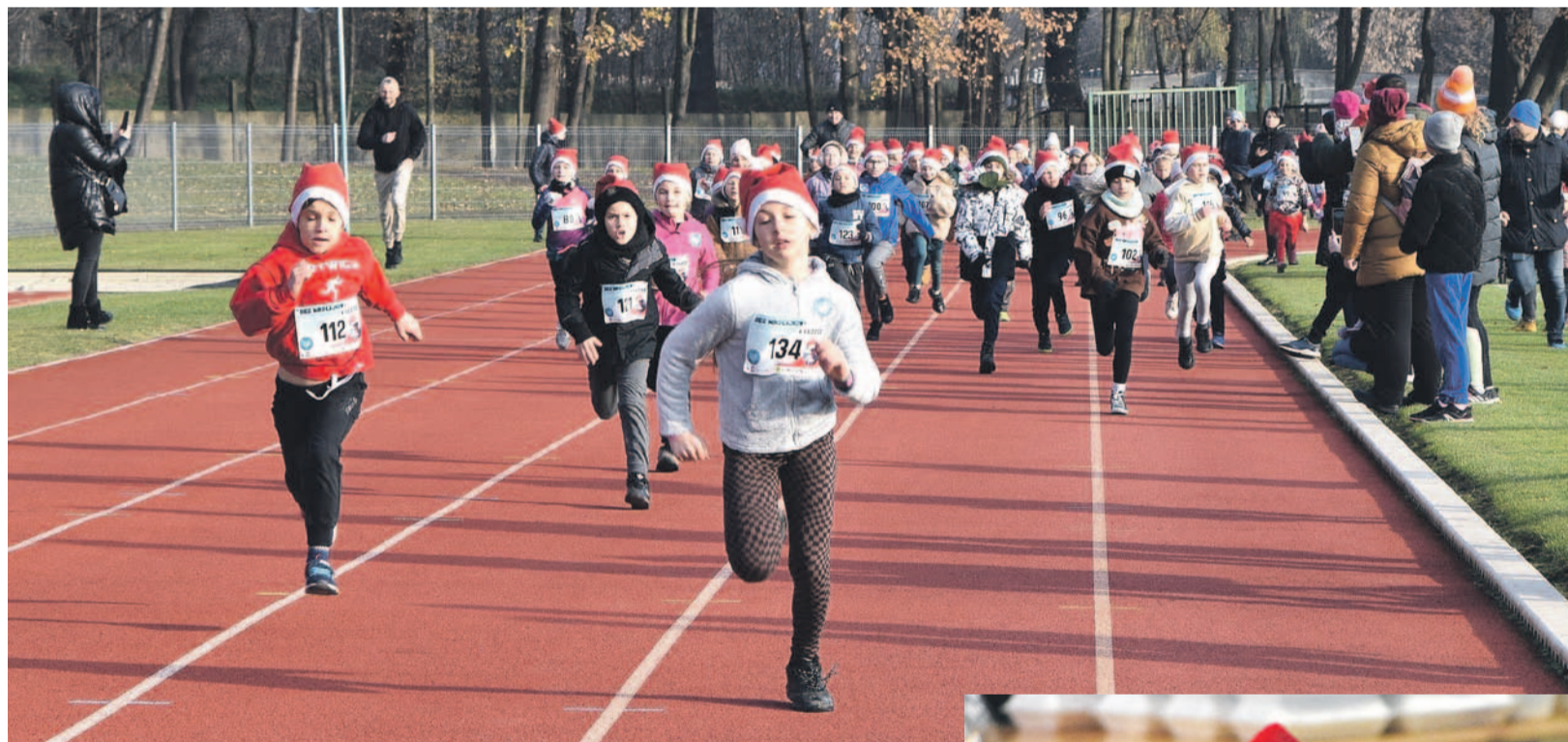
W sumie kilkuset młodych zawodników pokonało trasy na różnych dystansach