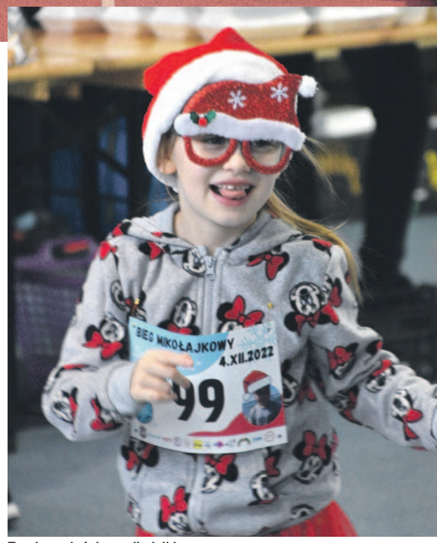
Trochę radości na mikołajki