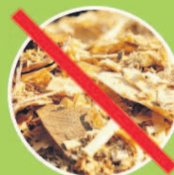
lakierowanym drewnem i płytą wiórową