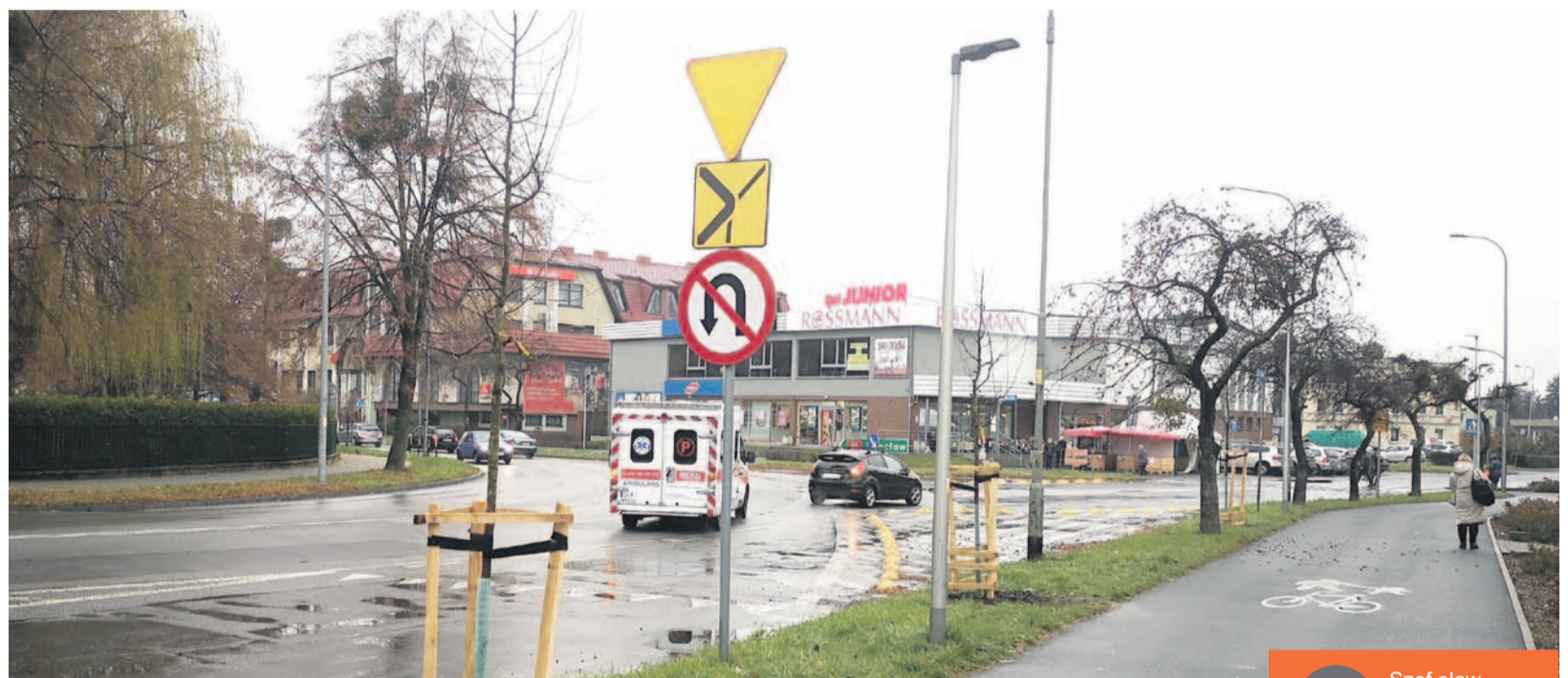
Konia z rzędem temu, kto jadąc od Sportowej przepuszcza auta wyjeżdżające z Żeromskiego, a tak byłoby prawidłowo. Kluczowe jest uznanie tego miejsca za jedno skrzyżowanie poprzez sposób jego oznakowania - od strony ulicy 3 Maja tabliczka T6a, a od strony Sportowej i Żeromskiego T6c

- Kierowcy muszą się tu kierować oznakowaniem, które