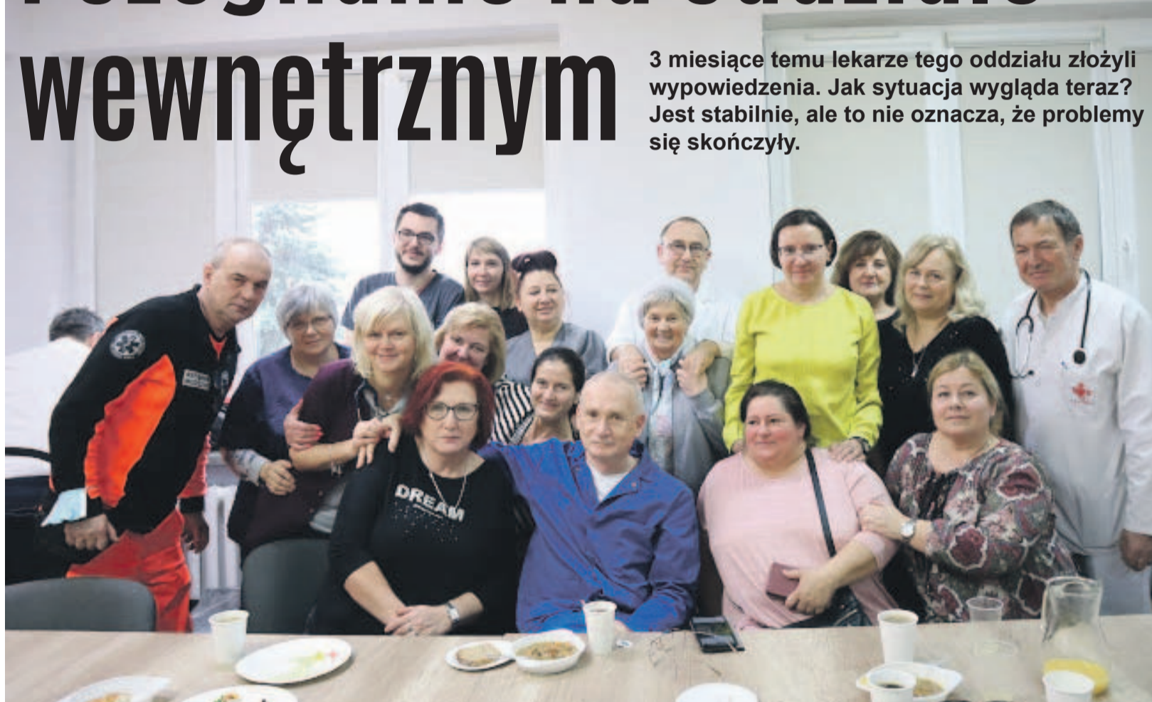
Personel pożegnał lekarzy, którzy przepracowali 30 lat!

3 miesiące temu lekarze tego oddziału złożyli wypowiedzenia. Jak sytuacja wygląda teraz? Jest stabilnie, ale to nie oznacza, że problemy się skończyły.