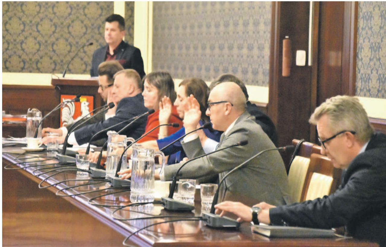
30 listopada oławscy radni głosowali nad propozycją podniesienia podatku od nieruchomości

źródeł, a nie z tego - stwierdził Pawłowicz. - Dobrze, że w pandemii burmistrz nie podnosił podatku, ale powinien jeszcze trochę przedłużyć ten okres zamrożenia. To moje zdanie i powiedziałem, jak będę głosował, a państwo zrobicie to, co wam sumienie dyktuje - dodał zwracając się do pozostałych radnych.