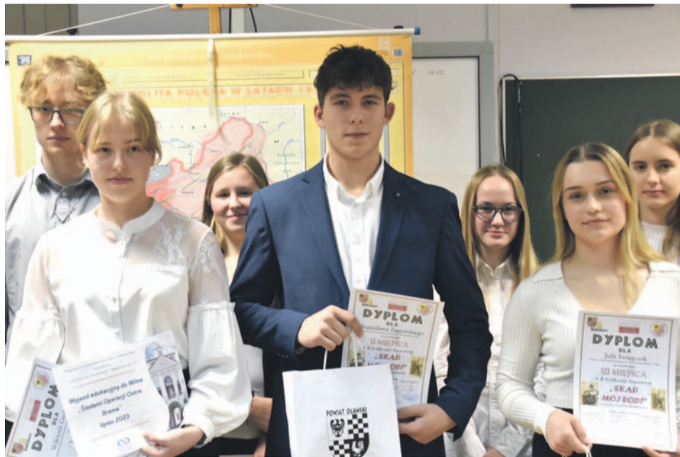
Na pierwszym planie zwycięzcy w kategorii szkół średnich. W tle wyróżnieni

- Gratuluję organizatorom konsekwencji, bo bardzo często jest tak, że są pomysły, które się próbuje realizować,