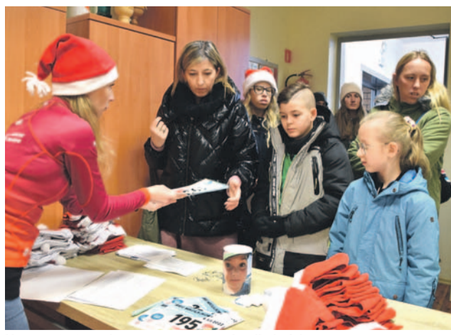
Numer startowy i czerwona czapeczka dla każdego