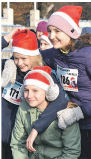
Dobrze spędzony czas. Ruch na świeżym powietrzu i pomaganie w jednym

Na biegi, na teatrzyk, po pierogi, na spotkanie z Migotką, po pyszne ciasta, na spotkanie z Mikołajem i na inne atrakcje. Po to przyszli tego dnia na oławski stadion i do hali rodzice z dziećmi. Przy okazji wrzucali pieniądze do puszek.