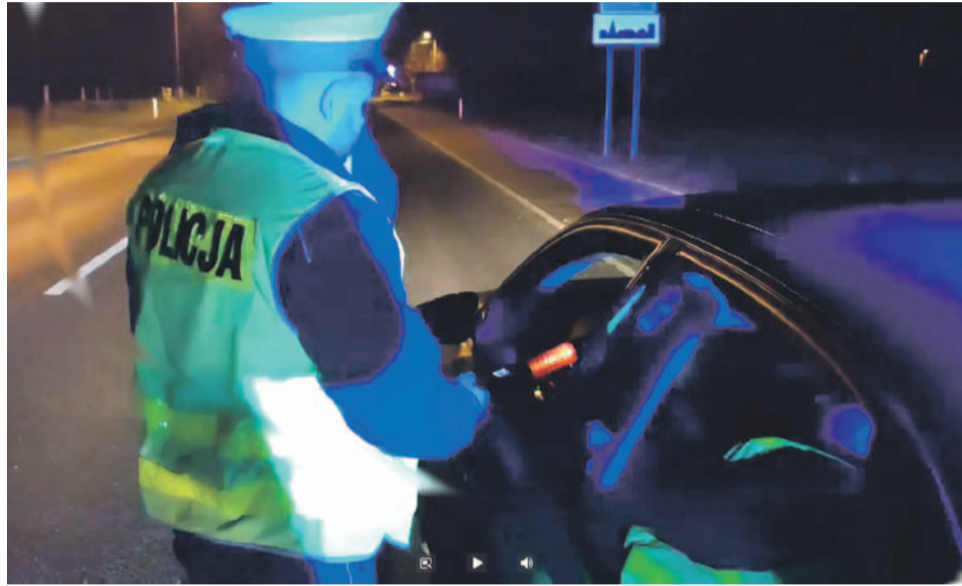
Tylko od stycznia do grudnia tego roku oławska policja zatrzymała 457 osób, które kierowały w stanie nietrzeźwości lub będąc po użyciu alkoholu

5 grudnia w ramach wojewódzkich działań „Trzeźwy poranek”, około godz. 6:20 w miejscowości Janików mundurowi z oławskiej drogówki zatrzymali 42-letniego mężczyznę, który kierował samochodem osobowym marki VW