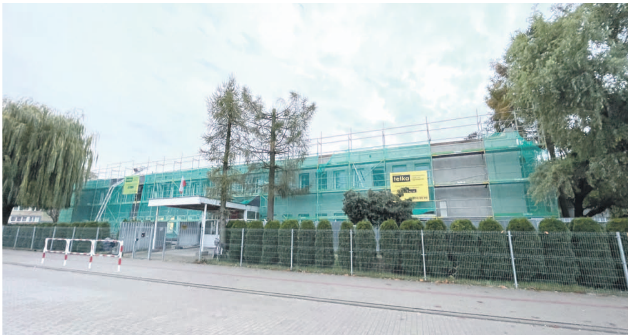
Trwający remont dotyczy już tylko prac na zewnątrz budynku. Dzieci mogły więc wrócić do przedszkola