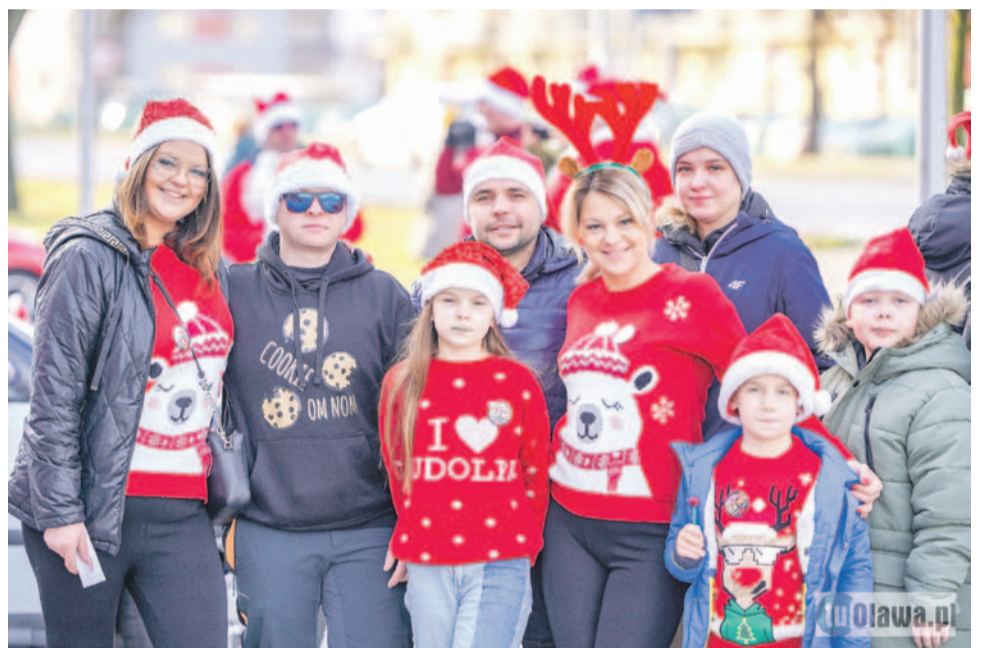
Było radośnie i świątecznie!