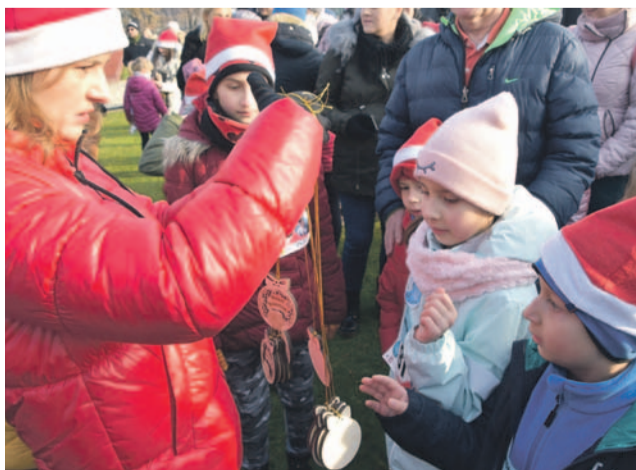
Był bieg, będą medale