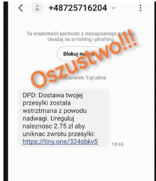
Tak wyglądają wiadomości od oszustów. Nie chcesz mieć problemów, zignoruj taki SMS