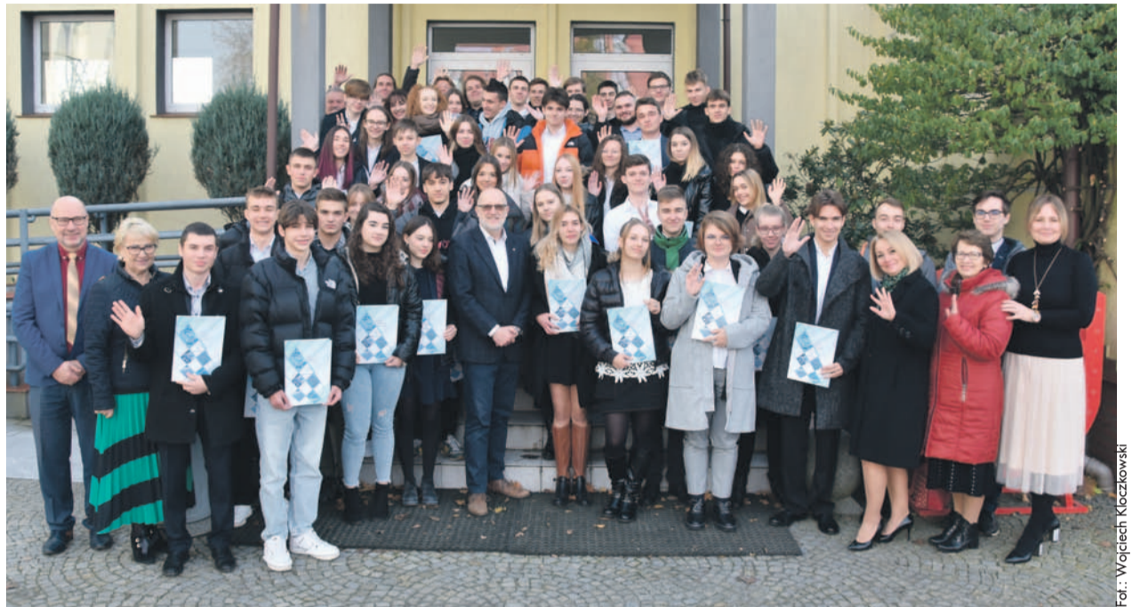
Uczestnicy uroczystości wręczenia stypendiów uczniom ze szkół średnich