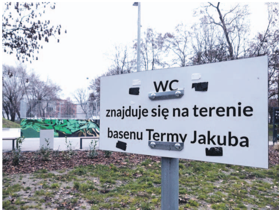
Tabliczka informująca o tym, że toaleta jest dostępna w Tarmach Jakuba, wciąż stoi przy skateparku i wprowadza w błąd

su toaleta jest zamknięta, a alternatywy nie ma. Burmistrz na sesji przyznał, że rzeczywiście jest problem z dostępnością toalet i miasto szuka rozwiązania tego problemu. Radni, którzy zainicjowali dyskusję w tej sprawie, sugerowali, że skoro jest problem i toalety są niedostępne, to należałoby przynajmniej zabrać tabliczki wprowadzające w błąd, ale te wciąż stoją.