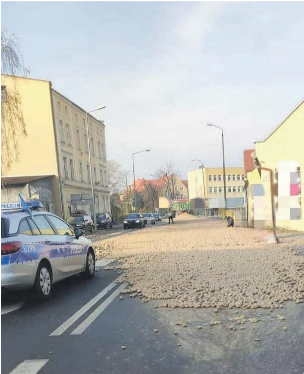
60-latek dostał mandat za niewłaściwe zabezpieczenie ładunku. Odpowie też za jazdę po alkoholu