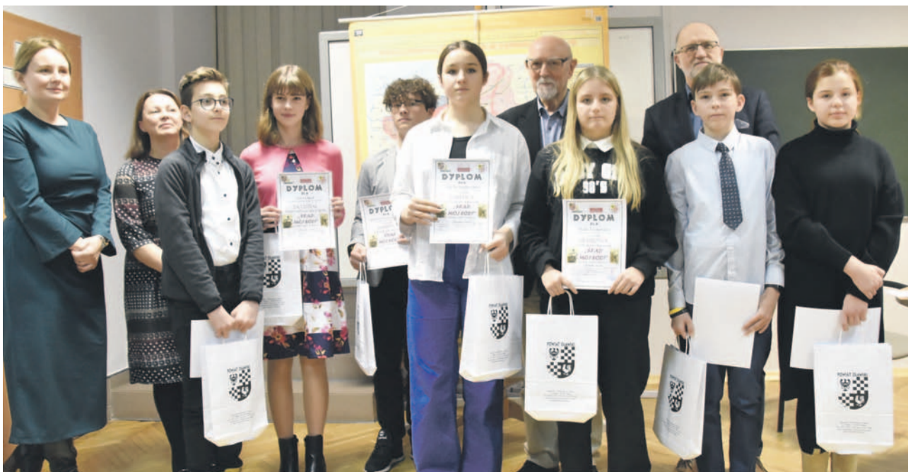
Najlepsi i wyróżnieni ze szkół podstawowych. Wraz z nimi osoby pomagające w organizacji wydarzenia