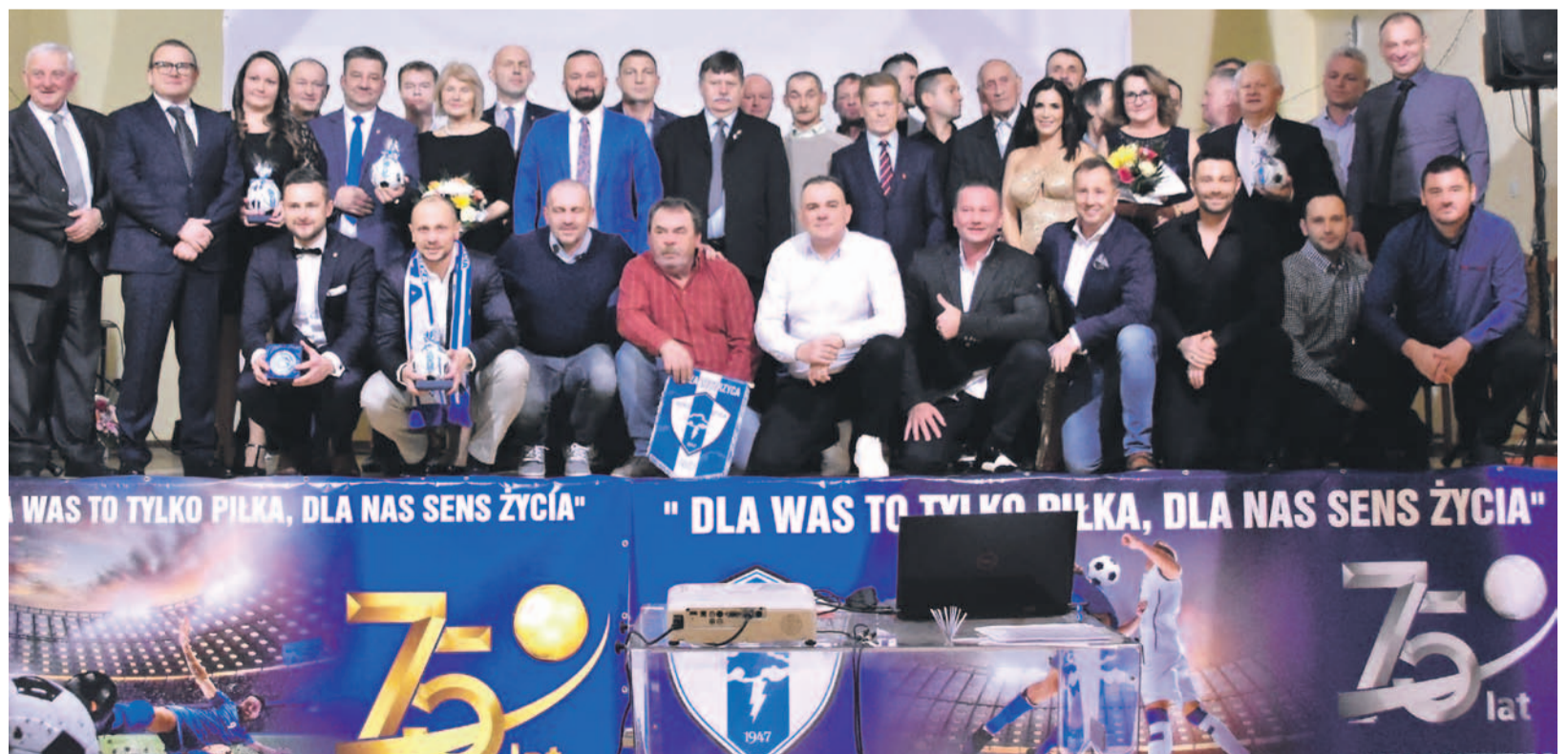
Zasłużeni dla "Burzy"