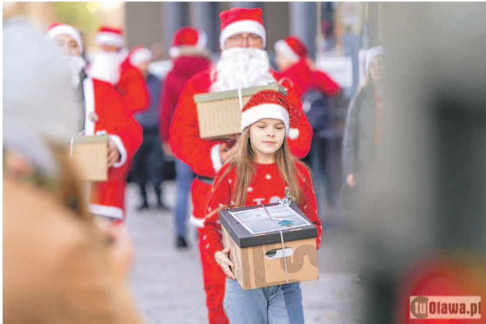
Paczki zapakowano do wojskowego jelcza