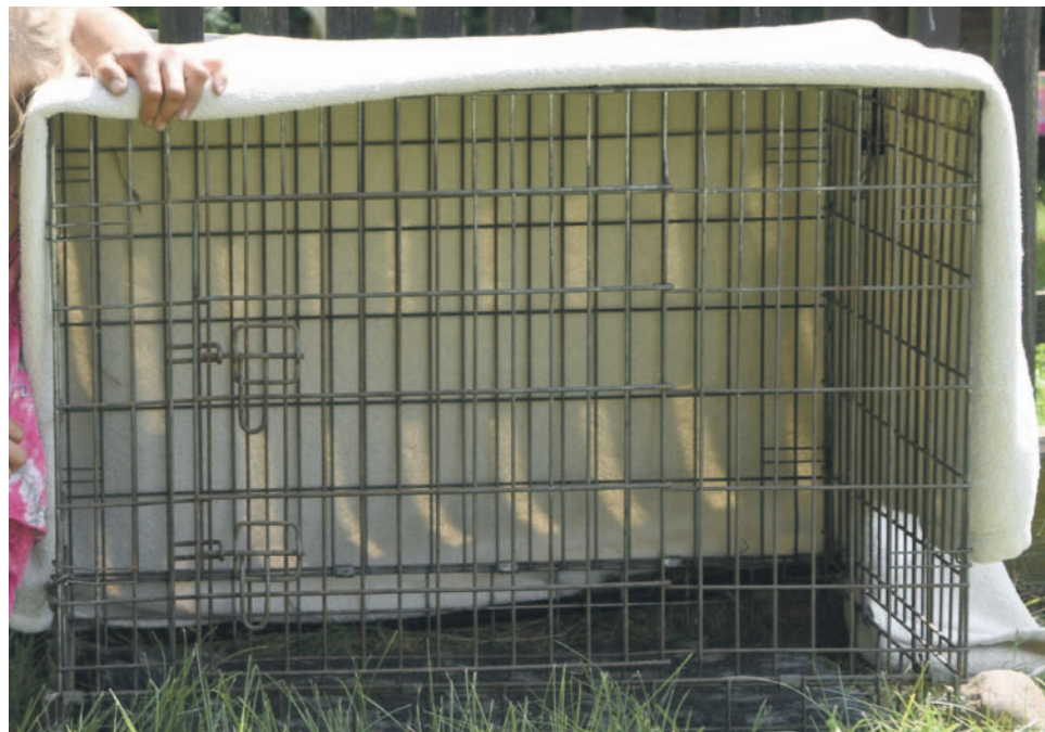
Ta klatka stała przed jednym z domów w Miłocicach. Już jej nie ma, okno życia dla zwierząt nie funkcjonuje