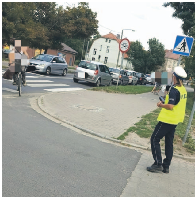
Po pasach... Wprost do policjantki.

Funkcjonariusze drogówki kontrolowali zachowania na ścieżkach rowerowych, przestrzeganie przepisów oraz znaków drogowych, a także zachowanie rowerzystów względem pieszych. Podczas kontroli wyłapano 40 wykroczeń, m.in. przejeżdżanie