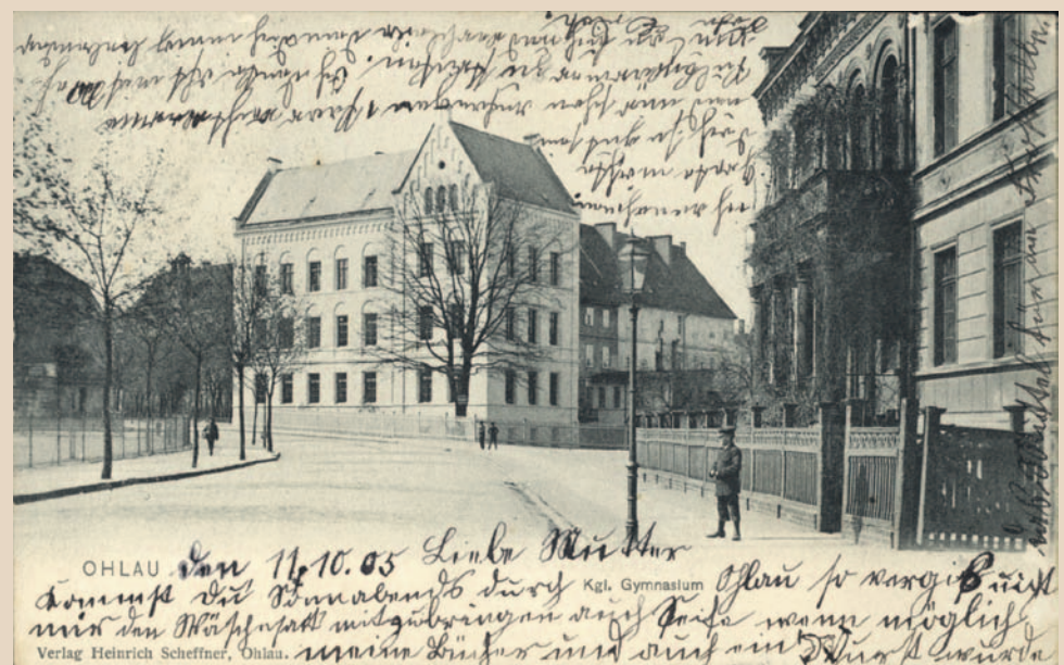
Przedwojenna widokówka z 1905 roku, na wprost pierwotny budynek Liceum Ogólnokształcącego, jeszcze przed przebudową, po prawej budynek, w którym jest dziś Urząd Gminy. Po lewej widzimy ogrodzony plac, na którym wówczas było boisko piłkarskie - na wprost szeroka droga. Dziś jest w tym miejscu chodnik