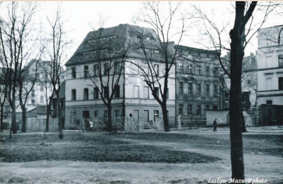
To zdjęcie zrobiłem w 1969 roku - przedstawia nieistniejące już dziś budynki przy ul. Głowackiego - w głębi po lewej obecna siedziba Policji, a po prawej budynek, w którym od Rynku był Wiejski Dom Towarowy, a później Bank PKO, dziś stoi pusty. Na placu na pierwszym planie był ogródek jordanowski