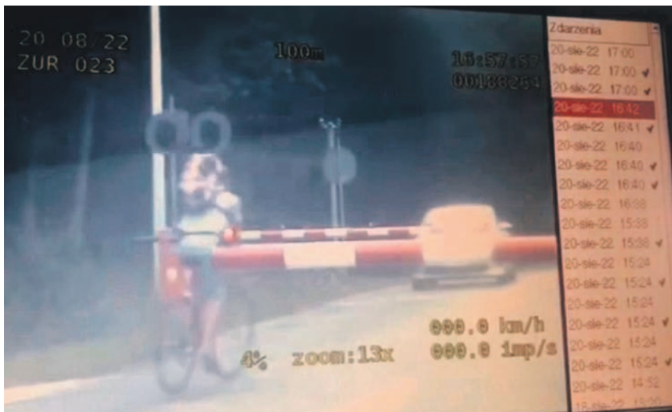
Jak na dłoni widać, co zrobił rowerzysta. Stracił przez to spore pieniądze, na szczęście nic cenniejszego...