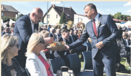
W ubiegłym roku Domaniów organizował dożynki wojewódzkie