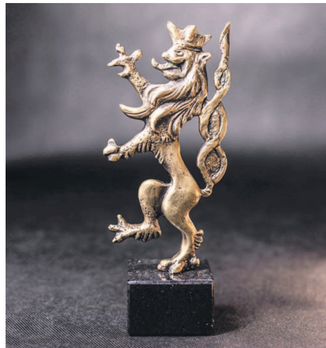
Tak prezentuje się statuetka

Wielopokoleniowe Centrum Rozwoju - jest prężnie funkcjonującym ośrodkiem kultury, sportu i miejscem spotkań, dzięki niemu mieszkańcy Miłocic i okolicznych wsi mieli okazję: brać udział w warsztatach filmowych, wytwarzać naturalne kosmetyki