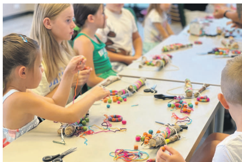
„EtnoWakacje” trzeba zaliczyć do udanych