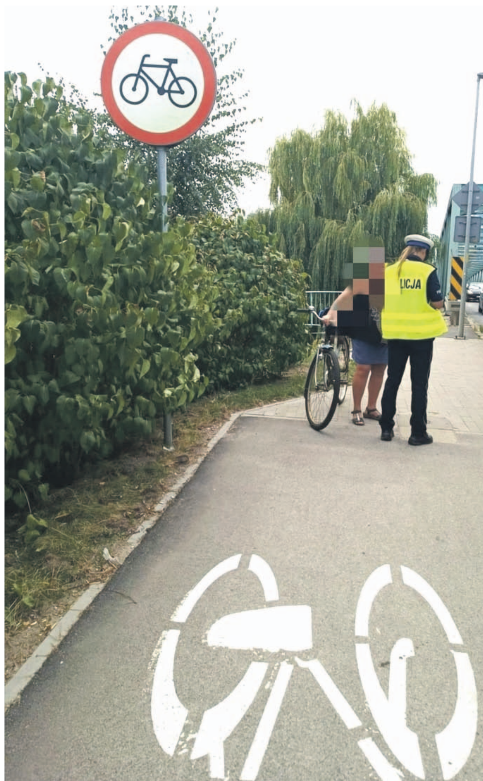
Nie można jechać na moście po chodniku. To miejsce dla pieszych