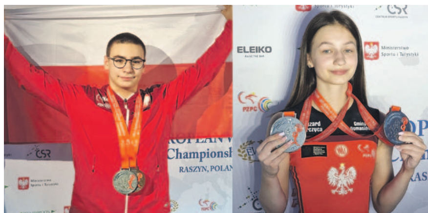
fol. LKS Polwica Wierzbno