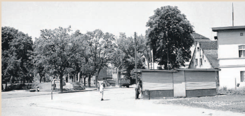
To zdjęcie zrobiłem w 1969 roku, stojąc na ówczesnej ulicy Piotra Własta. Wtedy to był plac, na którym funkcjonował przystanek autobusowy. Dziś po lewej jest Pomnik Losów Ojczyzny. Po prawej widzimy kiosk spożywczy, prowadzony przez WSS Społem. W budynku za kioskiem po prawej była kasa biletowa do autobusów. Na wprost wejście do schronu, dziś zasypane. Za schronem był ogródek jordanowski