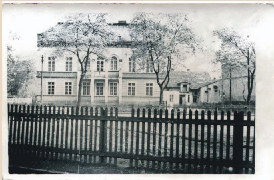
Z albumu Romana Witkowskiego. 1958 rok. Widać budynek, w którym dziś jest Urząd Gminy, po lewej betonowe ogrodzenie placu, na którym był Targ Miejski. Po prawej nieistniejące zabudowania, na pierwszym planie drewniany płot, którym był ogrodzony ogródek