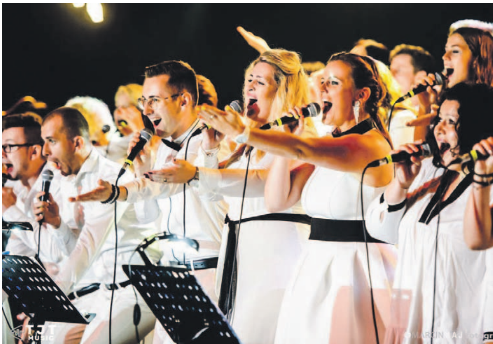
Chór gospel wystąpi w Jelczu-Laskowicach