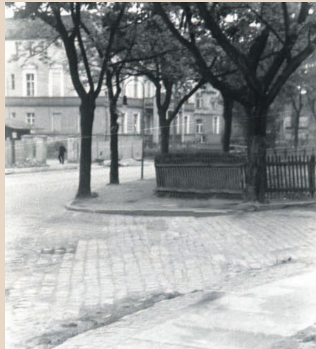
Z albumu Andrzeja Dobruckiego. 1965 rok. Zdjęcie przedstawia ówczesny pl. Jedności Narodowej. Fotografia jest zrobiona od pl. Zamkowego, po lewej jest budynek Liceum (niewidoczny) na wprost ogrodzenie ogródka jordanowskiego. Po prawej widzimy początek ulicy, która biegła do ulicy Kopernika - dziś jest tu chodnik. Po lewej betonowe ogrodzenie Targu Miejskiego, a przed nim nieistniejąca już ulica - dziś w tym miejscu jest chodnik