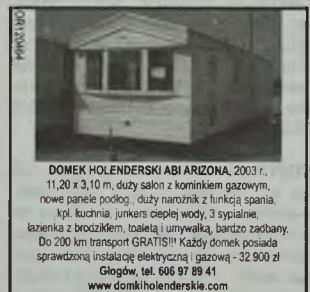
DOMEK HOLENDERSKI ABI ARIZONA, 2003 r., 11,20 x 3,10 m, duży salon z kominkiem gazowym, nowe panele podłog, duży narożnik z funkcją spania, kpl. kuchnia, jankers ciepłej wody, 3 spaliniaki, łazienka z brooklifem, toaleta i umywalką, bardzo zadbane. Do 200 km transport GRATIS! Każdy domek posiada sprawdzoną instalację elektryczną i gazową - 32.900 zł. Głogów, tel. 606 97 88 41 www.domkiholenderskie.com

PRZYCZEPA KEMPINGOWA MUNSTERLAND , 1980 r., 1-osioową, sprzedawana, bez prawa rejestracji, dł. 4m + dysel, idealna na działkę lub budowę - 1.300 zł. Skokowa, powiat trzebnicki, tel. 692/20-04-11 JG0463655