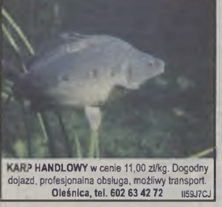
KARP HANDLOWY w cenie 11,00 zł/kg. Dogodny dojazd, profesjonalna obsługa, możliwy transport. Oleśnica, tel. 602 63 42 72 IIS9J7CJ

ALFA ROMEO 156 , 2000 r., 155 tys. km, 2000 ccm, benz., wiśniowy met., RO, c. zamek, wspom. kierownicy, ABS, alufelgi, klimat., zarejstr. - 3.700 zł. Kalisz, tel. 796/78-89-04 JG0335595