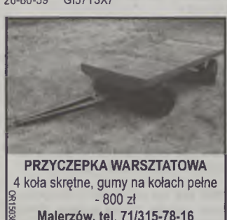
PRZYRZĄD WARSZTATOWY 4 koła skrętne, gumy na kołach pełne - 800 zł Malerzów, tel. 71/315-78-16

PRZYCZEPA BAGAŻOWA SAM , nowa, na resorach, koła 13", wym. 2.10x1.30 m, bez prawa rejestracji - 1.050 zł. Wieluń, tel. 721/26-80-59 G157T3X7