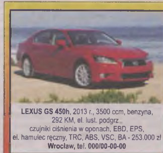
LEXUS GS 450h , 2013 r., 3500 ccm, benzyna, 292 KM, el. lust. podgrz. czujniki ciśnienia w oponach, EBD, EPS, el. hamulec ręczny, TRC, ABS, VSC, BA - 253.000 zł Wrocław, tel. 000/00-00-00