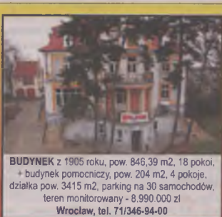
BUDYNEK z 1905 roku, pow. 846,39 m 2 , 18 pokoi, + budynek pomocniczy, pow. 204 m 2 , 4 pokoje, działka pow. 3415 m 2 , parking na 30 samochodów, teren monitorowany - 8.990.000 zł Wrocław, tel. 71/346-94-00