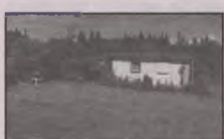
DZIAŁKA BUDOWLANA , pow. 750 m 2 , zabudowa typu kempingowego, gotowa do sezonowego zamieszkania oraz dalszego zagospodarowania, media (woda, energia el., gaz butlowy), w miejscowości Karłów 20a, gm. Radków, bez pośredników tel. 691 828 037 OR150251

DZIAŁKA BUDOWLANA , pow. 1277 m 2 , w Strzegomiu ul. Jagodowa, cicha, zielona okolica, w sąsiedztwie nowych domów - 100 zł/m 2 do neg. Strzegom, powiat świdnicki, tel. 509/11-51-62 G1593K3C