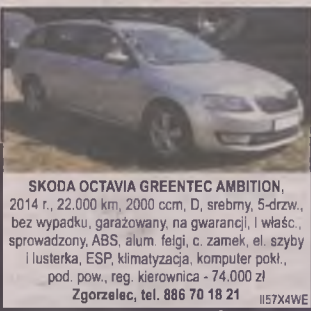
SKODA OCTAVIA GREENTEC AMBITION , 2014 r., 22.000 km, 2000 ccm, D, srebrny, 5-drzw., bez wypadku, garażowany, na gwarancji, i właśc., sprawdzony, ABS, alum. felgi, c. zamek, el. szyby i lusterka, ESP, klimatyzacja, komputer pokł., pod. pow., reg. kierownica - 74.000 zł Zgorzelec, tel. 886 70 18 21 II57X4WE

ALFA ROMEO 156 KOMBI , 2005 r., 1900 ccm, JTD, srebrny, pełne wyposaż., oprócz skórzanej tap. - 9.900 zł. Bolesławiec, tel. 793/39-65-80 GI57WTNM