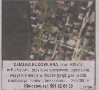
DZIAŁKA BUDOWLANA , pow. 900 m 2 , w Kielczie, przy lesie sosnowym, ogrodzona, wszystkie media w drodze (prąd, gaz, woda, kanalizacja, telefon), bez pośredn. - 225.000 zł Kielce, tel. 501 62 81 39 II57X79M

AUDI A4 SEDAN , 1997 r., 1900 ccm, turbo D, stan db, ważne OC i przegląd - 4.600 zł. Dzierżoniów, tel. 530/21-08-49 GI57RXJ9