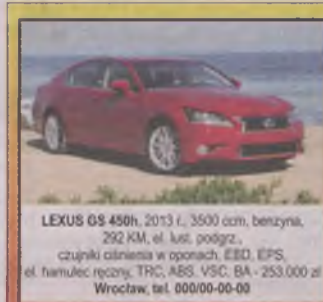
LEXUS GS 450h , 2013 r., 3500 ccm, benzyna, 292 KM, el. lust. podgrz., czujniki ciśnienia w oponach, EBD, EPS, el. hamulec ręczny, TRC, ABS, VSC, BA - 253.000 zł Wrocław, tel. 000/00-00-00

FOTO ALFA ROMEO GTV , 1997 r., 182 tys. km, 2000 ccm, 155 KM, czarny, zarejestr., alum. felgi, c. zamek, el. otw. szyby, el. reg. lusterka, pod. pow., RO, tap. skórzana, wspom. kier. - 5.900 zł. Wrocław, tel. 732/96-27-92 II57XA7P