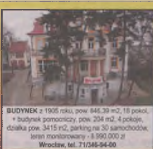
BUDYNEK z 1905 roku, pow. 846,39 m 2 , 18 pokoi, * budynek pomocniczy, pow. 204 m 2 , 4 pokoje, działka pow. 3415 m 2 , parking na 30 samochodów, teren monitorowany - 8.990.000 zł Wrocław, tel. 71/346-94-00