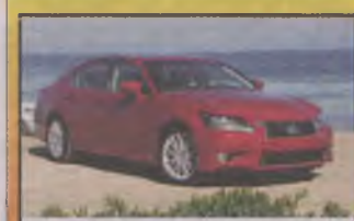
LEXUS GS 450h , 2013 r., 3500 ccm, benzyna, 292 KM, el. lust. podgrz., czujniki ciśnienia w oponach, EBD, EPS, el. hamulec ręczny, TRC, ABS, VSC, BA - 253.000 zł Wrocław, tel. 000/00-00-00

ALFA ROMEO 146 , 1995 r., 270 tys. km, bordowy met., z salonu, I właśc., el. szyby, alufelgi, kpl. kół zim. - 1.800 zł. Nowa Wieś Goszczańska, powiat oleśnicki, tel. 605/66-00-94 G1574ATA