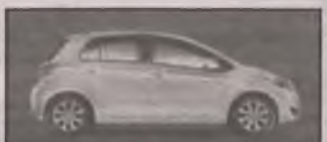
FOTO VW GOLF , 1992/13 r., może być do popr. blach., może być do popr. lakiern., może być na zach. tablicach, stan techn. obojętny, w rozsądnej cenie, zarejestrowany, kupię każdego VW Gofla. Wrocław, tel. 733/35-35-36 I1574NF7

VW GOLF III , 1996/97 r., 5-drzwiowy, poj. 1.9 TDI, może być uszkodzony silnik lub skrzynia bieg. Marciszów, powiat kamiennogórski, tel. 790/72-47-99 G15LPF3