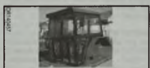
FOTO KOMBAJN ZBOŻOWY CLAAS MEGA 208 , 1995/18 r., silnik Mercedes, 235 KM, heder 6 m, stół do rzepaku, 3218 mtg, 3d, auto-contour, klimatyzacja, sprowadzony z Niemiec, stan bardzo dobry, VAT od faktury, możliwa zamiana na inny sprzęt rolniczy - 29.000 EUR. Kudowa-Zdrój, tel. 602/69-90-51 I15XRTF

KABINY DO RÓŻNYCH TYPÓW CIĄGNIKÓW C-330, C-360; T-25, MF-235, MF-255, Bizon i inne, nowe, solidnie wykonane, ramy z profila, w skład kabiny wchodzi: kpl. moców, lapy + śruby, lusterka, tylna kurtynka, blachy na podłogę, wyposażenie: uchylny dach, uchylna tylna szyba, 2x drzwi zamykane na kluczyk, tapicerowany dach i błotniki, oraz za dopłatą: tylny błotnik, oświetlenie (7 lamp), wywierzaczka (silniczek + ramionko + piero), wysoki dach, dostępne kolory: czerwony, żółty, zielony - cena od 1.900 zł, możl. transportu na terenie całego kraju woj. lubelskie, tel. 518 034 911, 604 613 229</