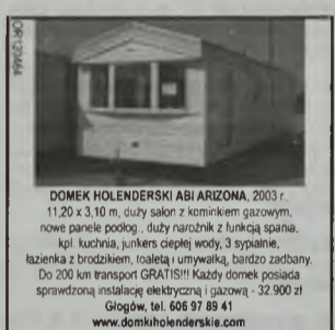
DOMEK HOLENDERSKI ABI ARIZONA, 2003 r., 11,20 x 3,10 m, duży salon z kominkiem gazowym, nowe panele podłog., duży narożnik z funkcją spania, kpl. kuchnia, jankers ciepłej wody, 3 sypialnie, łazienka z brodzikiem, toaletą umywalką, bardzo zadbane. Do 200 km transport GRATIS!!! Każdy domek posiada sprawdzoną instalację elektryczną i gazową - 32.900 zł Głogów, tel. 606 97 89 41 www.domkihollanderskie.com

PRZYCZEPA KEMPINGOWA, 1980 r., 1-osiowa - 5.500 zł. Wrocław, tel. 508/12-11-47 G15CEKW