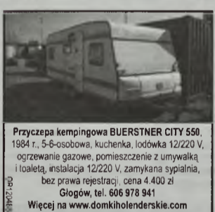
Przyczepa kempingowa BUESTERNER CITY 550, 1984 r., 5-6-osobowa, kuchenka, lodówka 12/220 V, ogrzewanie gazowe, pomieszczenie z umywalką i toaletą, instalacja 12/220 V, zamknięta sypialnia, bez prawa rejestracji, cena 4.400 zł Głogów, tel. 606 97 89 41 Więcej na www.domkihollanderskie.com

FOTO PRZYCZEPA KEMPINGOWA NIEWIADÓW N-126, 1988 r., 3-osobowa, zarejestrowana bezterminowo, oplandekowana, waga DMC 460 kg, szyby uchylne, umebłowana, kuchenka gazowa + butla, inst. elektryczna 230/12V, hamulec najazdowy, po wymianie tapicerki na ściankach - 2.900 zł. Wrocław, tel. 798/65-12-60 I15XXEE