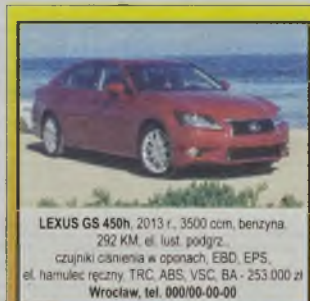
LEXUS GS 450h , 2013 r., 3500 ccm, benzyna, 292 KM, el. lust. podgrz., czujniki ciśnienia w oponach, EBD, EPS, el. hamulec ręczny, TRC, ABS, VSC, BA - 253.000 zł Wrocław, tel. 000/00-00-00

AUDI 80 B2 , 1983 r., 1600 ccm, benz., inst. gazowa - 2.900 zł. Oleśnica, tel. 71/793-35-09, 601/41-23-29 G14ELHR3