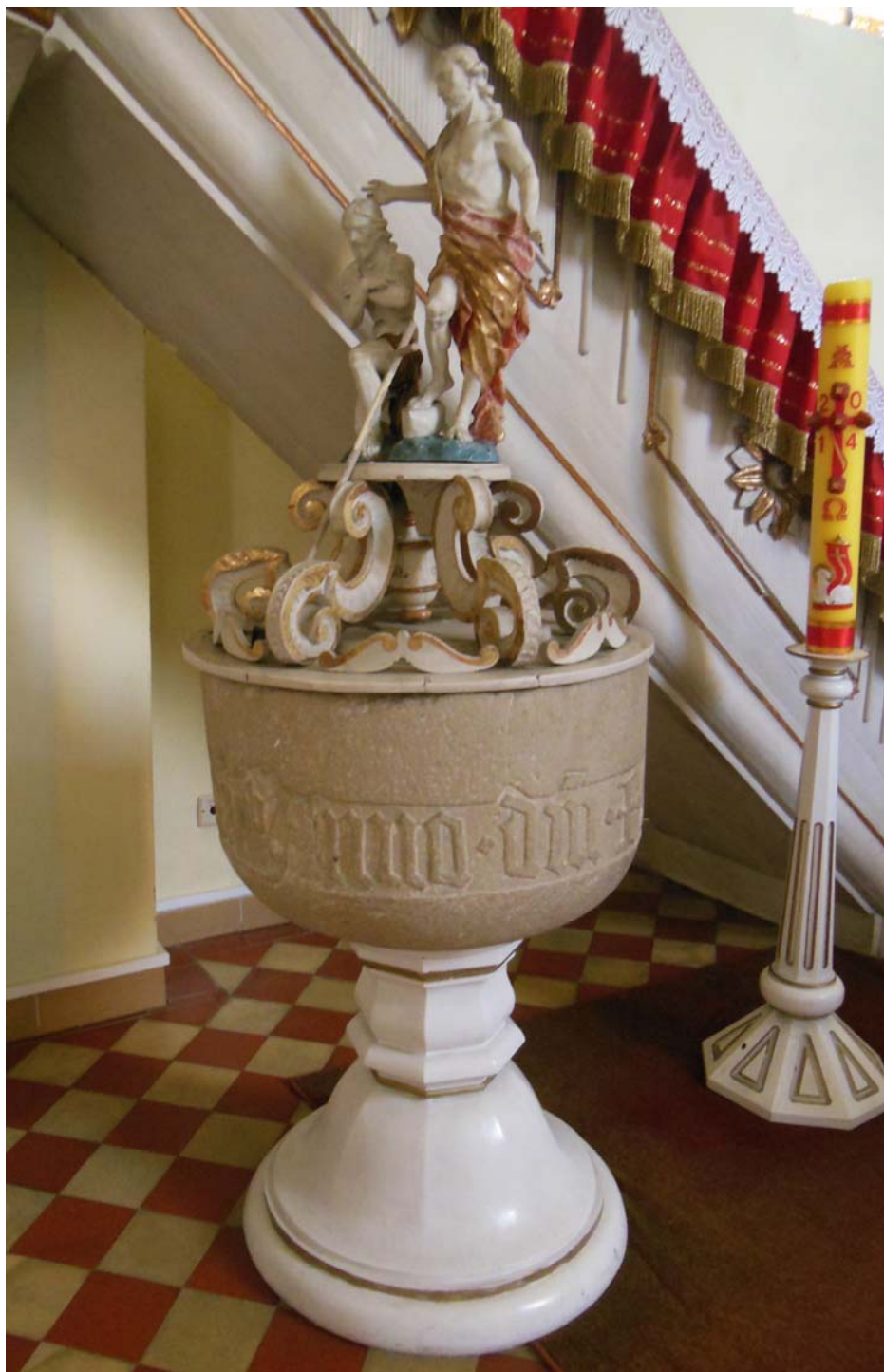
Chrzcielnica w kościele katolickim p.w. Trójcy Świętej w Podgórzynie