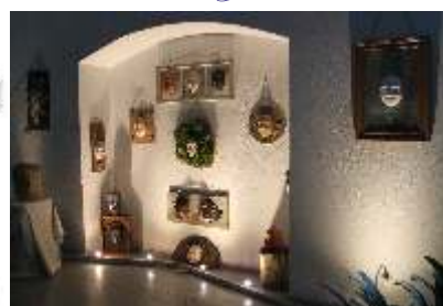
Prace artystów po zakończeniu wystawy będą udostępnione w Galerii Koźia Szyja w Kopańcu