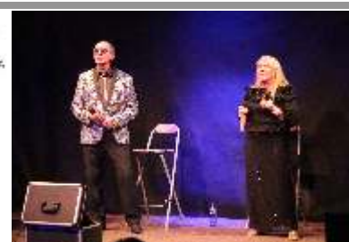
Podczas koncertu Duet Cantante rozspiewał publiczność. Już w listopadzie ponownie będziemy gościć duet w Kromnowie.