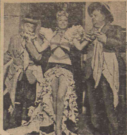
Flip, Flap i... gwiazdka

Koledy śmieją się z Vargi twierdząc, że doszedł do ideału drogą zbrodni poćwiartowania pięknych modelek.