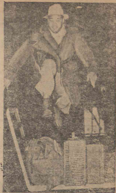
Oto jak Joe Louis, bokserski mistrz świata wszech wag, 6woicy się, aby zachować sprawność swych nóg

Posiadając własności podobne do fal radiowych, są one naładowane energią elektryczną i przebijają się przez orbitę naszej planety. Istnieje również przypuszczenie, że promienie kosmiczne mogą być jedną z przyczyn raka.