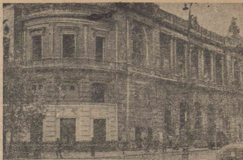
Filharmonia Warszawska w odbudowie.

AUTOCHTONKE do posług domowych przyjmie. Zgłoszenia: Świerczewskiego 98 m. 1. 10796