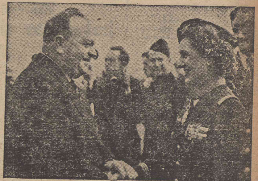
Maroselli, francuski minister lotnictwa ściska dłoń Maryse Bastie, kapitan armii powietrznej, jednej z kobiet, posiadających największą liczbę odznaczeń cywilnych i wojskowych, która ostatnio uzyskała odznaczenie komandora Legii Honorowej.

Geibel został odstawiony do więzienia mokołowskiego przy ul. Rakowieckiej, gdzie oczekiwać będzie procesu. Zbrodniarz był spokojny, lecz bardzo przygnębiony.