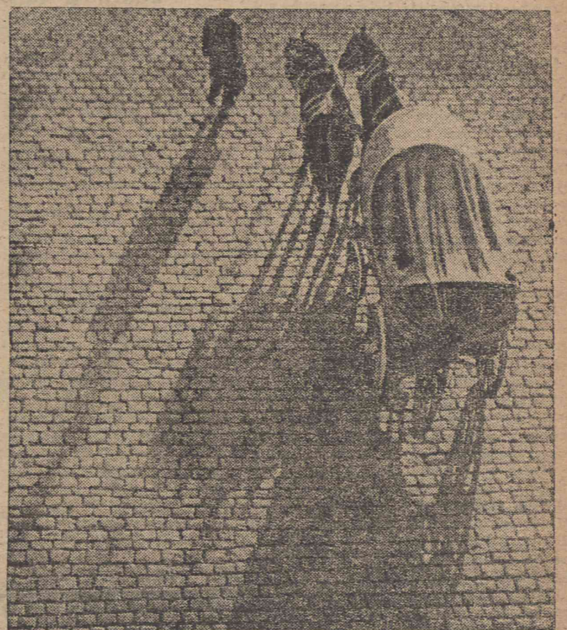
Pod wieczór cień staje się coraz dłuższy...

Unieruchomienie transportu paryskiego — paraliżuje całe życie gospodarcze. W portach francuskich stoją unieruchomione statki euzoziemskie na skutek strajku pilotów. Ponieważ rząd w dalszym ciągu odmawia pertraktacji ze strajkującymi — domagając się ich powrotu do pracy, a nadto chce potrącić płace za czas trwania strajku, w kołach miarodajnych liczą się poważnie z wybuchem strajku powszechnego.