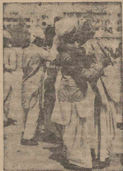
Anglia traci „Perłę Korony”. Hindusi radośnie witają wolność.

miast wprowadzone nowe przepisy celne zmieniają wartość towarów. Dolary szybko topnieją. Rząd Partii Pracy decyduje się na zastosowanie rygorystycznych zarządzeń. Brytyjczyk nie może wyjeżdżać na granicę z powodu ograniczeń dewizowych, samochody stają z powodu braku benzyny. Rząd