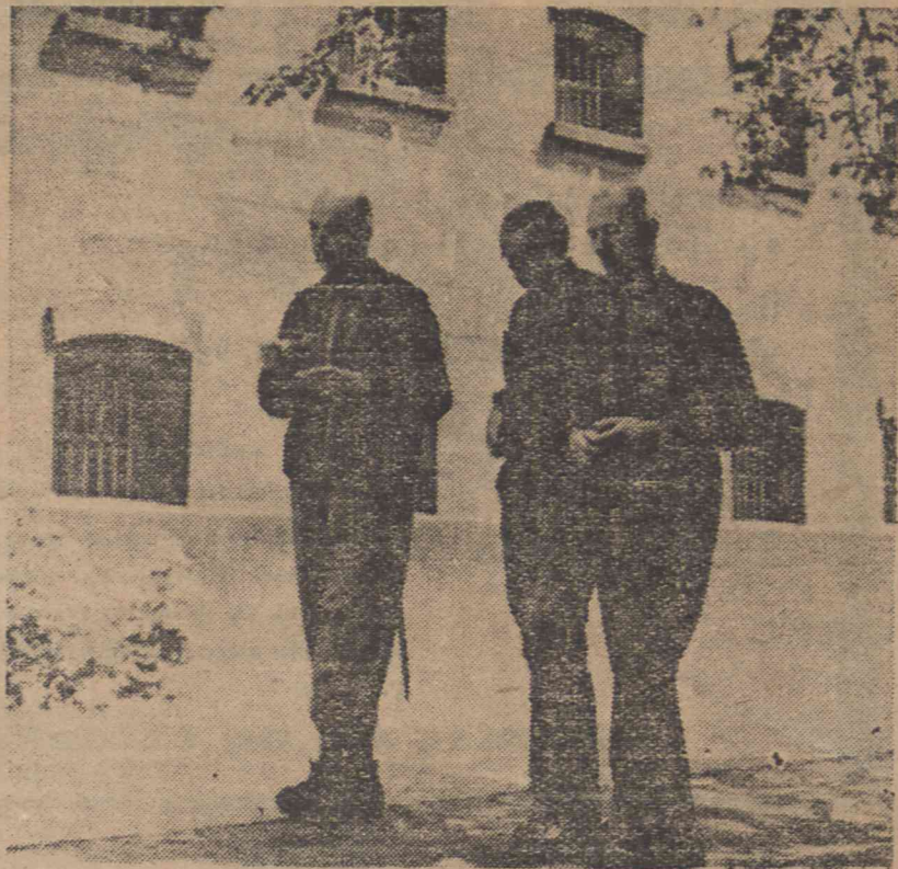
Generałowie niemieccy czekają na wymiar sprawiedliwości za pospolicie morderstwa, gwałty, rozstrzelanie jeńców i ludności cywilnej New York Times Photo Shows.

SAMOCHÓD 3 - tonowy, po remoncie z papierami - sprzedam. Wiadomość: Oleśnicka 22/7. 10018