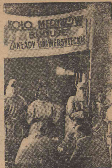
Studenty Wydz. Medycznego tworzą po warszawskich kawiarniach na odbudowę „Domu Medyka” w Warszawie.