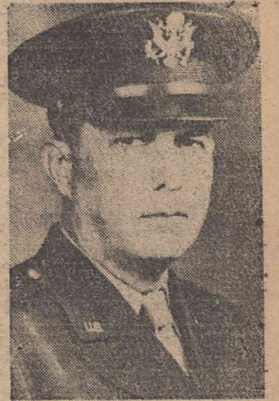
Kenneth Royal, minister wojny USA, sekretarz stanu. Dotychczas był on podsekretarzem wojny i został mianowany przez prezydenta Trumana na miejsce dymisjonowanego Pattersona.

Wobec powrotu Montgomery'ego do Londynu, panika na giełdzie.